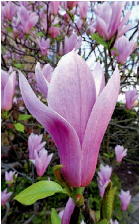
Velikocvjetna magnolija ( Magnolia grandiflora )