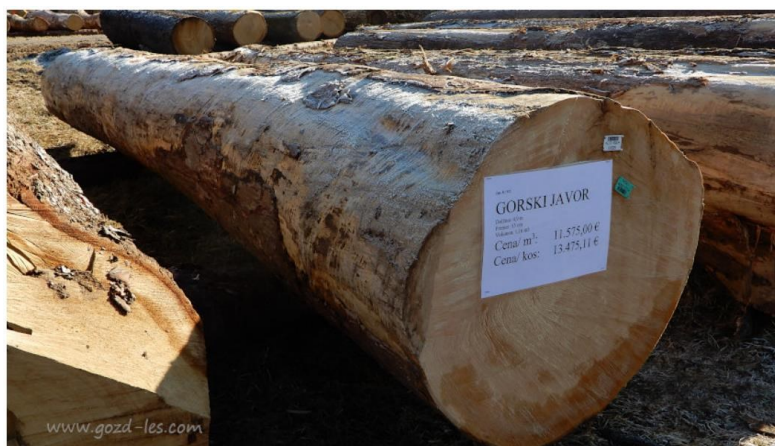
Slika 5. Najskuplje prodani sortiment na licitaciji u Sloveniji ( Izvor: Gozd-les, Rezultati 15. licitacije drva u Slovenj Gradcu – 2021 Rezultati 15. dražbe lesa v Slovenj Gradcu – 2021 | Gozd in gozdarstvo (gozd-les.com) (preuzeto: 14.09.2023.)