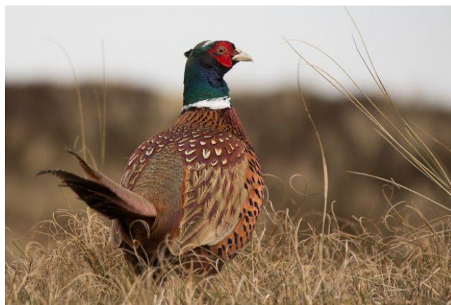
Slika 3. Kineski fazan - Phasianus colchicus torquatu

Kineski fazan - Phasianus colchicus torquatu unešen je iz Kine u Europu potkraj 18. stoljeća. Mužjak na vratu ima tanku bijelu ogrlicu i na glavi pernate uške. Glava mu je tamnije boje sa plavo-ljubičastim odsjajem, tijelo mu je podijeljeno, prsa su mu žutozelene boje, a leđa sužutosmeđa sa crnim prugama. Letna pera su također žutozelena s brojnim crnim pjegama. Ženka je smeđo-sive boje (slika 3.) (Beuković i Popović 2014; Darabuš 2004).