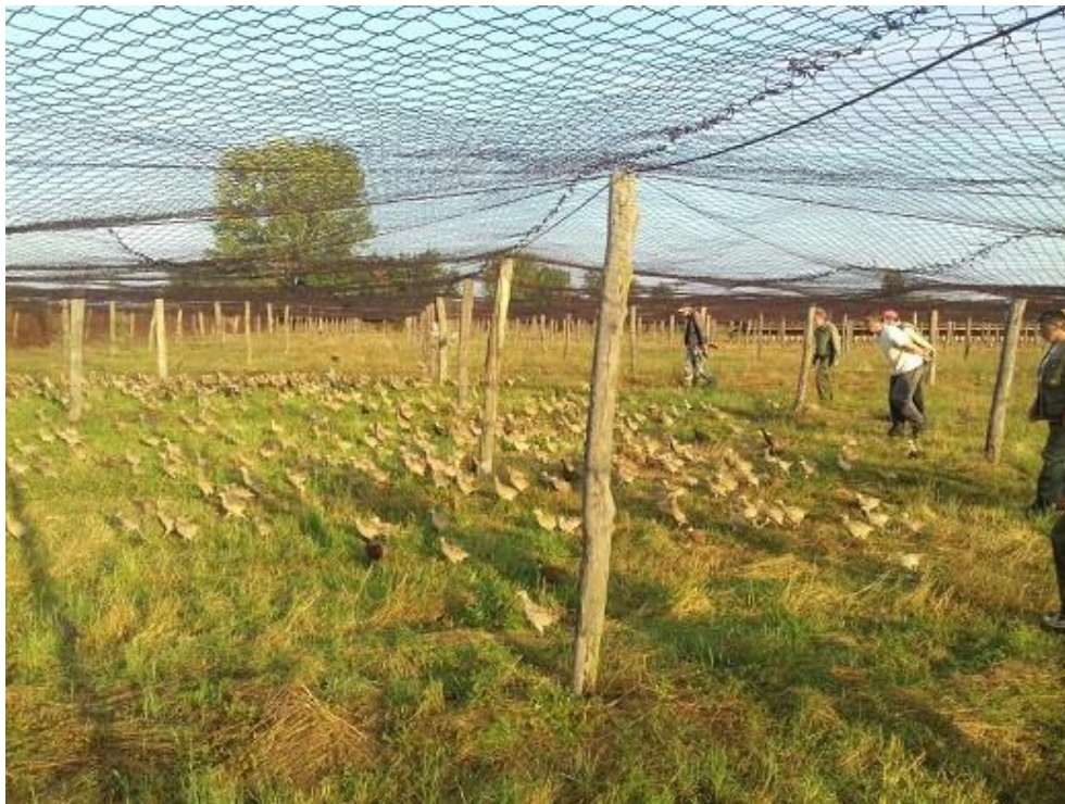
Slika 13. Ispust na travi

Uzgoj u halama s boksevima i ispustima podrazumijeva prostorije veličine 5x4m u kojima je na podu stiropor debljine 1 cm, najlon i stelja. Pri premještanju iz prostora prve faze boksevi moraju biti zagrijani na 30°C, a dolaskom pilića temperatura se podiže na 35°C i ista se održava 11 sati nakon čega se otvaraju otvori za zrak. Dva do tri dana nakon preseljenja pilići se puštaju samo u natkriveni dio kako se ne bi prehladili, a nakon toga puštaju se i u ispust na travi. Noću i po lošem vremenu pilići se utjeruju u bokseve (slika 13.) (Pintur 2010.).