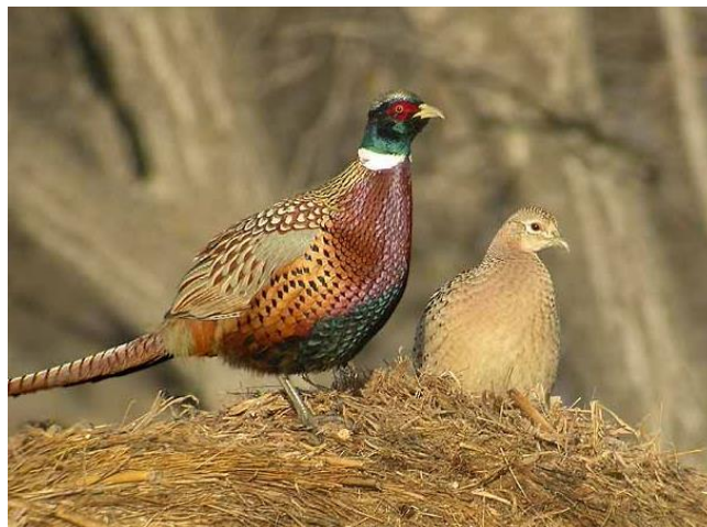
Slika 4. Izgled fazana i fazanke; spolni dimorfizam

Kod svih podvrsta fazana jasno je vidljiv spolni dimorfizam. Tako mužjak ima perje prekrasnih uočljivih boja te je krupniji, dok je ženka nešto manja sa uglavnom sivo smeđim perjem kako bi se što više stopila s prirodom. Tijelo mužjaka može postići dužinu do 60 cm, a rep mu može narasti još toliko. Raspon krila odrasle jedinke mužjaka dosiže do 75 cm, dok mu se masa kreće između 1,2 i 1,6 kg. Kao što je već spomenuto ženka je nešto manja, njezina dužina tijela iznosi do 50 cm, dužina repa je oko 30 cm, a prosječna masa odraslih jedinki je oko 0,9 kg. Osim toga mužjaci imaju jarko crveno obojenje kože na području oko očiju te ostrugu. Ostruga je takozvani peti prst, odnosno izraslini na stražnjem dijelu donje polovine noge. Na taj način možemo i procijeniti starost jedinke. Stariji mužjaci imaju dulje i šiljatije ostruge, dok oni mladi imaju kratke i zaobljenije. Starost ženskih jedinki možemo procijeniti pomoću mekoće i savitljivosti donjeg kljuna. U starijih jedinki kljun je manje savitljiv nego kod mladih. Rep fazana sastoji se od 18 pera, srednja dva su značajno duža. Prednja tri prsta povezana su kožicom, nokti su kratki zakrivljeni i veoma oštri (slika 4.).