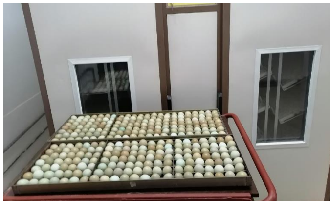
Slika 11. Pripremljena fazanska jaja za umetanje u inkubator

Jaja umećemo u prethodno dezinficiran, prozračan i zagrijan inkubator. Inkubatori u fazanerijama velikih su dimenzija te se jaja umeću u ladice. Temperatura u inkubatoru mora biti od 37,7-37,8°C uz vlagu zraka od 60%. Jaja se do 21 dana okreću svaka 2-3 sata. 21. dan jaja se prestaju okretati, temperatura se smanjuje na 37,2-37,5°C, a vlaga zraka se povećava na 90%. Nakon tri do četiri dana dolazi do valjenja pilića nakon čega se pilići suše i premještaju u 1. fazu uzgoja u toplim baterijama. Valivost pilića je 65-75%, a masa jednog pilića oko 21 gram (slika 11.) (Pintur 2010.).