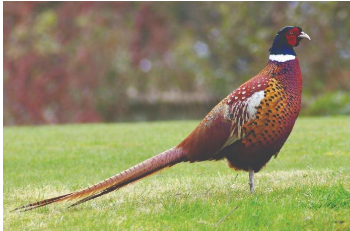
Slika 2. Mongolski fazan- Phasianus colchicus torquatu

Mongolski fazan- Phasianus colchicus torquatu u Hrvatsku je došao krajem 18. stoljeća iz Kine. On na vratu ima bijelu ogrlicu, ali nema pernate uške. Glava je tamne bije s ljubičastim odsjajem, tijelo je crvenkasto smeđe boje, rep je crvenkasto crn, a pera su srebrnosiva. Ženka se od ostale spomenute dvije vrste odlikuje znatnije svjetlijom bojom perja smeđe-sive nijanse. Masom ova vrsta fazana je najkrupnija (slika 2.).