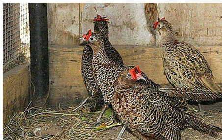
Slika 10. Fazanke sa zaštitnim naočalama

U matičnom jatu važno je da fazani nose naočale radi sprječavanja međusobnog razbijanja jaja. Mužjacima se u vrijeme parenja skidaju naočale radi lakše oplodnje, skraćuje im se ostruga te im se smanjuje vrh kljuna kako bi se smanjilo ozljeđivanje koka (slika 10.) (Pintur 2010.).