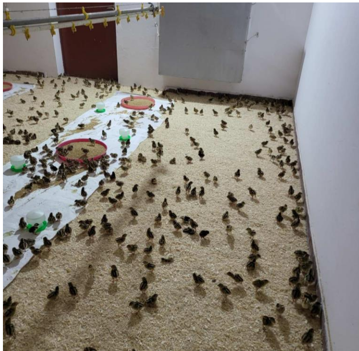
Slika 12. Podni uzgoj fazana

Postoje dva načina uzgoja u prvoj fazi. To je podni uzgoj i baterijski sustav. Podni uzgoj ili sustav uzgoja pod umjetnom kvočkom primjenjuje se u zatvorenim halama. Na 1m 2 stavlja se 50 fazana. Na podu se nalazi stelja visine oko 10 centimetara, površina se ograđuje ogradom promjera 120cm, a iznad se postavlja grijalica. Ukoliko grijalica nema svjetlo potrebno im je osigurati dodatnu sijalicu. Koriste se nagazna hranilice, te pojilice iz kojih je onemogućeno sipanje hrane i vode (slika 12.).