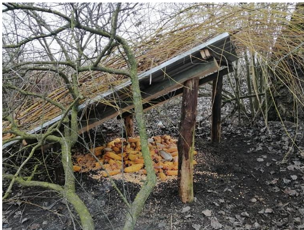
Slika 6. Hranilice za fazane u lovištu