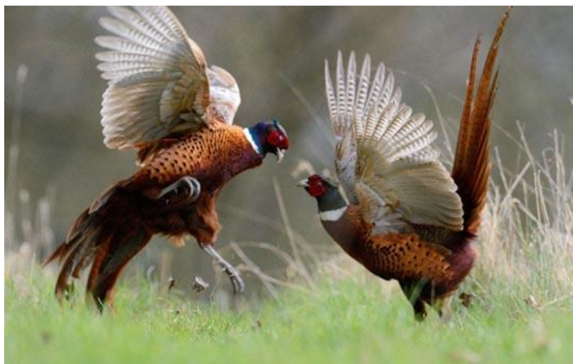
Slika 8. Borba pijetlova za teritorij

Pilići su potrkusci, pokriveni perjem i vide, tako da se nakon valjenja vrlo brzo počnu kretati. Prvi pokušaji letenja događaju se krajem prvog tjedna, a u sedmom tjednu života oni normalno lete. Nakon desetog tjedna života oni se osamostaljuju i nije im više potrebna majčinska briga. Tako mladi fazani koji se izlegu krajem srpnja ili početkom lipnja postaju samostalni tijekom rujna iste godine (Janicki i dr. 2005.).