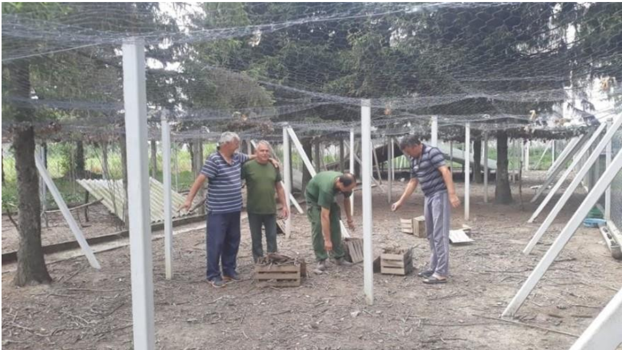
Slika 14. Priprema prihvatilišta za prihvat fazana

Treća faza uzgoja pomlatka uključuje razvoj pilića od 5-8 tjedna života. U tom periodu pilići se drže u natkrivenom dijelu sa travnatim ispastom. U slučaju kiše fazani se utjeruju u natkrivene dijelove kako bismo spriječili štete od kiše. U dobi od 43-45 dana fazanima se stavljaju zaštitne naočale kako bismo spriječili kanibalizam i sačuvali dobru operjanost fazana. U prvim danima nakon premještanja fazana iz druge u treću fazu potrebno im je u hranu stavili vitamine zbog nastalog stresa. Na kraju ove faze fazani se mogu prodati lovoovlaštenicima koji imaju izgrađeno prihvatilište za prihvat fazanskih pilića (slika 14.) (Pintur 2010.).