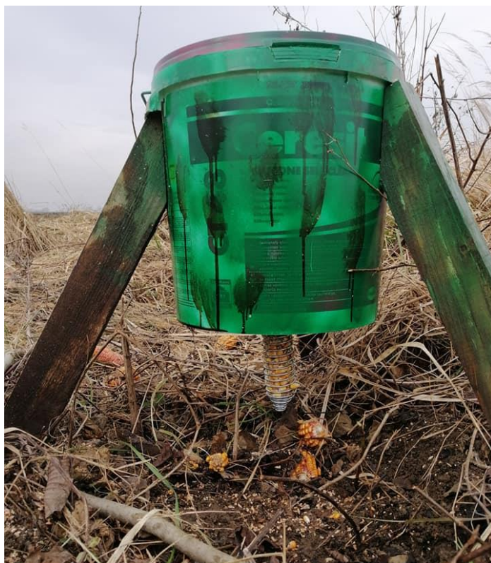
Slika 5. Hranilice za fazane u lovištu