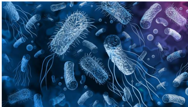
Slika 7. Izgled bakterijske bolesti salmoneloze

Bolesti koje napadaju fazane su klostridioza, streptokokoza, kolibaciloza i salmoneloza od bakterijskih bolesti te bolest mramorne slezene od virusnih oboljenja. Ove bolesti su zarazne i od njih u prirodi fazani rijetko ugibaju. Osim zaraznih bolesti prisutne su i parazitna oboljenja kao što su singamoza i toksoplazmoza. U umjetnom uzgoju javljaju se i kronična respiratorna bolest, kokcidioza te klamidioza (slika 7.) (Janicki i dr. 2005.).