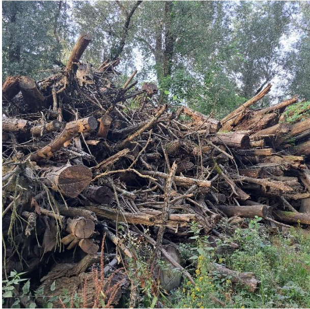
Slika 7. Uhrpana sirovina na radilištu