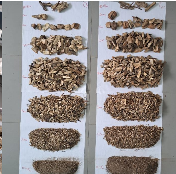
Slika 24. Uzorak drvene sječke prosijan na frakcije