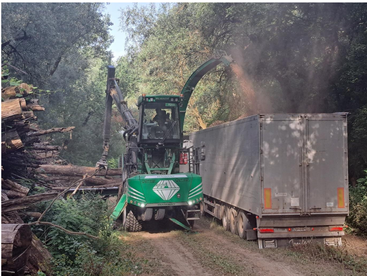
Slika 16. Iveranje na pomoćnom stovarištu