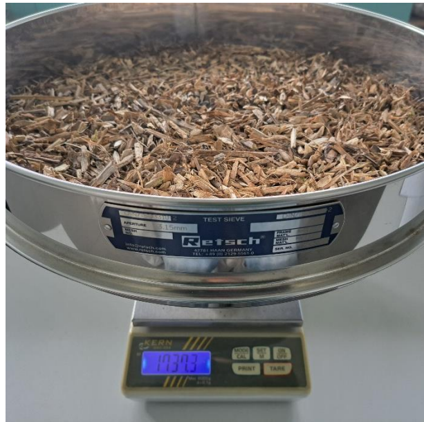
Slika 22. Određivanje mase frakcije veličine 3,15–8 mm

Čestice duljine > 100 mm svrstane su u frakcije prema duljini (100–150 mm, 150–200 mm, 200–250 mm, 250–300 mm, >300 mm). Masa predugih čestica u pojedinoj frakciji također je određena s točnošću od 0,1 g. Izdvojena je najduža čestica kojoj je osim duljine u milimetrima izmjeren i srednji promjer u centimetrima. Uz najdužu česticu izdvojena je i čestica ( > 100 mm) s najvećim srednjim promjerom (slika 23). Klasifikacija drvene sječke prema razredima dimenzija obavljena je sukladno normi HRN EN ISO 172251-1:2021.