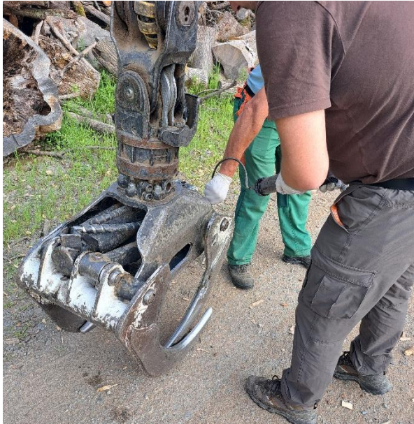
Slika 17. Podmazivanje hvatala na dizalici iverača