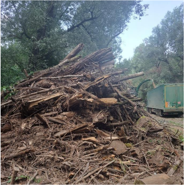
Slika 8. Iveranje uhrpane sirovine na radilištu