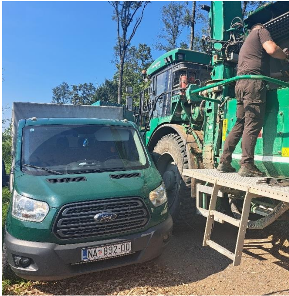
Slika 25. Promjena noževa i točenje goriva