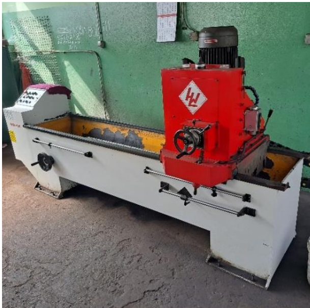
Slika 14. Stroj za oštrenje noževa »GRINDER 1700AM«