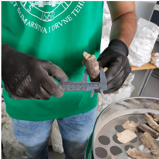
Slika 23. Izmjera srednjeg promjera

Čestice duljine > 100 mm svrstane su u frakcije prema duljini (100–150 mm, 150–200 mm, 200–250 mm, 250–300 mm, >300 mm). Masa predugih čestica u pojedinoj frakciji također je određena s točnošću od 0,1 g. Izdvojena je najduža čestica kojoj je osim duljine u milimetrima izmjeren i srednji promjer u centimetrima. Uz najdužu česticu izdvojena je i čestica ( > 100 mm) s najvećim srednjim promjerom (slika 23). Klasifikacija drvene sječke prema razredima dimenzija obavljena je sukladno normi HRN EN ISO 172251-1:2021.