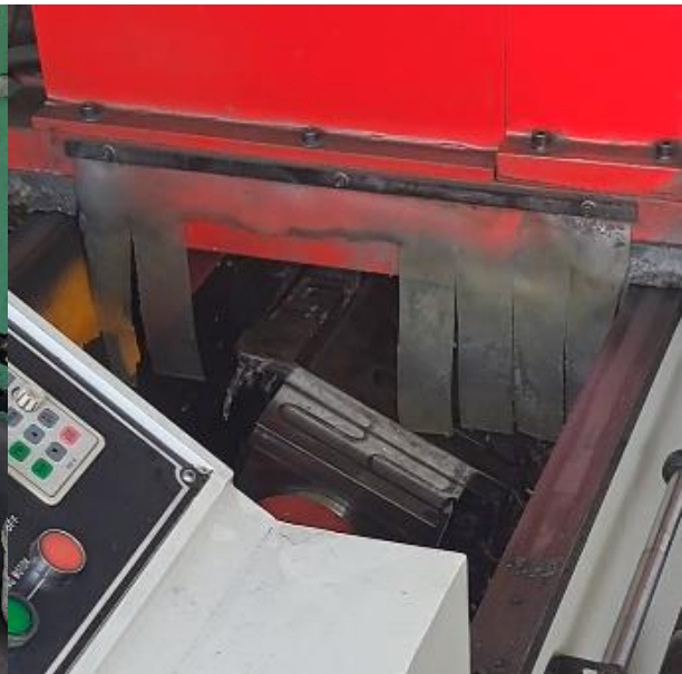
Slika 15. Oštrenje garniture noževa na stroju »GRINDER 1700AM«

Radilište je bilo organizirano na način da je iveranje obavljano uz šumsku cestu (slika 16) dovoljne širine za nesmetano mimoilaženje kamiona. Prazan kamion dolaskom na radilište morao se polukružno okrenuti na 750 m udaljenoj »T« okretnici, a potom paralelno namjestiti uz iverač nakon čega je uslijedio proces iveranja drvene sječke u kamion.