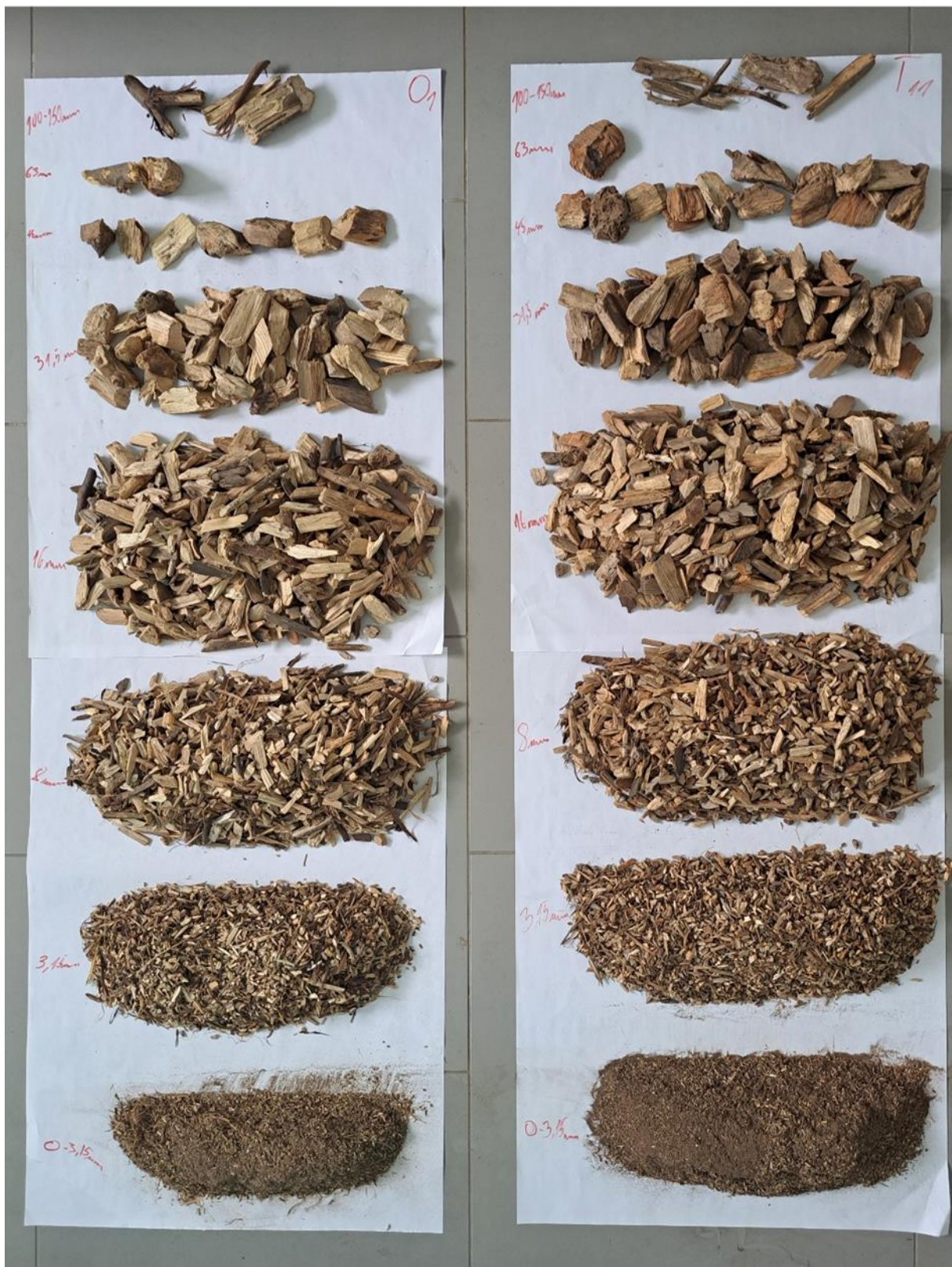
Slika 31. Uzorak drvene sječke prosijan na frakcije, lijevo uzorak O1 (oštri noževi) i desno uzorak T11 (tupi noževi)

Iako oštrina noža nije utjecala na granulometrijski sastav i proizvodnost iverača, na slikama 32 i 33 je prikazan utjecaj oštrine noža na finoću reza površine pojedinog komada drvene sječke. Tako se može vizuaom procjenom primjetiti kako oštar nož (bez obzira na stanje