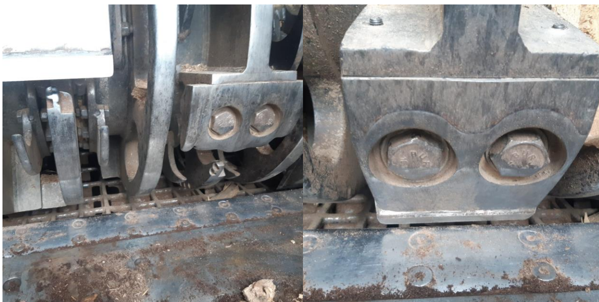
Slika 3. Kontranož na bubanjskom iveraču