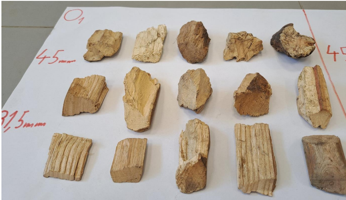
Slika 32. Uzorak O1 proizveden oštrim noževima

sirovine) ima pravilan i gladak rez dok tupi nož proizvodi drvenu sječku čija je površina nepravilne i hrapave teksture.