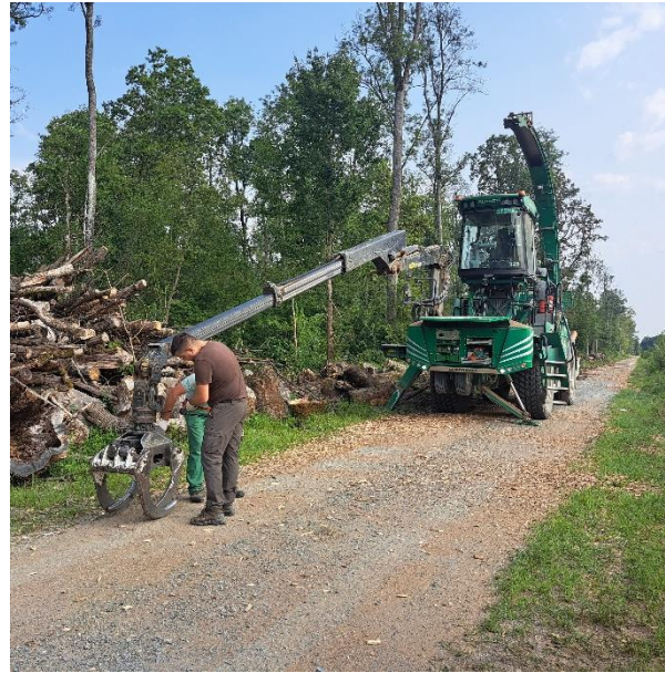
Slika 26. Podmazivanje iverača