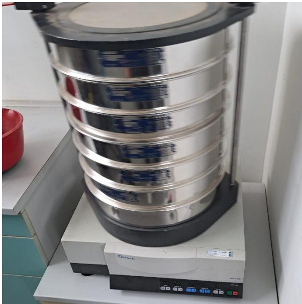
Slika 21. Uređaj za prosijavanje »Retsch AS 400 control«