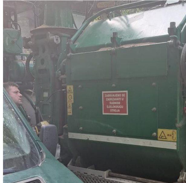
Slika 18. Podmazivanje bubnja na iveraču