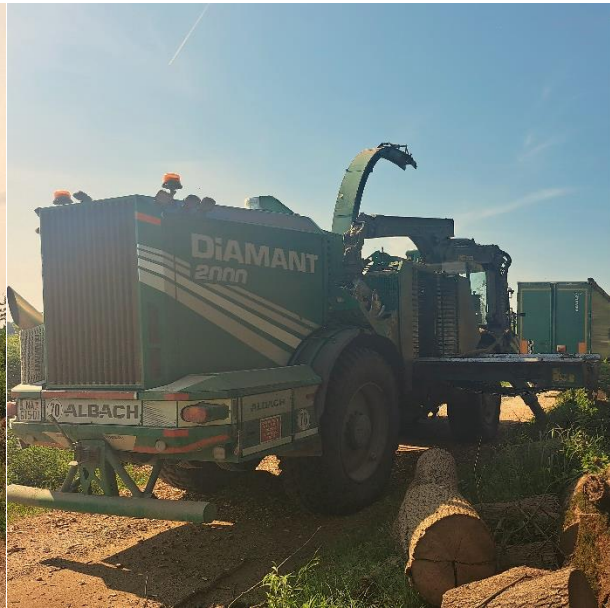
Slika 11. Iverač Albach Diamant 2000 stražnja strana

Korišteni noževi nazivne su duljine 35 cm s mogućnošću brušenja do duljine 31 cm. Širina noža iznosi 20 cm, a visina 2,5 cm. Korišteni kut rezanja je 27^\circ i 25^\circ . Masa pojedinog noža iznosi 10,31 kg. Oštrenje tupih noževa obavlja se na automatiziranom stroju »GRINDER 1700AM« (slika 14 i 15). U proces oštrenja na magnetni stezni stol postavi se kompletna garnitura od 6 noževa koji se automatski oštire. Kut oštrenja je moguće podesiti od \pm 90^\circ no za potrebe iveranja koriste se kutevi oštrenja 25^\circ i 27^\circ . Uređaj za oštrenje ima sustav hlađenje oštrica tokom brušenja te koristi 80 l tekućine u omjeru 1:20 (emulzija:voda) kako bi se spriječilo začepljenje sustava tijekom brušenja.