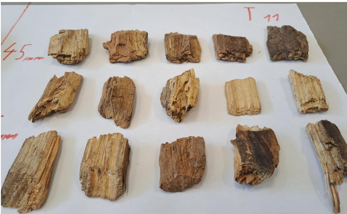
Slika 33. Uzorak T11 proizveden tupim noževima