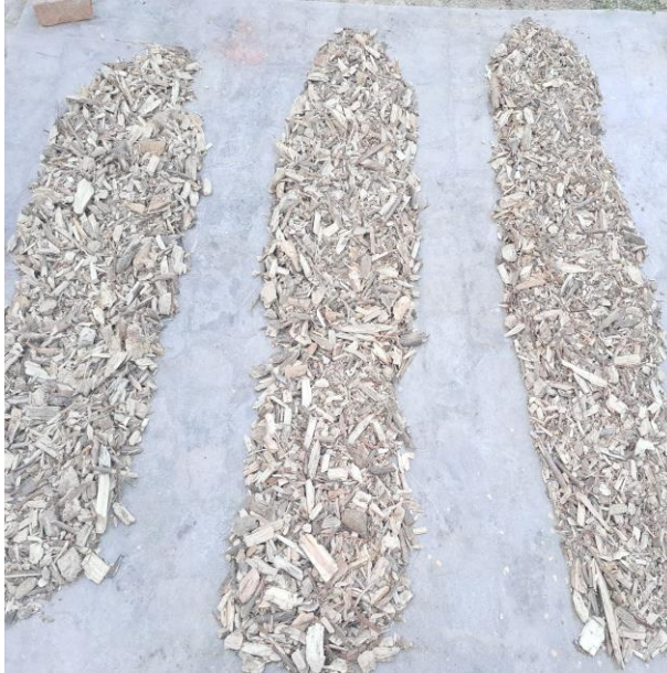
Slika 19. Prirodno prosušivanje drvene sječke