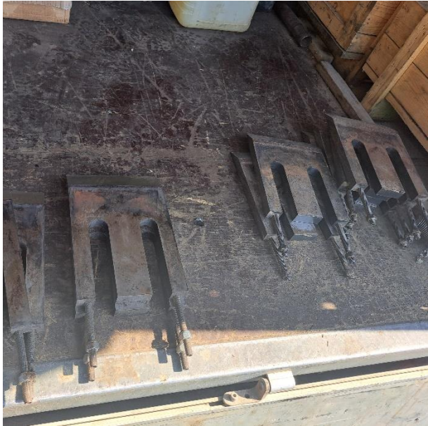
Slika 12. Garnitura oštarih noževa