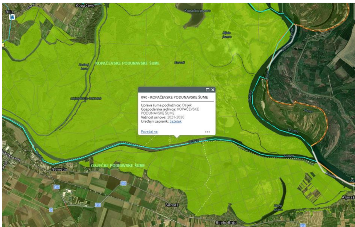
Slika 5. Mjesto istraživanja – šumarija Darda ( http://javni-podaci.hrsume.hr/ )

Istraživanje je provedeno na području šumarije Darda u gospodarskoj jedinici »Kopačevske podunavske šume« (slika 1) gdje su iverane ovršine koje su izvezene na pomoćno stovarište iz odsjeka 53b (radilište Mali Bajar-Naturavita).