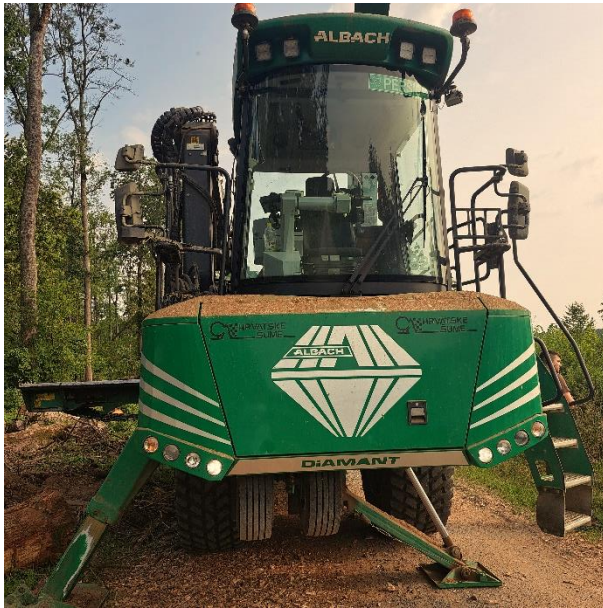
Slika 10. Iverač Albach Diamant 2000 prednja strana

Iverač ima ugrađen rotor sedme generacije na kojem se nalazi 6 čeličnih noževa koji imaju mogućnost promjene kuta sječenja. Noževi su lako promjenjivi, a oštrenje se obavlja uglavnom strojno. S obzirom na mogućnost lake izmjene noževa, a s druge strane mogućnosti lakog zatupljivanja zbog nečistoća u sirovina, zamjenska garnitura noževa uvijek je bila prisutna uz iverač u cilju postizanja optimalne proizvodnosti. Promjer rotora je 1.040 mm, a brzina okretaja bubnja 420 o/min. Tijekom istraživanja dvočlana ekipa sudjelovala je u pripremi i održavanju stroja kao i neposrednom rukovanju strojem.