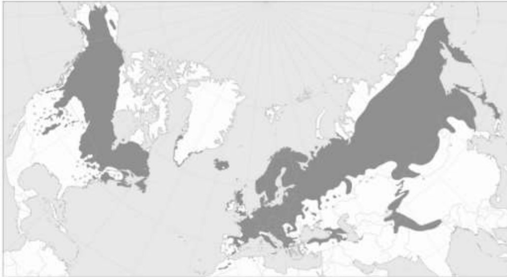
Slika 4. Prirodna rasprostranjenost Juniperus communis

Obična borovica je vrsta izrazito široke ekološke valencije te je najrasprostranjenija četinjača na Zemlji, čiji areal obuhvaća cijelu sjevernu polutku, tj. sjevernu Afriku, čitavu Europu, srednju i sjevernu Aziju i Sjevernu Ameriku (Slika 4). U južnoj Europi rasprostire se u brdskim područjima. U svojim zahtjevima na bonitet tla je veoma skromna. Osim toga, dobro podnosi ne samo niske zimske temperature, nego i ekstremne ljetne temperature (Herman 1971).