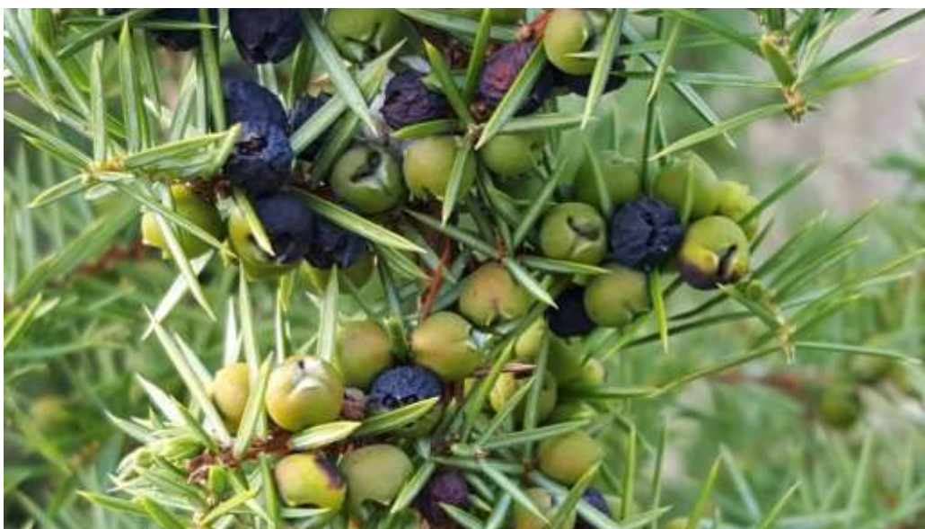
Slika 3. Igličasti listovi s bobuljastim češerima