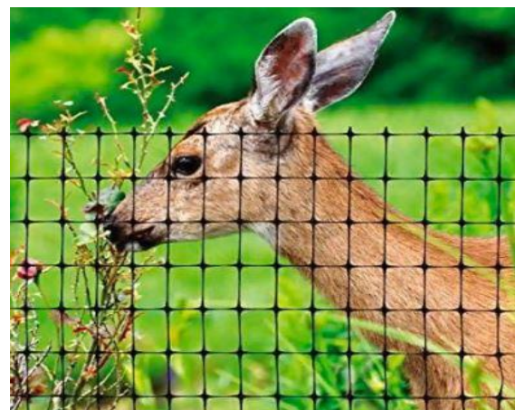
Slika 13. Ograda od plastične mreže