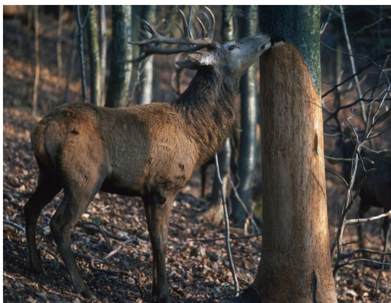
Slika 2. Nastajanje štete od jelena običnog

Najvažnija mjera zaštite stabala je održavanje normalnog brojnog stanja jelenske divljači. Također, stabla se mogu zaštititi polietilenskim štitnicima ili trskom te korištenjem repelenata (Glavaš, 2012).