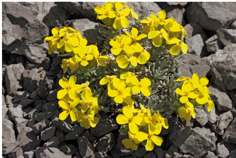
Slika 1 Velebitska degenija je endemični rod i vrsta u Hrvatskoj (izvor: Hrvatski planinarski savez, 115 godina od pronalaska velebitske degenije https://www.hps.hr/vijesti/14207/115-godina-od-pronalaska-velebitske-degenije/ , pristupljeno 09. 09. 2024.)