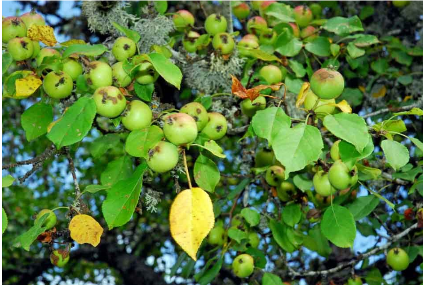
Slika 6 Šumsko drveće jestivih plodova – divlja jabuka (izvor: Arbolapp, Malus sylvestris https://www.arbolapp.es/en/species/info/malus-sylvestris/ , pristupljeno 09. 09. 2024.)