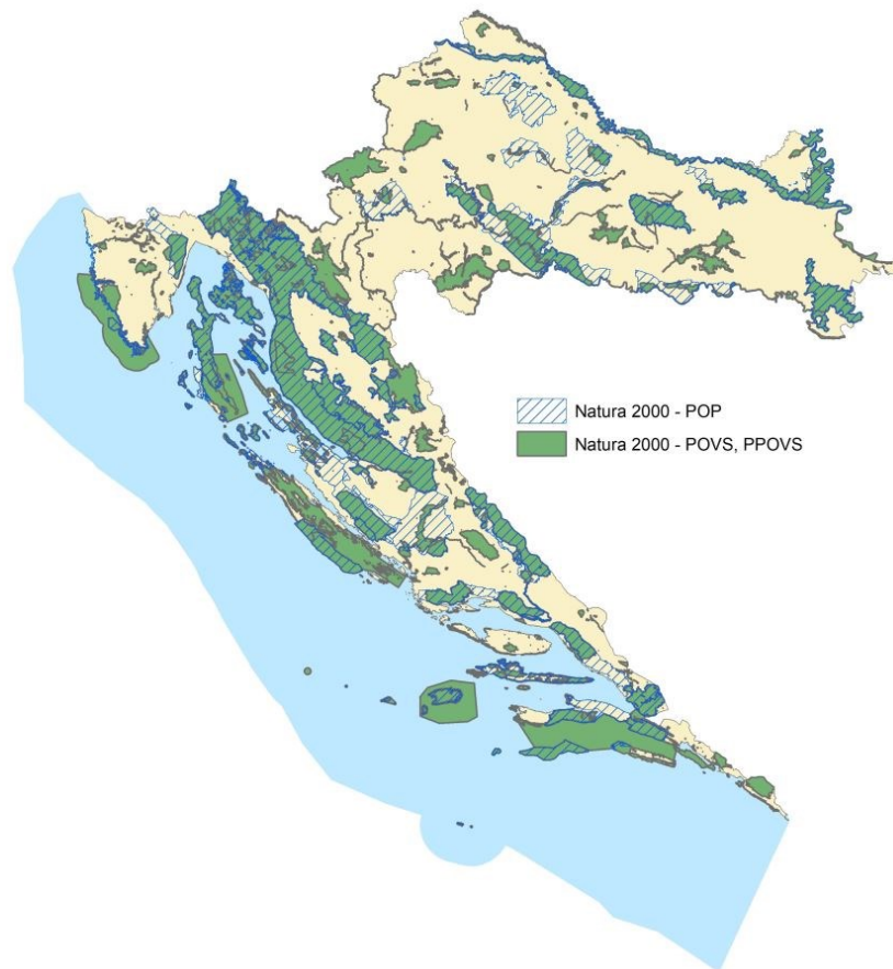
Slika 4 Karta područja ekološke mreže NATURA 2000 u Hrvatskoj (izvor: Ministarstvo zaštite okoliša i zelene tranzicije, Ekološka mreža https://www.haop.hr/hr/tematska-podrucja/odrzivo-koristenje-prirodnih-dobara-i-ekoloska-mreza/ekoloska-mreza , pristupljeno 09. 08. 2024.)

Ekološka mreža Republike Hrvatske obuhvaća 25.956 km 2 i uključuje 36,8% kopnenog teritorija i 9,3% morskog područja koja su pod državnom nadležnosti, a uključuje 745 područja očuvanja važnih za vrste i stanišne tipove (POVS) te 38 područja očuvanja značajnih za ptice (POP).