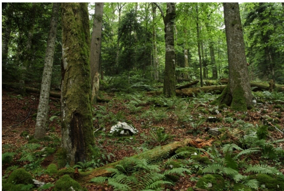
Slika 2 Prašumski ekosustavi kao što je prašuma Čorkova uvala u NP Plitvička jezera odlikuju se velikom prirodnom biološkom raznolikošću