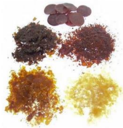
Slika 7. Šelak (Jirouš-Rajković, 2023)