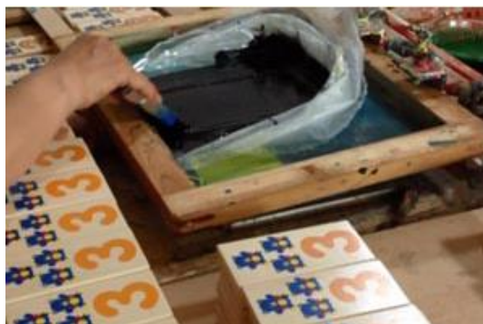
Slika 27. Sitotisak ( https://pengvetoys.com/ )