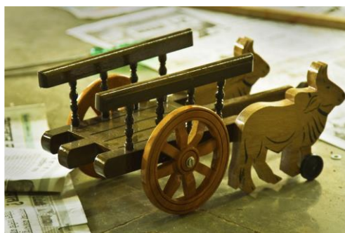
Slika 15. Volovska kolica (Bibhudutta Baral i dr., 2016)