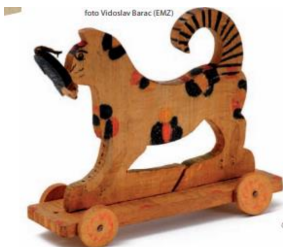
Slika 4. Mačka i miš, Vidovec, 1948.godine (Barac, 2013)

U selu Vidovec na istočnim obroncima Zagrebačke gore, 1932. godine započinje organizirana izrada drvenih dječjih igračaka osnivanjem seljačke Zadruga. Izrađivali su ih uvijek muškarci, a oslikavale najčešće žene. Uglavnom se radilo o životinjskim likovima (slika 4), osim životinja izrađivali su i prijevozna sredstva, kao i predmete vezane za kućanstvo. Drvo za izradu su nalazili na obroncima Medvednice (Biškupić Bašić, 2013).