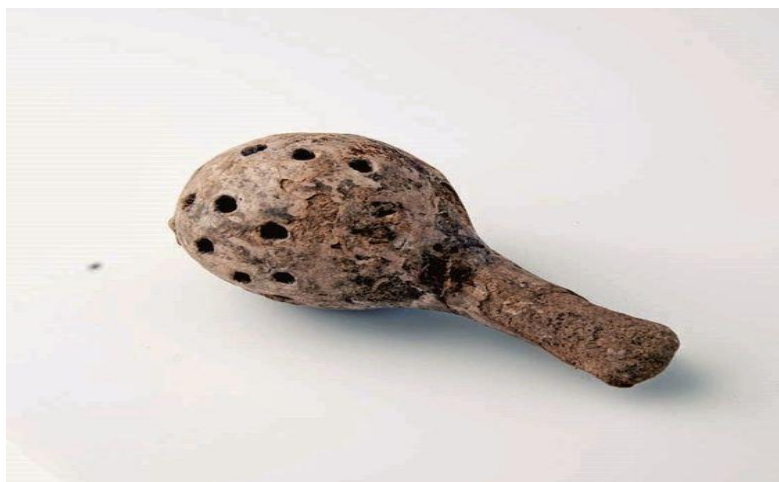
Slika 1. Primjerak zvečke od prije 2000.g. pr. Kr. ( https://pino-toys.rs/kako-su-rasle-drvene-igracke-pino-toys-vam-prica/ )

Igračke su bile važan dio djetinjstva još od ranih civilizacija, one su izrađivane od drva, u to vrijeme široko dostupnog i korištenog materijala (slika 1). Najranije poznate drvene igračke potječu iz starog Egipta, gdje su se djeca igrala s lutkama, životinjama i sl. U dalekoj povijesti drvene igračke su prvenstveno imale edukativnu ulogu, a tek nakon toga i zabavnu. Igra je spremala djecu za brojne poslove i obaveze koje su ih čekali (djevojčice – posude, lutke, zvečke) odnosno stvari koje se koriste u domaćinstvu, a dječaci – koplja, mačevi, životinje, konji na kotači i sl. Odnosno stvari za preživljavanje i poslove u polju ili šumi (slika 2) ( https://pino-toys.rs ).