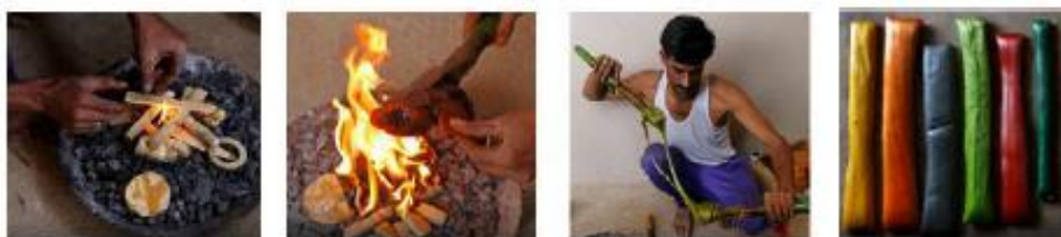
Slika 20. Proces izrade boje (Uma, Shankar, Krishnan, 2021)

Kao premaz se koristi šelak koji se dobiva iz naslaga koju proizvodi kukac ( Tachardia lacca Kerr.). Obično se nalazi na kori drveća u šumovitim predjelima. U vrijeme vladavine Tipa Sultana šelak se nalazio u šumama u blizini Channapatne. Međutim, sada se šelak uvozi iz drugih dijelova Indije. Priprema šelaka se vrši tako da se zagrijava na štapiću dok ne postane savitljiv. U omekšani šelak se dodaje mala količina litofona i miješa se dok se ne pojavi bijela nijansa. Zatim se u smjesu doda prirodna boja i miješa se dok se ne dobije željena nijansa (slika 20) (Uma i dr., 2021).