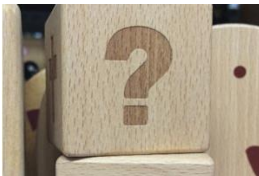
Slika 28. Lasersko graviranje

- tehnike koje koriste su vrući pečat i lasersko graviranje (slika 28).