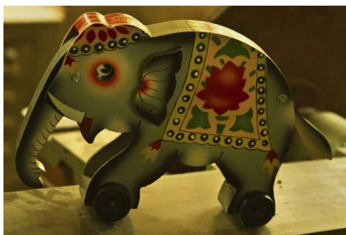
Slika 14. Šareni slon s kotačićima (Bibhudutta Baral i dr., 2016)

Oslikani detalji se sastavljaju u jedan komad igračke. Dijelovi se međusobno spajaju s malim čavlicima. Potrebno je najmanje 2 do 3 dana da se završi igračka srednje veličine i 15 do 20 dana da se završi 100 komada takve igračke. Svi se koraci izvod ručno osim brušenja i bušenja. Neke od igračaka koje se dobivaju na kraju su: šarene životinje (slika 20), volovska kolica (slika 21), konj za ljuljanje (slika 22), šetalice napravljene za dojenčad kako bi im pomogla u učenju hodanja (slika 23), drveno voće i povrće (slika 24), sve vrste vozila (Bibhudutta Baral i dr., 2016).