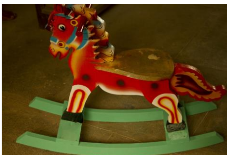
Slika 16. Konj za ljujanje (Bibhudutta Baral i dr., 2016)