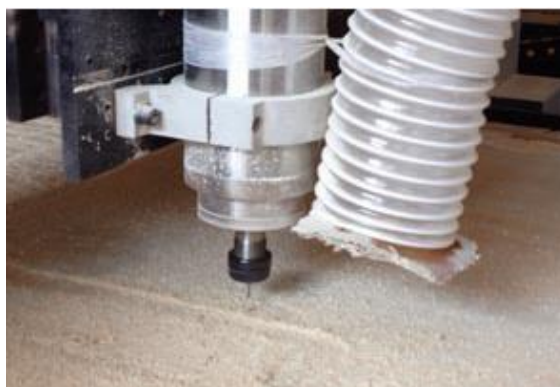
Slika 24. CNC rezanje ( https://pengyuetoyoys.com/ )

- proces rezanja sirovog drva na odgovarajuće veličine i njihove izrade u obliku igračkaka. Tehnike koje se koriste su rezanje žičanom pilom, CNC rezanje (slika 24), lasersko rezanje, bušenje.