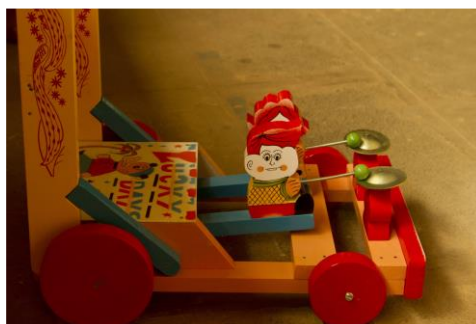
Slika 17. Šetalica za dojenčad (Bibhudutta Baral i dr., 2016)