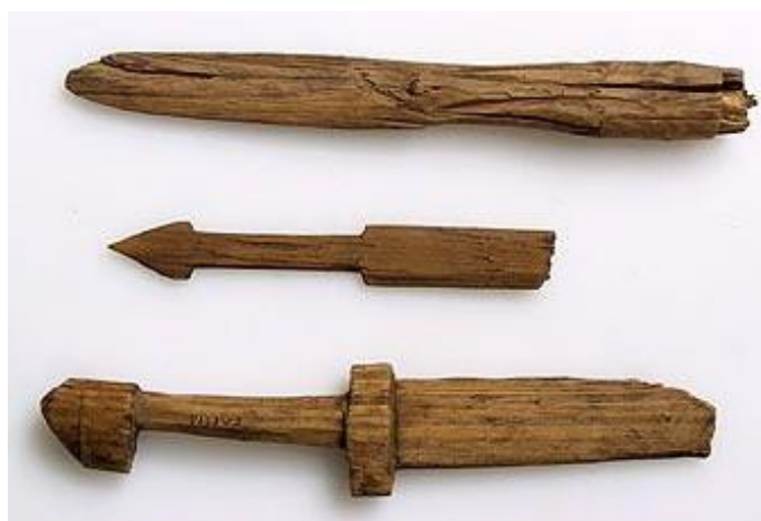
Slika 2. Drvene igračke mačeva i strijela ( https://pino-toys.rs/kako-su-rasle-drvene-igracke-pino-toys-vam-prica/ )