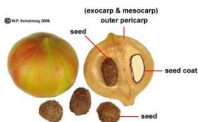
Slika 6. Plod tung drva (Armstrong, 2006)