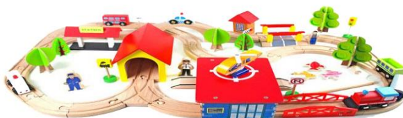
Slika 29. Gotova igračka

- u potrebi za originalnim i jedinstvenim stilom, ručno slikanje je savršen način za napraviti umjetnička djela na igračkama (slika 29).