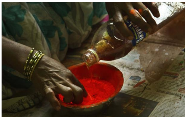
Slika 13. Temeljni premaz za drvo se miješa s prahom boje za pripremu otopine boje (Bibhudutta Baral i dr., 2016)

Oslikani detalji se sastavljaju u jedan komad igračke. Dijelovi se međusobno spajaju s malim čavlicima. Potrebno je najmanje 2 do 3 dana da se završi igračka srednje veličine i 15 do 20 dana da se završi 100 komada takve igračke. Svi se koraci izvod ručno osim brušenja i bušenja. Neke od igračaka koje se dobivaju na kraju su: šarene životinje (slika 20), volovska kolica (slika 21), konj za ljuljanje (slika 22), šetalice napravljene za dojenčad kako bi im pomogla u učenju hodanja (slika 23), drveno voće i povrće (slika 24), sve vrste vozila (Bibhudutta Baral i dr., 2016).