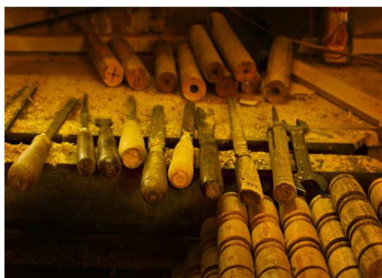
Slika 9. Različiti tipovi turpija i dlijeta (Bibhudutta Baral i dr., 2016)