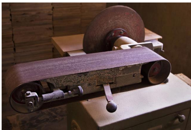
Slika 10. Stroj za brušenje (Bibhudutta Baral i dr., 2016)

Sawantwadi igračke su u osnovi izrađene od drva manga koje se koristi za izložbene predmete, dok su volovska kola i konjići za ljuljanje izrađeni od Shivani drva. U početku izrade se odlučuje o dizajnu igračkaka i izrađuje se uzorak igračke koji se ispituje i određuje se potrebno vrijeme za izradu jedne igračke. Ako je obrtnik zadovoljan s dizajnom i vremenom potrebnim za izradu, odobrava izradu više igračkaka. Uzorak se drži na elementu drva i uokolo se ucrtavaju