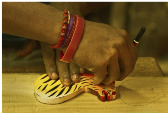
Slika 11. Označavanje oblika igračke na drvenoj dasci (Bibhudutta Baral i dr., 2016)

obrisi (slika 17). Označena daska se uzima za proces rezanja koji se vrši pomoću tanke oštrice (slika 18). Svi izrezani komadi idu dalje na proces brušenja (Bibhudutta Baral i dr., 2016).