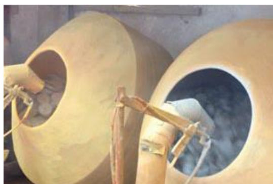
Slika 26. Obrada u bubnjevima ( https://pengvuetovs.com/ )