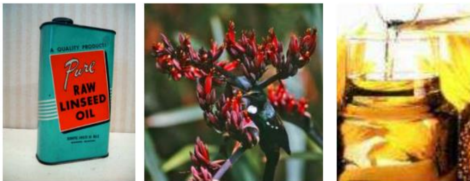
Slika 5. Laneno ulje (Stipanelov Vrandečić,2023)

prešanjem sjemenki lana, pročišćava se (rafinirano ulje), često se kemijski bijeli, neutralizira i filtrira (bijeljeno laneno ulje). Drži se u tamnim, dobro zatvorenim bocama da bi se spriječila oksidacija (slika 5). Osušeni premaz lanenog ulja naziva se linoksin i ne otapa ga terpentin, niti benzin (Jirouš-Rajković, 2023a).