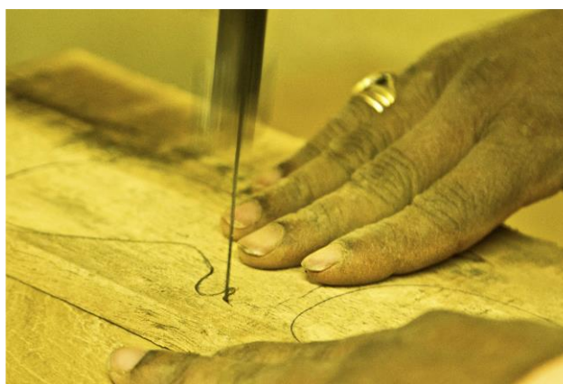
Slika 12. Automatizirani tanki list pile koriste se za rezanje drvenih daski (Bibhudutta Baral i dr., 2016)

Drvene igračke obojene su živim bojama kako bi izgledale privlačno. Ranije su obrtnici koristili prirodne boje dobivene iz voća i povrća, a sada se koriste boje na bazi ulja. Različite nijanse praha u boji dobro se pomiješaju s temeljnim premazom za drvo (slika 19). Većinom se boja nanosi kistom kako bi se dobila tekstura mrlja, ali nanosi se i sprejom kako bi se uštedilo vrijeme. Igračke su obojene s tri sloja premaza. Kada se boja osuši majstori slikaju detalje poput izraza lica i obrisa. Na kraju se na njima nanosi sloj temeljnog premaza za drvo koje daje sjaj konačnim proizvodima (Bibhudutta Baral i dr., 2016).