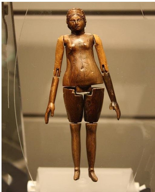
Slika 3. Drvena lutka iz Rimskog carstva, pronađena u dječijoj grobnici

U kasnijem periodu, u Starom Egiptu i Grčkoj, igračke su služile više za zabavu. Međutim, igračke su počele poprimati nova značenja i funkcije. Postale su simbol bogatstva, pa se se djelile na one za bogate i one za siromašne. U starom Egiptu i Rimu pronađene su brojne igračke u dječjim grobnicama, koje su imale ulogu da isprate i zabavljaju dijete u drugom svijetu u koje su vjerovali da odlazi (slika 3) ( https://pino-toys.rs ).