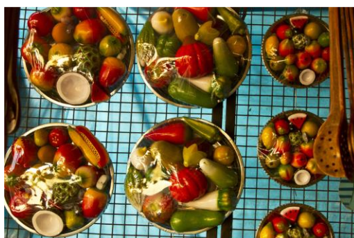
Slika 18. Drveno voće i povrće (Bibhudutta Baral i dr., 2016)