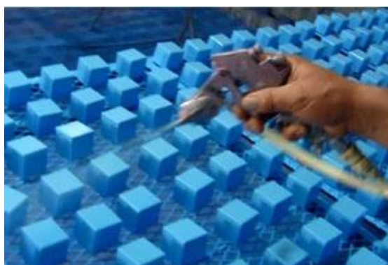
Slika 25. Nanošenje premaza sprejom ( https://pengvuetovs.com/ )

- sve igračke imaju više od jednog sloja premaza kako bi se osigurala lijepa završna obrada i dobro prijanjanje. Prvo se nanosi temeljni premaz, koji se ponovno brusi kako bi površina premaza bila glatka, zatim se nanosi drugi sloj premaza. Nakon svakog sloja premaza, potrebno je brusiti dijelove za sljedeći sloj premaza, sve dok završni sloj ne bude gotov. Tehnike koje se koriste su nanošenje premaza štrcanjem (slika 25) ili obrada u bubnju (slika 26).