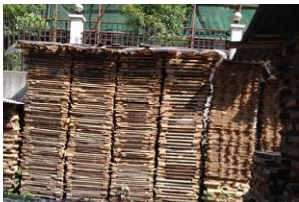
Slika 23. Daske u složajevima

- drvene daske bit će složene na otvorenom da se prirodno osuše (slika 23). Drvene igračkake se kreću izrađivati tek kada sadržaj vode u drvu padne ispod 15 %, što je bitno za sprječavanje plijesni na drvenim igračkakama.