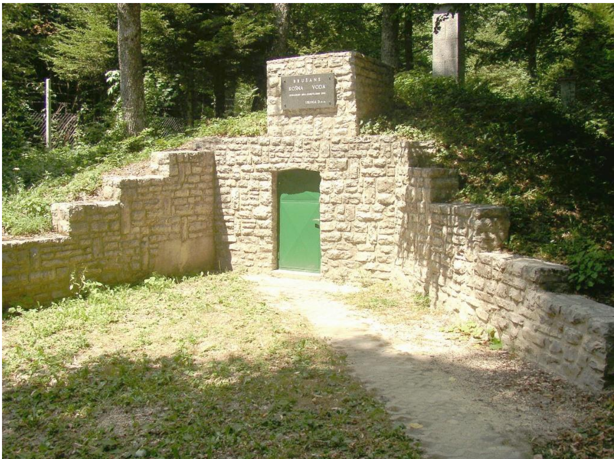
Slika 15.Prikaz izvora

Vodovod je 1893. godine doveden do Gospića, a 1894. godine, nakon završetka radova, u središtu grada postavljen je željezni spomenik, djelo nepoznatog autora, koji je dobio ime Marta po prvoj ženi koja je došla po vodu. U zaštitnom području oko izvora nije predviđeno provođenje šumskouzgojnih radova.