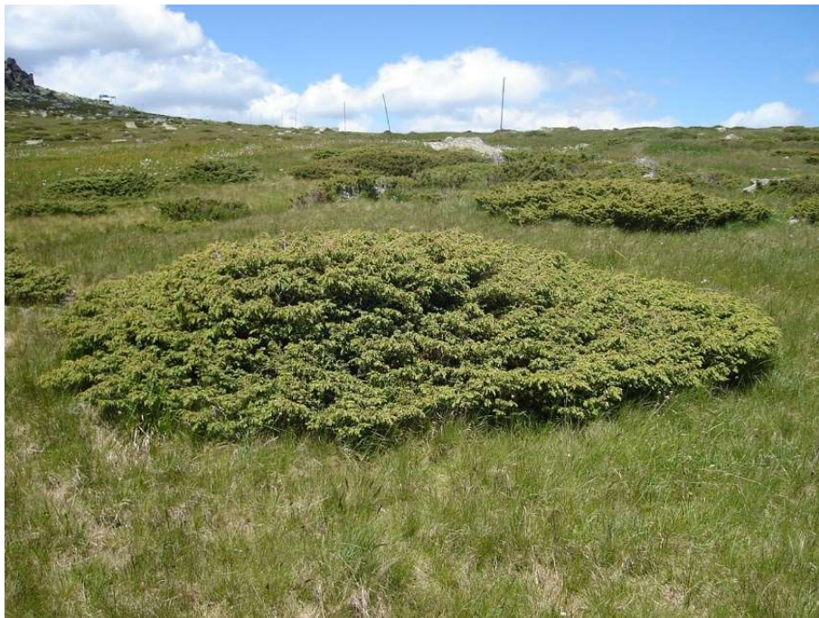
Slika 2. Habitus klečice.

Klečica je dvodomna svojta (Idžojić 2013), pa tako razlikujemo muške i ženske biljke. Muške biljke na sebi nose muške valjkaste i žute cvjetove sastavljene od većeg broja prašničkih listova koji su raspoređeni u pršljenovima. Ženske biljke na sebi nose ženske cvatove koji se nakon oprašivanja pretvaraju u bobuljaste češere. Ženski cvatovi su žućkastozeleni, oko 2 mm veliki, građeni od 9-12 plodnih listova od kojih svaki nosi po jedan sjemeni zametak. Plodni listovi srasli su s pokrovnim listovima.