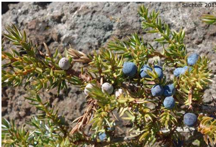
Slika 3. Bobuljasti češeri klečice.

Bobuljasti češeri sadrže 3-6 ljusta, svaka s 1-2 sjemenke. Češeri dozrijevaju druge ili treće godine. Bobuljasti češer je jajast do kuglast (Slika 3), promjera 7-10 mm, plavičastocrne boje (Vidaković 1993). Općenito gledano, važna evolucijska prilagodba ove svojte je specifičan mesnati oblik češera (bobuljasti češer) koji sadrži sjeme koje se širi pticama i malim sisavcima, što je omogućilo brzo koloniziranje novih područja u interglacijalnim razdobljima (Hantemirova i dr. 2017; Knyazeva i Hantemirova 2020).