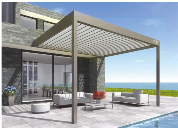
Slika 2. Primjer aluminijske pergole