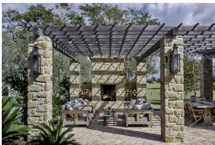
Slika 1. Primjer pergole sa kamenim stupovima

Pergole se mogu podijeliti po njihovoj funkciji te materijalu od kojeg su izrađene. Pergole mogu biti izrađene tako da su neki elementi izrađeni od kamena (slika 1), od aluminijske (slika 2) te mogu biti izrađene od drva (slika 3), čija će proizvodnja biti obrađena u ovome radu. Naravno zbog razvoja tehnologije te sve šire dostupnosti različitih materijala, u konstrukciji pergole se mogu kombinirati razni različiti materijali.