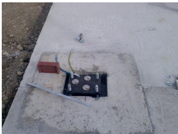
Slika 17. Primjer postavljenih metalnih stopa u betonskom temelju