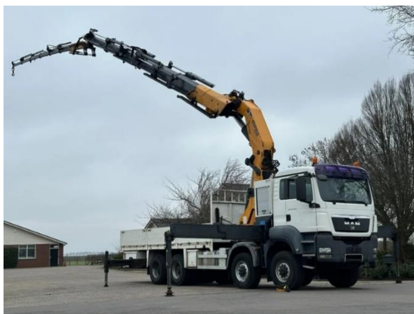
Slika 16. Kamion sa kranom i aktivnim bočnim stabilizatorima Izvor: https://www.truck1.hr/kamioni/kamioni-s-kranom/man-tga-26-440-6x4x4-h-pm-35527-fly-jib-crane-kran-a8204029.html (Pristupljeno 19.9.2024.)

Uspješnost montaže drvene pergole, ovisi još od postavljanja temelja. Temelji mogu biti izvedeni u obliku betonske ploče koja će definirati površinu iznad koje će se postaviti pergola ili mogu biti izvedeni samo kao betonske kocke koje će služiti kao element stabilnosti konstrukcije te kao pozicija na koju će se postavljati stupovi. Proces montaže same pergole kreće sa postavljanjem stupova na metalne stope koji trebaju biti prijevremeno postavljene (slika 17), zatim postavljanja horizontalnih poveznika na koje će okomito zatim učvrstiti krovni povezni elementi. U tablici 7. su navedene preporučene operacije montaže drvene pergole uz pomoć metalnih poveznika koji uvelike olakšavaju i ubrzavaju sami proces montaže te se učvršćivanje konstrukcije može lakše postići kutnim poveznicima koji se mogu vidjeti na slici 18.