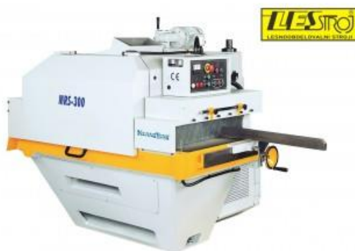
Slika 11. Višelisna kružna pila za uzdužno krojenje Lestroj MRS 300 A