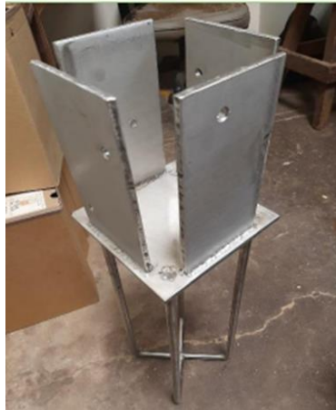
Slika 7. Primjer metalne stope koja se upotrebljava za postavljanje drvenih stupova pergole Izvor: White Glove Complete Assembly Service (foreverredwood.com)(Pristupljeno 19.9.2024.)

U novije vrijeme su se počele koristiti i specijalno pripremljeni vezni elementi koji omogućuju spajanje drvenih elemenata vijcima bez izrade ikakvog veznog spoja (slika 8).