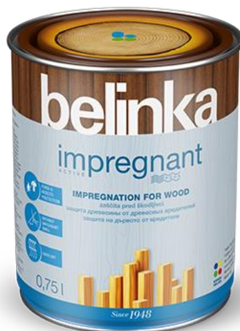
Slika 14. Tankoslojna lazura Belinka Impregnant Active