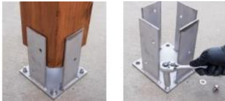
Slika 9. Primjer postavljanja metalne stope te drvenog stupa Izvor: White Glove Complete Assembly Service (foreverredwood.com) (Pristupljeno 19.9.2024.)

izbjeglo zaostajanje i nakupljanje vode na gredama što bi posljedično uzrokovalo povećanje sadržaja vode u drvenim gredama te pojavu optimalnih uvjeta za razvoj gljiva.