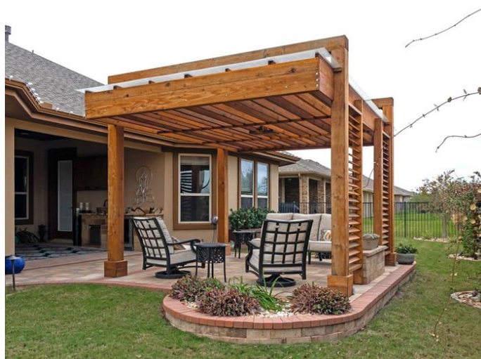
Slika 5. Pergola sa niskom do srednjom zaštitom od atmosferskih utjecaja