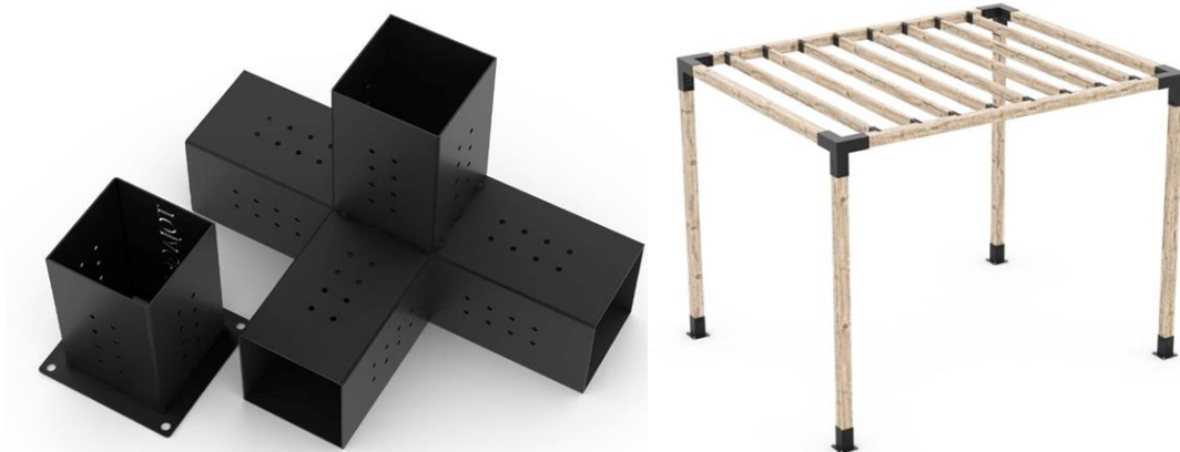
Slika 8. Primjer metalnih veznih elemenata proizvođača Toja Grid (lijevo) te primjer njihove primjene (desno) Izvor: https://tojagrid.com/collections/brackets-6-x-6 ; https://tojagrid.com/collections/single-pergola-kits (Pristupljeno 19.9.2024)