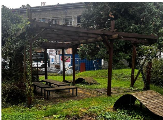
Slika 3. Primjer drvene pergole na Fakultetu šumarstva i drvne tehnologije