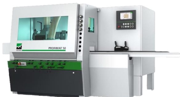
Slika 12. Četverostrana blanjalica Weinig Profimat 50

Nakon uzdužnog piljenja, izrađeni elementi dolaze na obradu na četverostranoj blanjalici gdje elementi dobivaju jednak poprečni presjek po dužini te se iz elemenata uklanja odstojanje od centralne osi, odnosno bilo kakva vrsta savijenosti elemenata. Nakon obrade na četverostranoj blanjalici svi elementi imaju sve četiri površine paralelne ili okomite međusobno. Obrada na četverostranoj blanjalici osigurava bazne površine koje pri daljnim procesima proizvodnje smanjuju mogućnost pojave grešaka zbog netočnosti pozicije na stroju. U svrhu proizvodnje drvenih pergola te tehničkim zahtjevima koje ona nosi, četverostrana blanjalica koja bi bila optimalna za korištenje je Weinig Profimat 50 (slika 12). Ta četverostrana blanjalica donosi mogućnost obrade elemenata maksimalne visine od 160 mm te širine 230 mm, a posmična brzina se može regulirati u rasponima od 5 do 30 m/min. Ovakve tehničke specifikacije su zadovoljavajuće za proizvodnju drvenih pergola zato što mogu obrađivati elemente koji su dimenzija potrebnih za kvalitetnu izvedbu konstrukcije pergole.