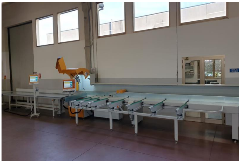
Slika 13. Protočna kružna pila za poprečno rezanje Salvador SuperPush 250

Nakon što elementi prođu obradu na četverostranoj blanjalici te dobiju bazne površine koje omogućuju točnost pri daljnoj obradi, slijedeći proces obrade je poprečno krojenje, odnosno krojenje na dužinu. Kako bi taj proces bio što efikasniji, preporuča se korištenje protočne kružne pile. Takve kružne pile u današnje vrijeme, uz pomoć umjetne inteligencije, imaju mogućnost prepoznavanja grešaka te njihovog uklanjanja iz elemenata. Prednost takvih kružnih pila je smanjenje grešaka koje bi se mogle naći u finalnom proizvodu drvene pergole te štetići čvrstoći tih elemenata ili samoj konstrukciji. Obrada na tehnološki naprednijim protočnim kružnim pilama daje i mogućnost zadavanja ukupnog popisa potrebnih elemenata sa njihovim dimenzijama te onda stroj softverski riješava redoslijed rezanja po dužini ovisno o dimenzijama elementa koji se nalazi na prihvatnom stolu. Protočna kružna pila koja bi ispunila dimenzijske zahtjeve pri proizvodnji elemenata za drvene pergole je Salvador SuperPush 250 (slika 13). Ovaj stroj ima maksimalni kapacitet rezanja elementa dimenzija poprečnog presjeka 270x120 mm ili 300x95 mm što zadovoljava potrebne dimenzije poprečnog presjeka elemenata koji se koriste za proizvodnju drvenih pergola.