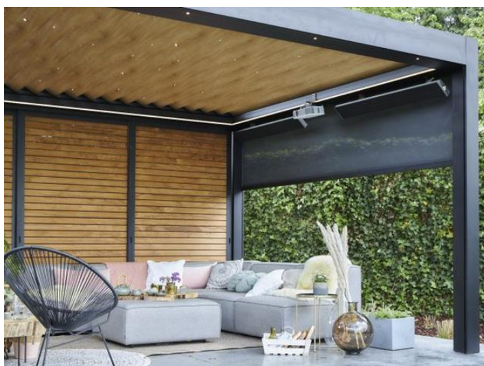
Slika 6. Pergola sa srednjom zaštitom od atmosferskih utjecaja