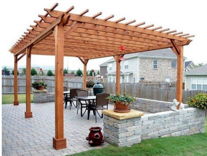
Slika 4. Pergola sa nikakvom zaštitom od atmosferskih utjecaja

vjetra i sunčeve svjetlosti, naravno svaka takva pergola se uz dodavanje jednostavnih konstrukcijskih detalja može svrstati pod pergolu s funkcijom srednje zaštite od vjetra i sunčeve svjetlosti. Kako bi se pergola mogla smatrati takvom bilo bi potrebno svrstati stropne letve u konstrukcijske elemente koje bi određeni dio dana štatile od Sunčeve svjetlosti te ugraditi neku vrstu bočnih panela koji bi djelomično štitali od vjetra. Zaključno bi se pergole po funkciji mogle podijeliti po razini zaštite od atmosferskih utjecaja (sunčeva svjetlost, vjetar, oborine). Tako bi predložio podjelu pergola po funkciji na; pergole s nikakvom zaštitom od atmosferskih utjecaja (slika 4), pergole s niskom do srednjom zaštitom od atmosferskih utjecaja (slika 5) te na pergole s srednjom zaštitom od atmosferskih utjecaja (slika 6). Razlog što nisam pridodao podjeli pergola po funkciji stavku pergola sa visokom zaštitom od atmosferskih utjecaja je to što se takva konstrukcija više ne bih mogla nazivati pergolom te bih se svrstavala pod sjenicu, paviljon ili zimski vrt, što je naravno ovisno o izvedbi konstrukcije.