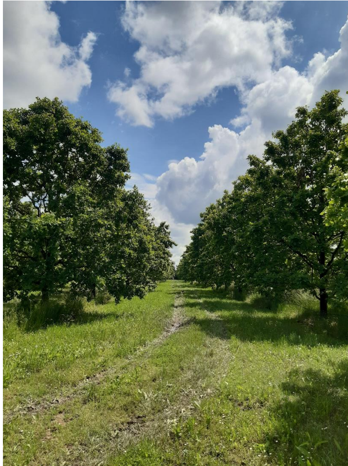
Slika 4. Klonska sjemenska plantaža „Novoselci“

Plantaža se nalazi na 135 m nadmorske visine. Geografski je plantaža smještena na težištu od 17° 46' 59" istočne geografske dužine, računajući od Greenwicha i na 45° 19' 59" sjeverne geografske širine.