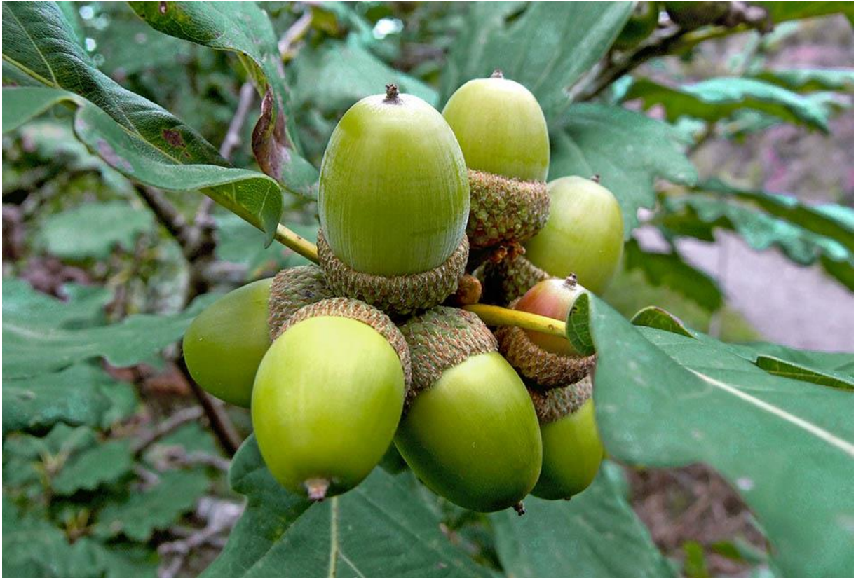
Slika 1. Quercus petraea (Matt.) Liebl.) – žir.