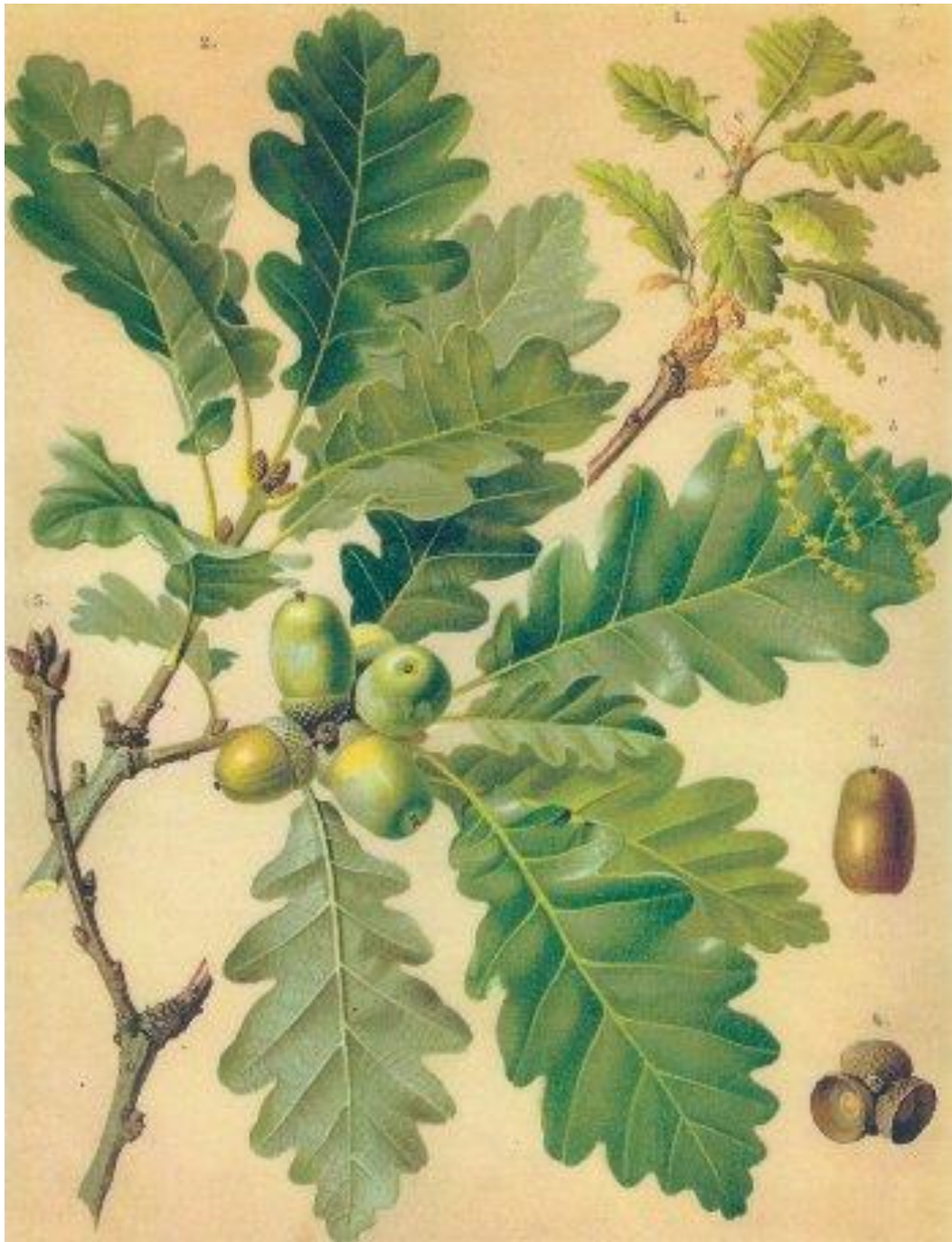
Slika 3. Quercus petraea (Matt.) Liebl.), (Hempel i Wilhelm 1889).