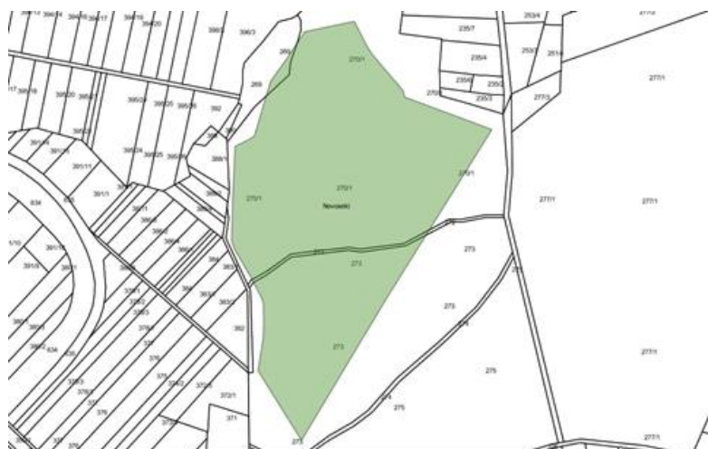
Slika 5. Katastarski plan sa izdvojenim k.č. za KSP „Novoselci“

Plantaža se nalazi na 135 m nadmorske visine. Geografski je plantaža smještena na težištu od 17° 46' 59" istočne geografske dužine, računajući od Greenwicha i na 45° 19' 59" sjeverne geografske širine.