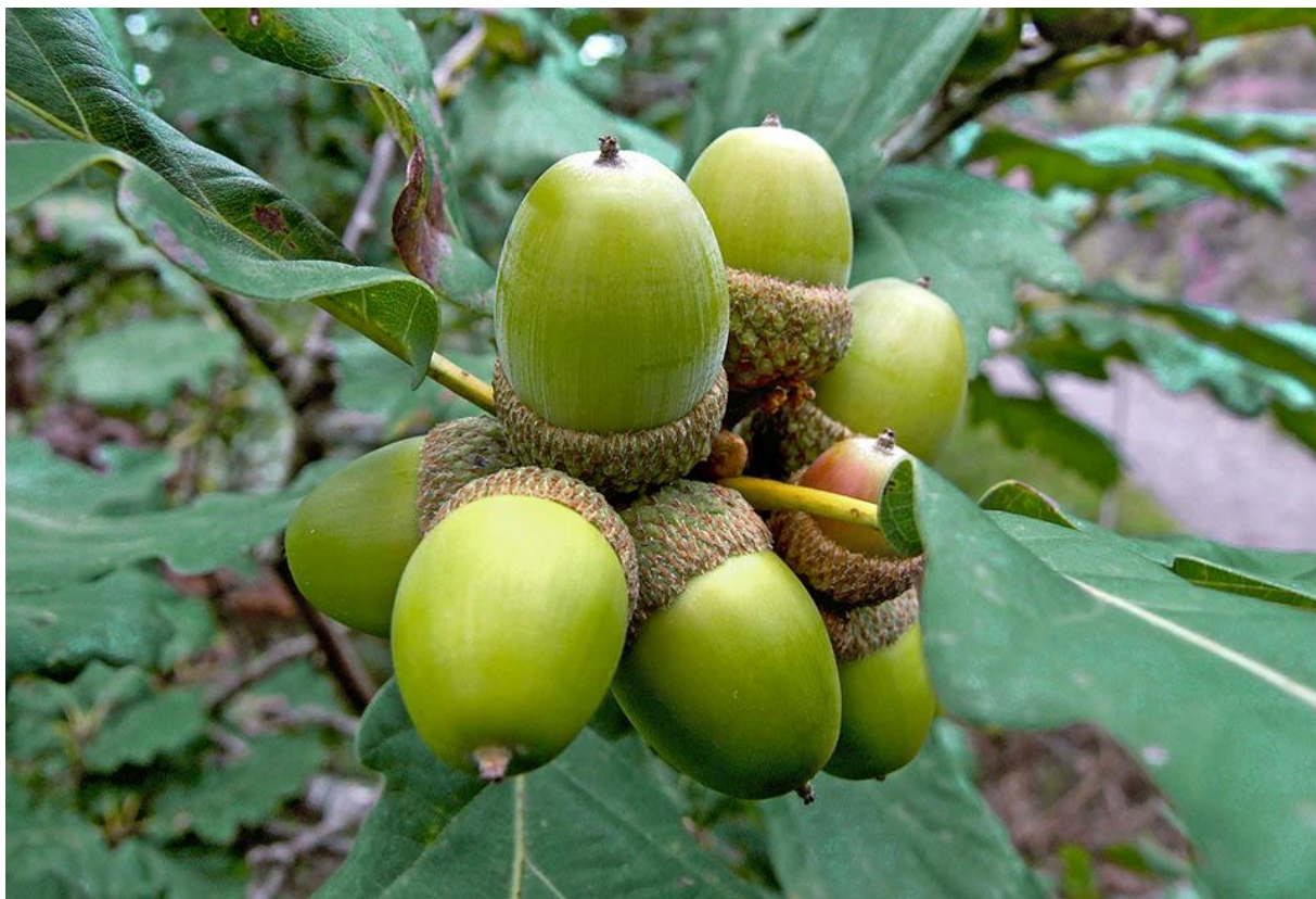
Slika 1. Quercus petraea (Matt.) Liebl.) – žir.