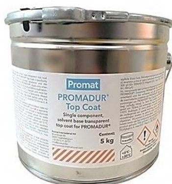
Slika 12. Promadur Top Coat – završni premaz.

jednostavno nanošenje i brzo sušenje pridonose uporabi ovog premaza. Njegova primjena ne šteti vatrootpornim svojstvima temeljnih premaza te se kao takav lako primjenjuje (sl. 12).