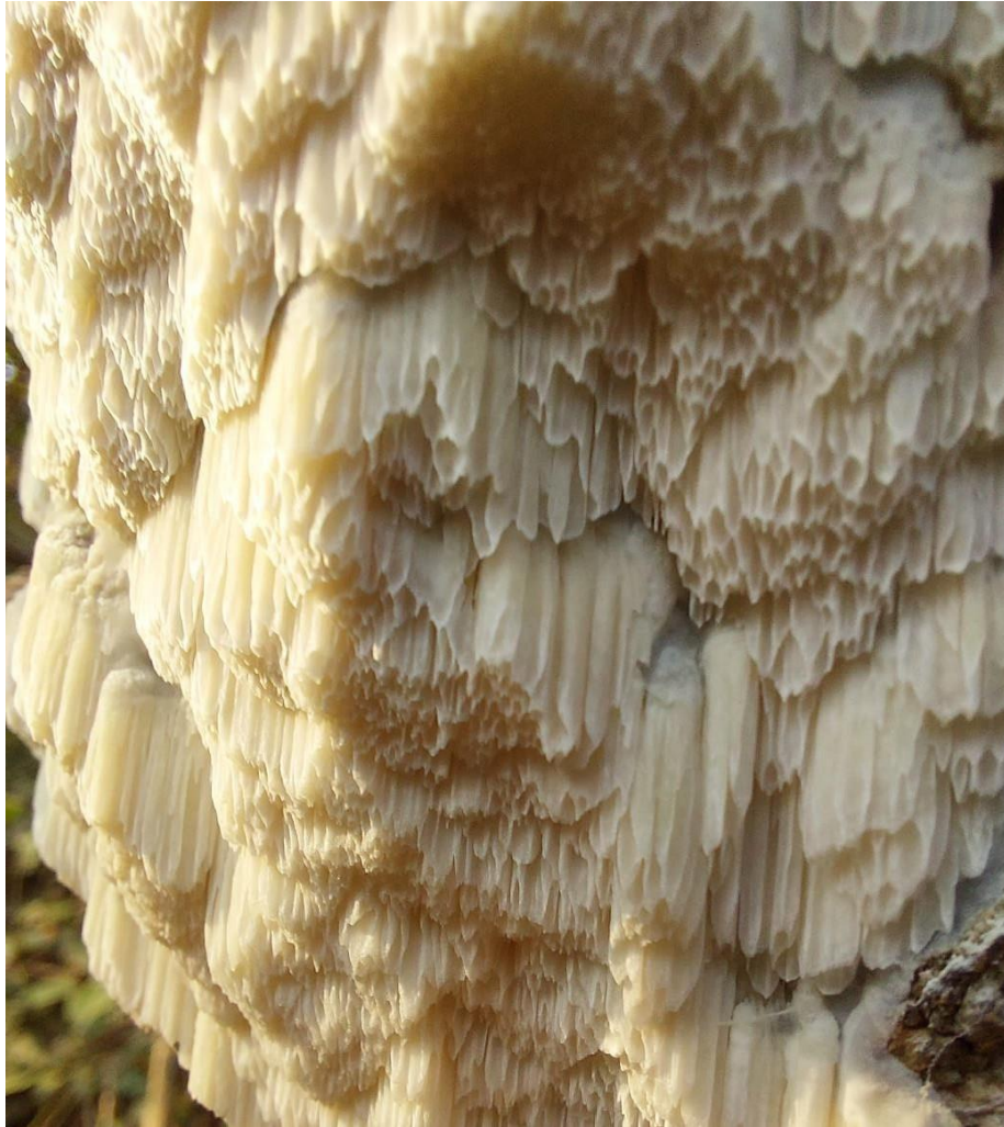
Slika 29. Schizopora paradoxa na vertikalnom supstratu, GJ Trstenik, 2. prosinca 2022.

Na živom poljskom jasenu uočena je u 32 navrata. Njezina učestalost i raširenost po jasenovim sastojinama sugeriraju kako je jedan od važnih čimbenika u njegovom odumiranju. Iako ponekad dolazi uz prisutstvo drugih vrsta, na mnogim stablima evidentirana je kao jedina truležnica (barem što se tiče razvijenih plodišta) i sva su takva stabla izuzetno lošeg zdravstvenog stanja, što znači da je često možda ključni faktor kod sušenja. Agresivno obraštanje cijelog opsega debla znak je kako se micelij u inficiranom deblu širi vrlo brzo te razara provodne elemente pridanka debla, onemogućuje cirkulaciju vode i hranjivih tvari, što u konačnici dovodi do njegovog sušenja. Nakon toga, nastavlja s razgradnjom odumrlog stabla kao saprotrof. Sva stabla inficirana ovom vrstom pokazuju slab vitalitet, pogotovo ona mlađa. Takvim stablima ponekad bude u potpunosti obrašten pridanak ili deblo i to cijelim svojim opsegom, ponekad od razine tla pa do više od metar u visinu (Slika 30.)