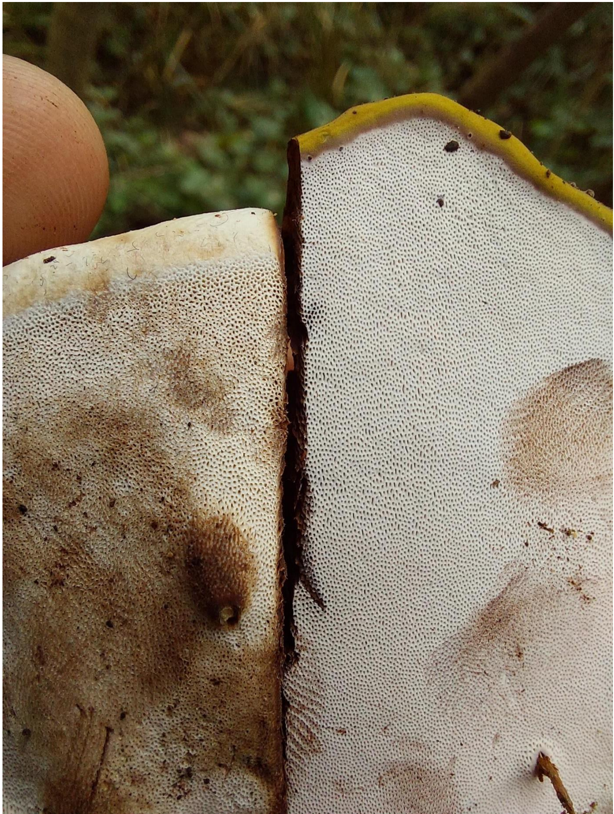
Slika 13. Lijevo Ganoderma cf. applanatum , desno Ganoderma cf. adpersum . Ključna morfološka razlika između ove dvije svojte jesu bijeli odnosno žuti rub karpofora, GJ Trstenik, 11. listopada 2023.