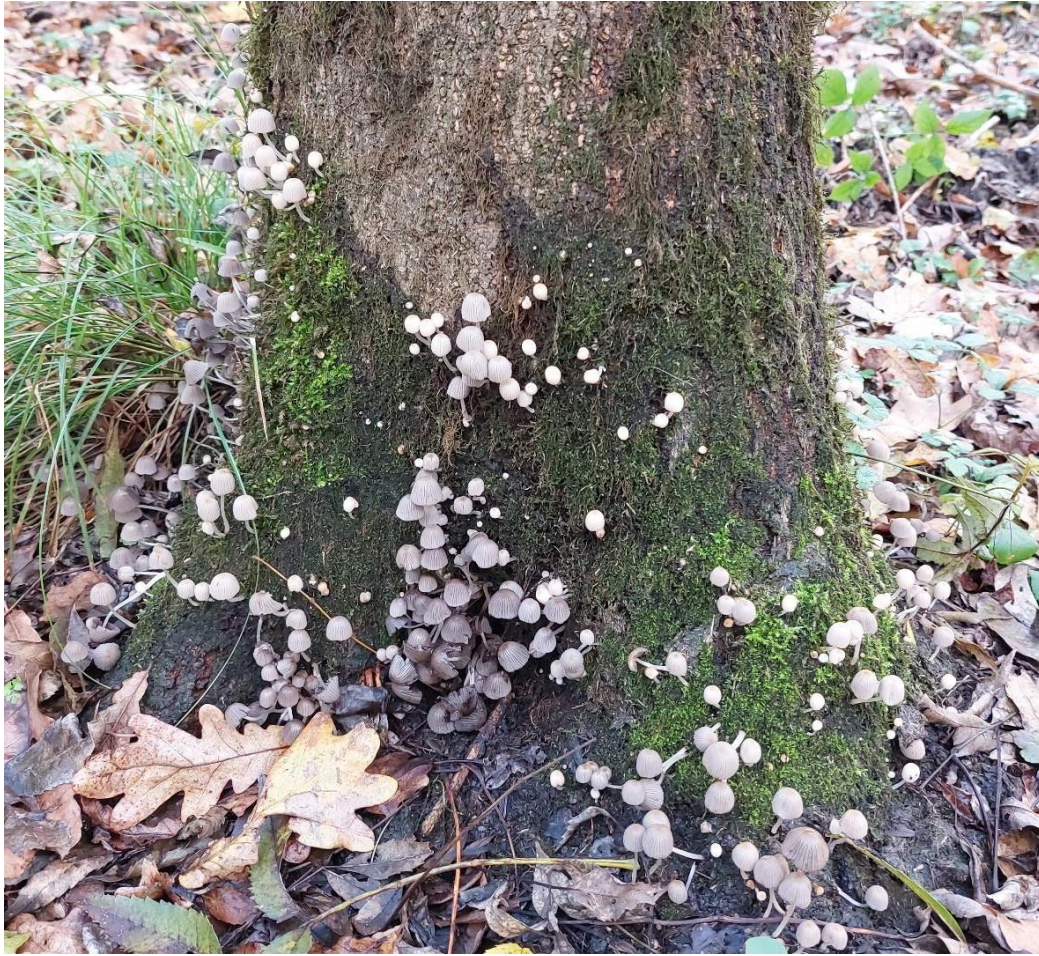
Slika 8. Coprinellus disseminatus na živom stablu poljskog jasena, GJ Međustrugovi, 26. listopada 2023.