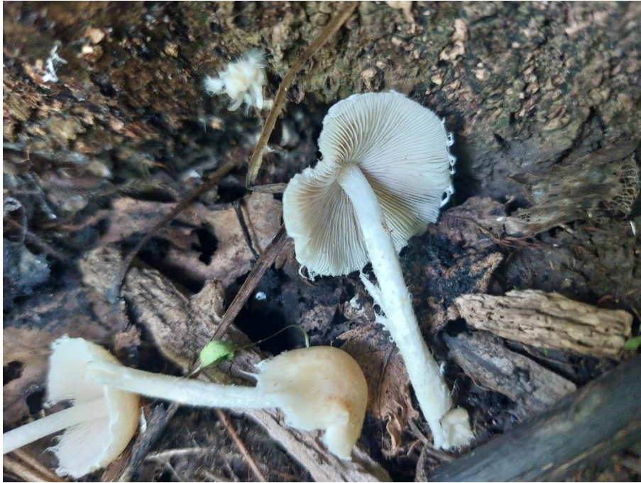
Slika 6. Candolleomyces candolleanus kod pridanka poljskog jasena. GJ Međustrugovi, 17. listopada 2023.

Ova je, relativno česta vrsta, u samo jednom slučaju pronađena asocirana uz živi jasen, 17. listopada 2023. u odsjeku 15a, gospodarske jedinice Međustrugovi u šumariji Stara Gradiška. Obično obrašta panjeve ili raste prividno iz tla razlažući odumrlo korijenje različitih listopadnih vrsta. Tvrdnja da doprinosi odumiranju poljskog jasena nema nikakvih osnova, jer i u slučaju kada se nađe na živoj biljci ona nastanjuje već odumirući dio tkiva. Svojom prisutnošću može ubrzati propadanje takvog tkiva te potencijalno pridonjeti izvaljivanju stabala koja su na granici odumiranja ili su već odumrla.