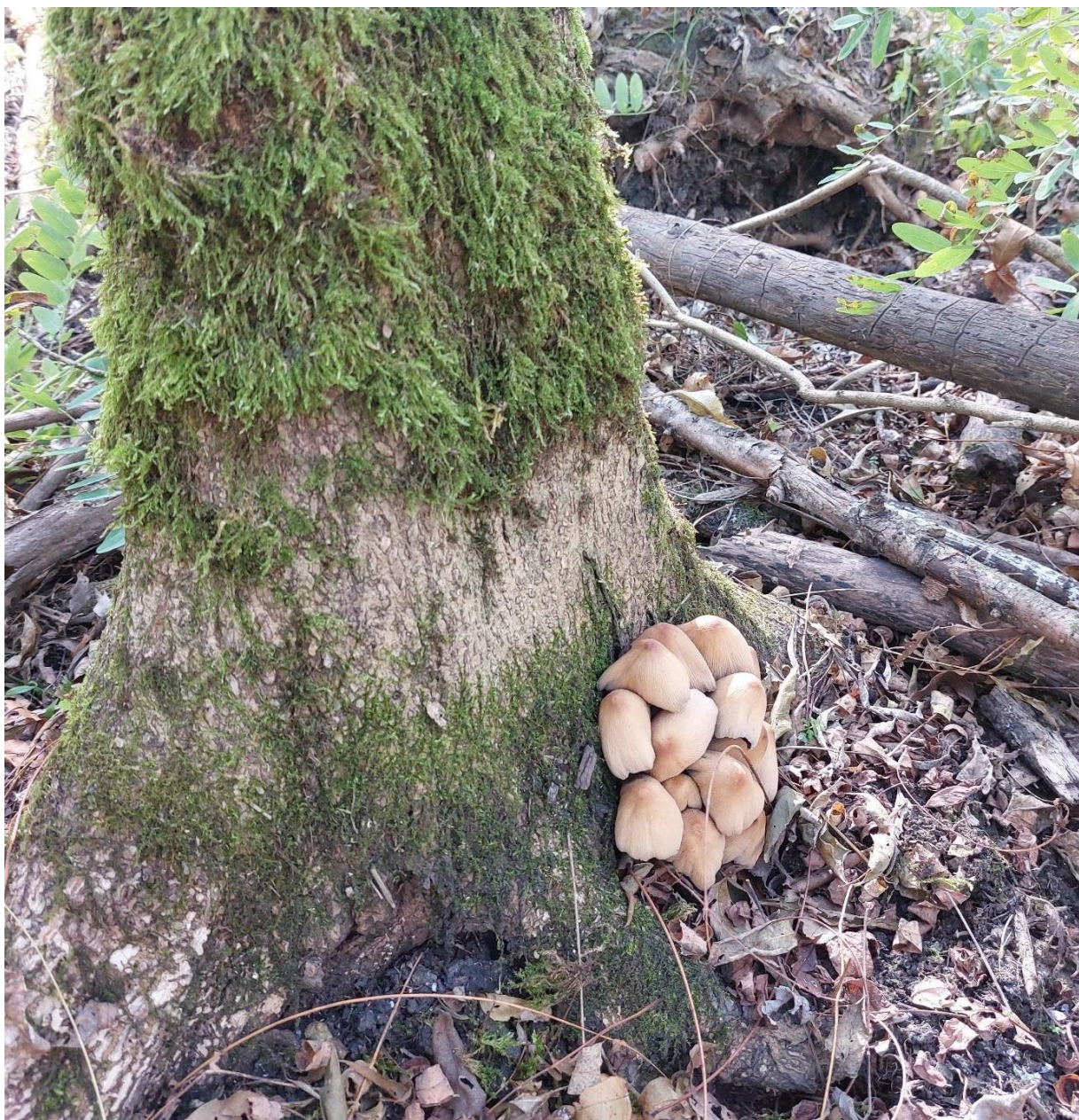
Slika 10. Coprinellus micaceus na pridanku poljskog jasena, GJ Radinje, 12. listopada 2023.

Kako je za plodišta koja okružuju debla teško definitivno odrediti jesu li nastanila već odumrli korijenov sustav ili je gljiva inficirala još živo stablo, u statistiku su uračunata samo ona plodišta koja su rasla na pridanku debla ili vratu korijena te je zarezivanjem noža ustanovljeno da raste iz još biološki aktivnog kambijalnog sloja. Samo je takvih slučajeva, gdje možemo biti sigurni u parazitizam ove vrste, bilo 28, što je dovodi i takvim minimalističkim i suzdržanim pogledom među najčešće zabilježene vrste ovog istraživanja. Njezina je uloga u odumiranju jasena, posve je sigurno, prilično velika. Plodišta koja su raštrkana čitavim površinama sastojina ukazuju da je micelij raširen praktički svugdje gdje ima i korijenja. Razgrađivanjem korijena može negativno utjecati na statiku, a pošto je nalazimo i na deblu i sama strukturna čvrstoća stabla dovodi se u pitanje. Plodišta koja izbijaju iz još živih stabala ukazuju i na njezinu parazitsku ulogu, kojom negativno utječe i na vitalitet stabla, kojeg posredno nastanjuju i druge vrste sličnih ekoloških potreba.