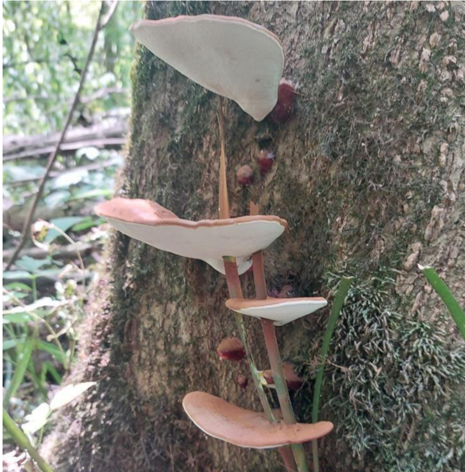
Slika 17. Plodišta G. resinaceum koja izbijaju blizu vrata korijena često imaju stručak, no on je u pravilu mnogo kraći i polegnutiji nego kod vrste G. lucidum , GJ Međustrugovi, šumarija Stara Gradiška, 17. srpnja 2023.