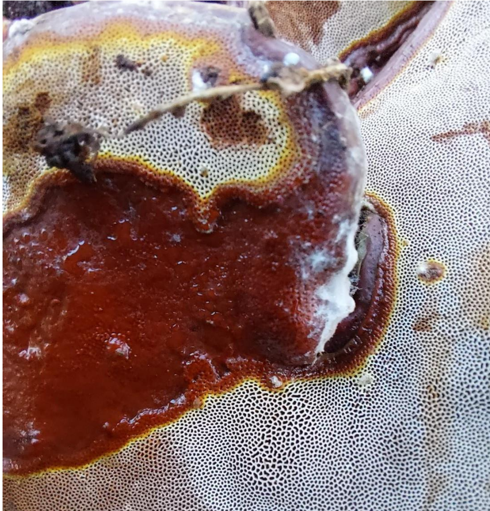
Slika 16. Ganoderma resinaceum , smeđa površina pokazuje karakterističnu poršinu nastalu nakon ozljede i stvrdnjavanja smole, 25. studenoga 2022., GJ Radinje, šumarija Nova Kapela

Ova je gljiva, kao što je slučaj i s G. adspersum i G. applanatum , pronalazena na stablima svih stupnjeva osutosti krošnje, bez obzira na njihovu starost ili lokaciju. Njezina još veća brojnost pokazuje kako je možda i agresivniji patogen od prethodne dvije, koji se brže širi našim jasicima. Simptomi truleži izgledaju jednako, potpuna nekroza i trulež korijena i pridanka nakon čega slijedi izvaljivanje stabla. Također je prisutna na novoizvaljenim stablima, što se pokazalo i dan nakon oluje 19. lipnja 2023. koja je prouzročila masovna izvaljivanja u GJ Lonja. Doslovno svako izvaljeno stablo koje je pregledano imalo je na sebi plodišta ove gljive, što upućuje kako je upravo ova vrsta najznačajni čimbenik kod vjetroizvale poljskog jasena. Naravno da je nemoguće utvrditi koje su sve vrste prisutne u svakom odumrlom poljskom jasenu, ali ovaj podatak ide u prilog tvrdnji kako trulež koju uzrokuje upravo ova vrsta drastično smanjuje vrijeme preživljavanja biljke. Napomenimo, iako su mnoga izvaljena stabla imala još uvijek zelenu krošnju i bila su evidentno živa dan ranije, nisu evidentirana u statistiku koja prikazuje broj pronađenih gljiva tijekom ovog istraživanja.