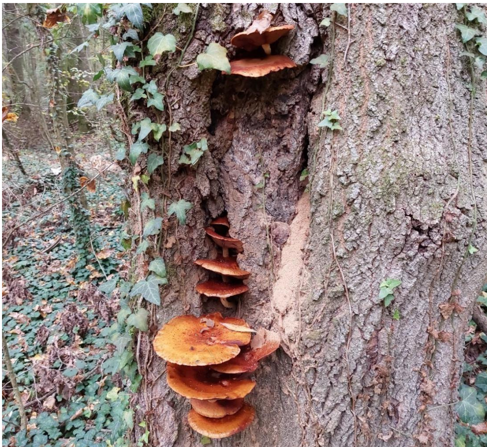
Slika 24. Pholiota aurivella na oštećenom starom stablu poljskog jasena, GJ Trstenik, 2. prosinca 2022.

Pholiota aurivella truležnica je prilično velikih dimenzija, klobuk doseže do 16 cm promjera, a stručak je dugačak do 8 cm. Raste busenasto na odumrlim stablima, panjevima ili parazitira stabla s mehaničkim oštećenjima ( Slika 24. ). Slična je vrsti Pholiota adiposa , koja ipak naraste manjih dimenzija i svjetlije je boje u starosti. (Božac, 2005).