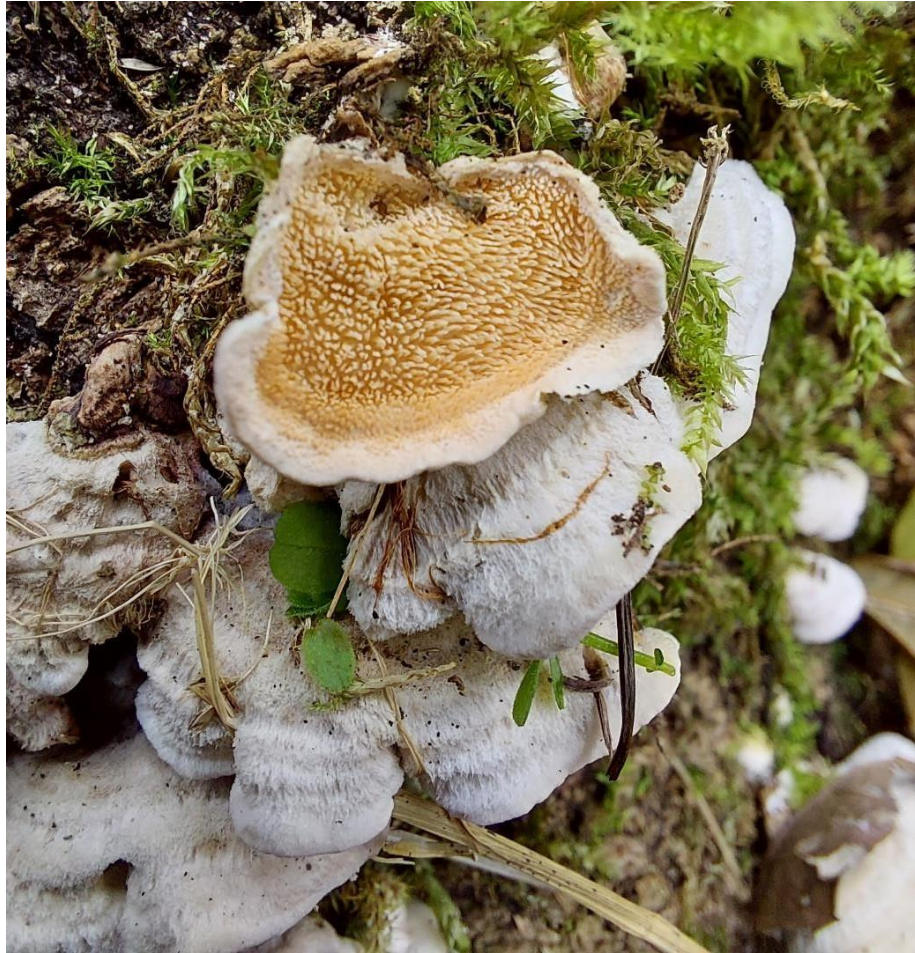
Slika 21. Pallidohirschioporus biformis na jasenu, GJ Kutinske nizinske šume, 28. listopada 2022.

Prilično je česta vrsta na poljskom jasenu, a najčešće nastanjuje otpale biljne organe i sušce. Ipak, u 5 slučajeva nalazimo je i na živim stablima, što ukazuje da ponekad i parazitira na jasenu. Obično je nalazimo oko prsne visine pa vjerojatno nema jači utjecaj kod truljenja pridanka i korijena što dovodi do izvaljivanja, ali zasigurno ima negativan utjecaj na aktivnost kambija što rezultira padom vitaliteta i sušenja gornjih dijelova stabla.