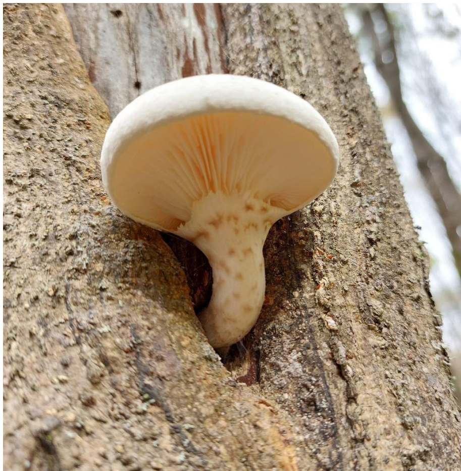
Slika 26. Pleurotus dryinus na poljskom jasenu, GJ Radinje, 25. studenoga 2022.

Pleurotus dryinus nije česta vrsta, a javlja kao parazit na listopadnom drveću. Srodnik je dobro poznate i cijenjene bukovače ( Pleurotus ostreatus ). Od spomenute se razlikuje što ne raste busenasto, bijele je boje, tvrde i žilave teksture te u mladosti himenij štiti zastorak ( velum partiale ). Klobuk može narasti do širine od 20 cm ( Slika 26. ) (Božac, 2008).