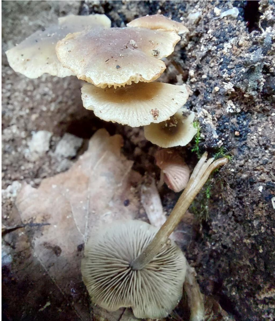
Slika 31. Simocybe centunculus u šupljini na pridanku živog jasena, GJ Lonja, 27. listopada 2023.

Ova je vrsta pronađena u sklopu istraživanja samo jednom, na zadnjem terenskom obilasku u odsjeku 53d gospodarske jedinice Lonja, šumarije Sunja. Riječ je o sastojini mlađeg postanka, starosti oko 30 godina. Njezin pridolazak vezan je uz šupljinu na deblu i najvjerojatnije je tamo pridošla tek nakon njezinog nastanka. Pretpostavka je da nema veću ulogu u sušenju jasena.