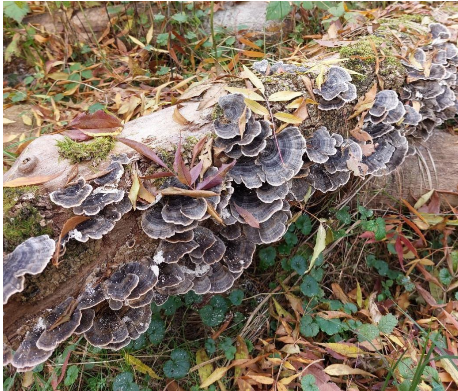
Slika 32. Trametes versicolor na povaljenom stablu jasena, GJ Kutinske nizinske šume, 28. listopada 2022.

Česta je vrsta u jasenovim sastojinama, ali pridolazi na panjevima, povaljenim deblima i debljim otpalim granama. U jednom slučaju pronađena je na starom poljskom jasenu, no rasla je kod ožiljka osušenog dijela rašlje pa nije moguće utvrditi je li sama uzrok te truleži ili ju je kolonizirala naknadno. U odumiranju jasena zasigurno nema veću ulogu, ali kao važna i raširena saprotrofska vrsta doprinosi razgradnji mrtve drvene tvari u takvim sastojinama.