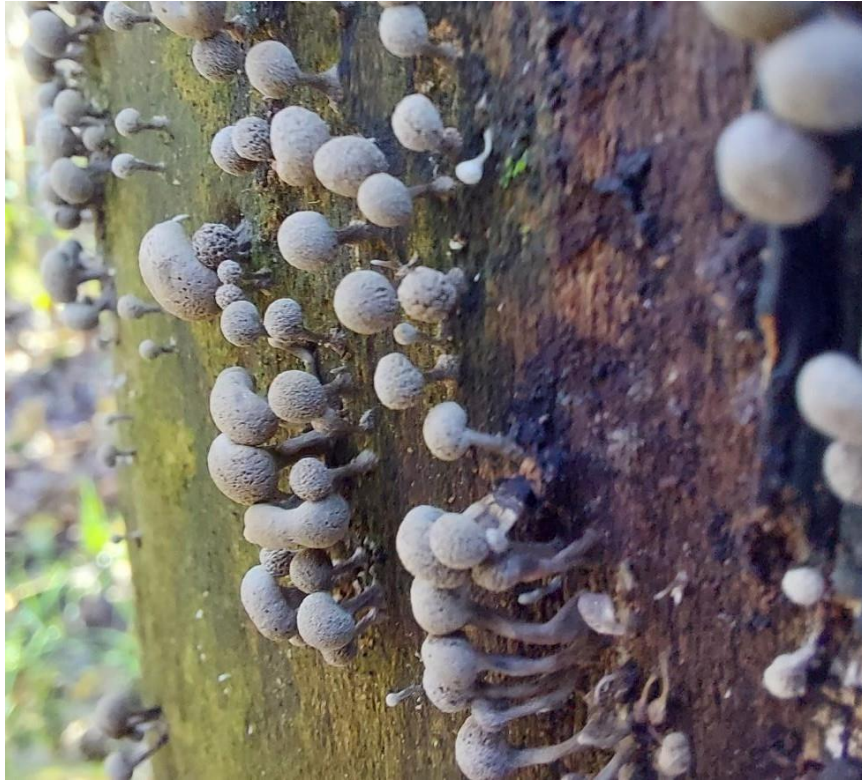
Slika 22. Phleogena faginea na mrtvom stablu jasena, GJ Radinje, 25. studenoga 2022.