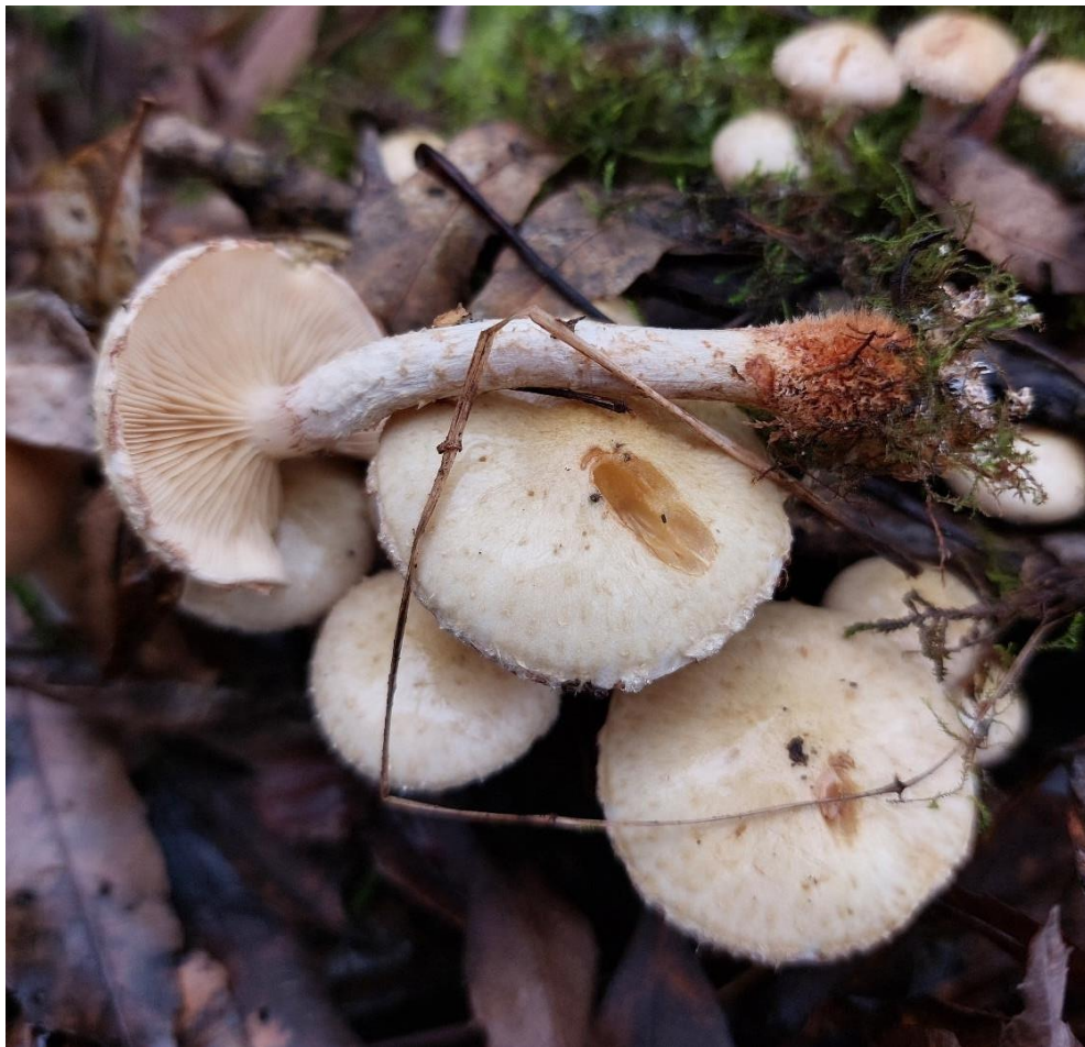
Slika 25. Pholiota lenta na vratu korijena poljskog jasena, GJ Kutinske nizinske šume, 28. listopada 2022.

Pholiota lenta najčešće se nalazi na otpalim biljnim ostacima kao saprotrof. Stručak je visine do 8 cm, na osnovi je zadebljan i smeđe boje, a klobuk promjera do 7 cm. I klobuk i stručak su prekriveni suhim česticama, što olakšava njezinu determinaciju ( Slika 25. ) (Božac, 2005).