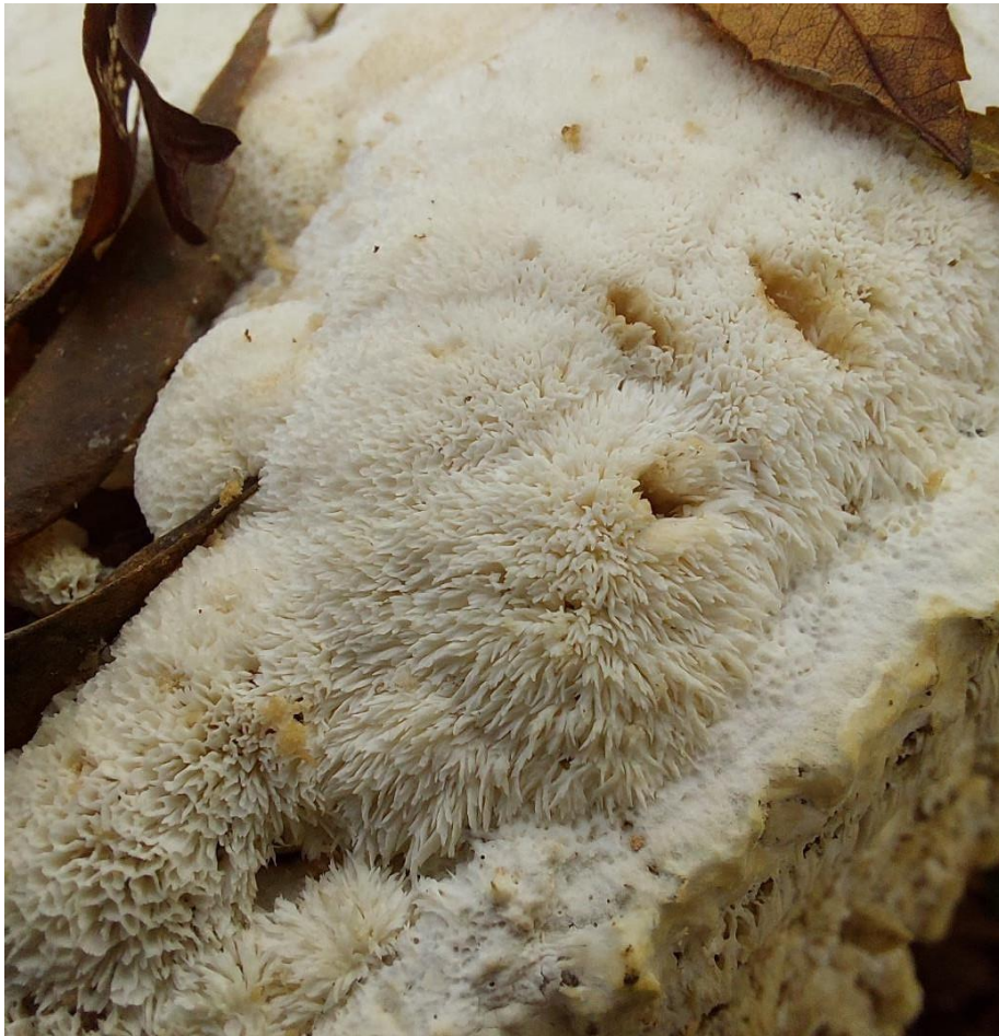
Slika 28. Schizopora paradoxa na horizontalnom supstratu, GJ Radinje, 25. studenoga 2022.

razvija bijelu trulež (Božac, 2008). Morfološki izgled plodišta koje raste negativno geotropno (suprotno smjeru privlačenja sile teže) prikazuje Slika 29 .