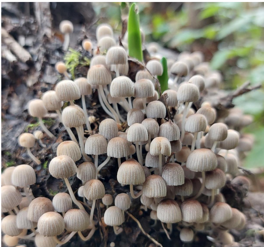
Slika 7. Plodišta vrste Coprinellus disseminatus obraštaju panj izvaljenog jasena. Na slici je vidljiva i proklijala lukovica vrste Leucojum aestivum , svojstvene vrste asocijacije Leucojo-Fraxinetum , GJ Međustrugovi, 26. listopada 2023.

Osim što se najčešće nalazi u ulozi razlagača već mrtvih dijelova biljke, povremeno je možemo naći i uz pridanak živih stabala. Zanimljivo je kako je ta situacija bila najčešća na sastojinama mlađeg uzrasta, kao što je odsjek 15a u GJ Međustrugovi šumarije Stara Gradiška i odsjek 53a u GJ Lonja, šumarije Sunja. Spomenute sastojine su starosti 30-ak godina, ali je sušenje prilično uznapređovalo, gdje je Coprinellus disseminatus jedna od najčešćih vrsta na odumrlim stablima, ali s obzirom da su poneka plodišta obrastala pridanke živog jasena, vjerojatno ima i stanovitu ulogu u njegovom odumiranju ili mu barem pripomaže ( Slika 8. ).