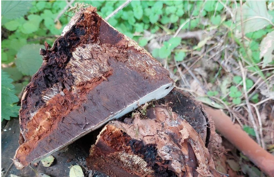
Slika 14. Ganoderma cf. applanatum , temeljeno na sloju sterilnog tkiva između dva sloja cjevčica, GJ Trstenik, šumarija Strizivojna, 28. listopada 2022.

Jedan od problema kod determinacije je i činjenica da su gotovo sva plodišta pronađena na živim stablima bila jednogodišnja, jer na presjeku ni jednog karpofora nije pronađeno više slojeva cjevčica. To vrijedi i za izvaljena stabla, što ukazuje na još jedan zaključak, a to je da je razdoblje od infekcije do izvaljivanja stabla vrlo kratko, jer plodište gljive nema ni vremena preživjeti jednu zimu prije nego što se biljka izvali. Iznimka je nekoliko izvaljenih debala starih jasenova u šumariji Strizivojna, na temelju čijih presjeka prikazanima na Slici 14. i Slici 15. možemo ustanoviti kako su obje vrste prisutne u ekosustavu.