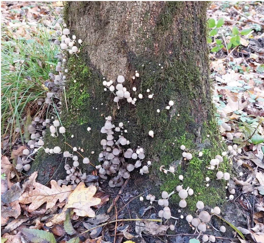
Slika 8. Coprinellus disseminatus na živom stablu poljskog jasena, GJ Međustrugovi, 26. listopada 2023.