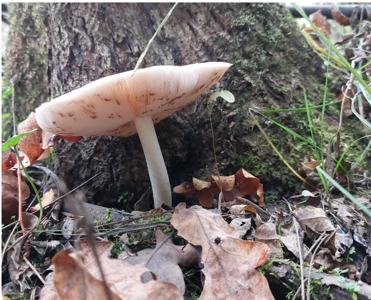
Slika 27. Pluteus cf. petasatus na pridanku poljskog jasena, GJ Međustrugovi, 26. listopada 2023.

Ova vrsta zabilježena je na samo jednom živom stablu, naoko dobrog vitaliteta. Njegova parazitska uloga nije u potpunosti jasna, ali vjerojatno sekundarno napada već oštećena stabla. Stablo na Slici 27 doista i ima zaraslo oštećenje na pridanku, koje je moguće rezultiralo pridolaskom i ove vrste. Zasiurno nema značajnu ulogu u jasenovom odumiranju.