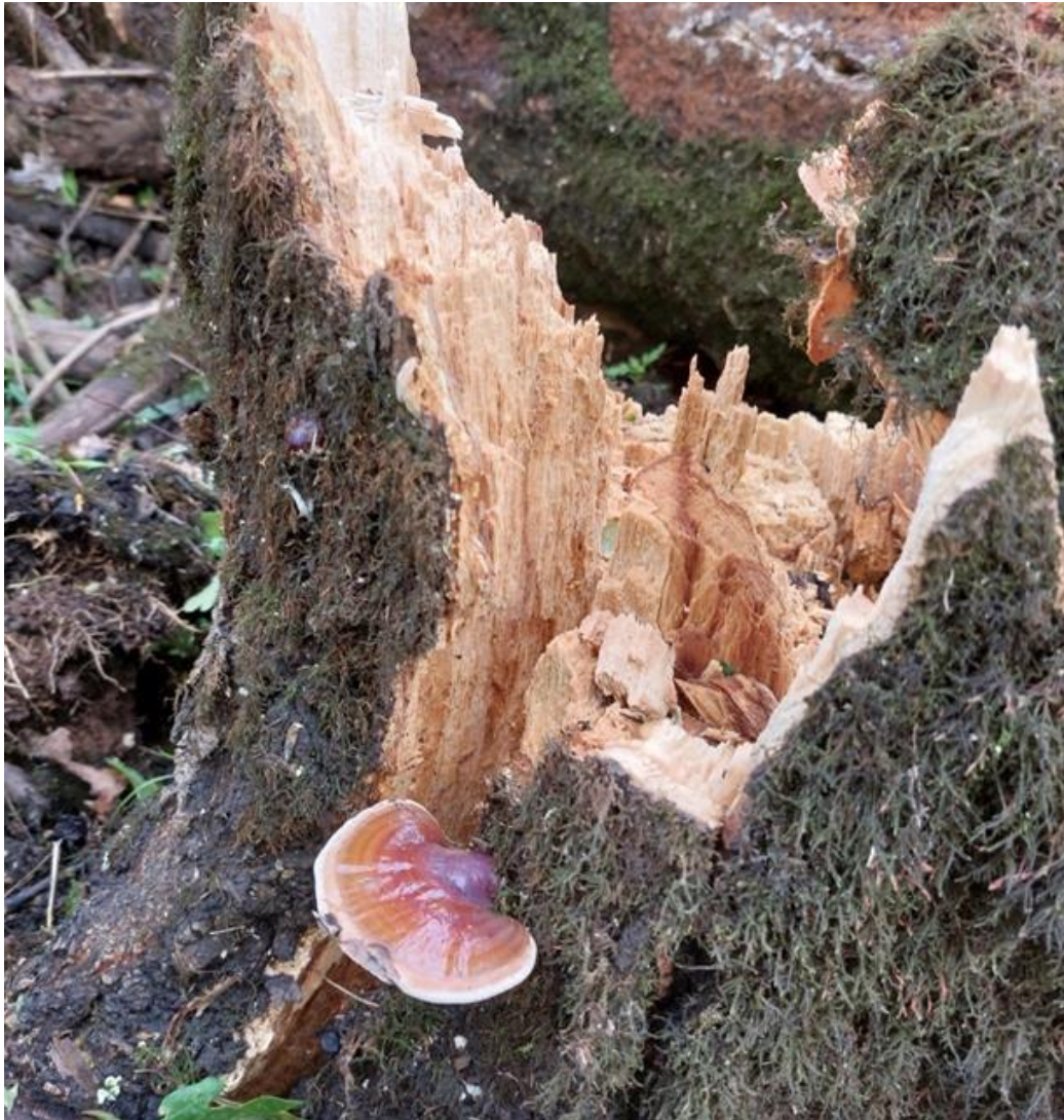
Slika 37. Bijela trulež uzrokovana gljivom Ganoderma resinaceum . Stablo se uslijed naleta jačeg vjetra jednostavno prelomilo, GJ Lonja, 20. srpnja 2023.

zabilježena vrsta u ovom istraživanju te nedvojbeno utječe na izvaljivanje stabala. Osim spomenute, još jedna lokacija koja je pretrpjela ozbiljne štete jest odsjek 10a u gospodarskoj jedinici Trstenik, šumarije Strizivojna, koja je također starija sastojina. U to se uvjeravamo po izlasku na teren 11. listopada iste godine.