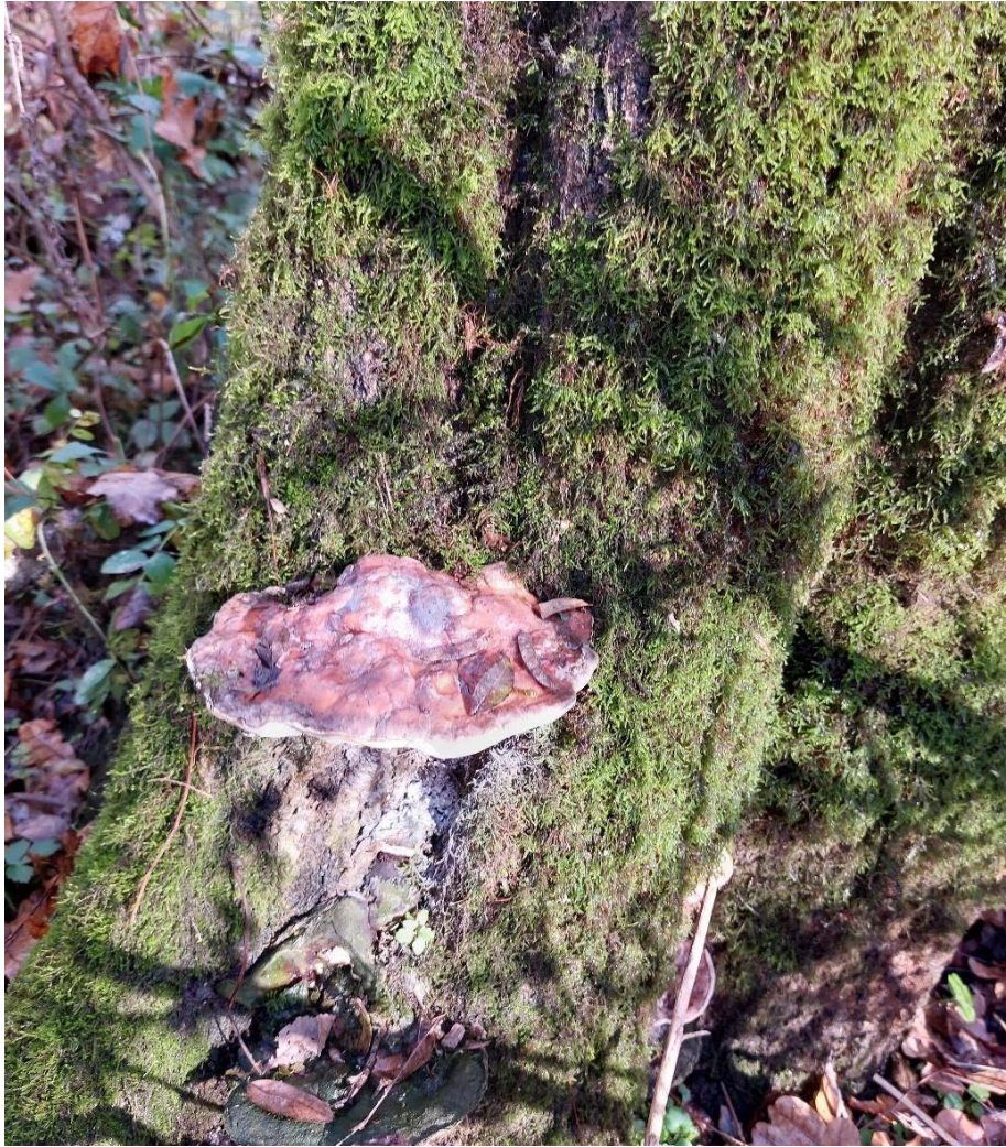
Slika 33. Vanderbylia fraxinea na poljskom jasenu, s prepoznatljivom bijelom otrusinom, GJ Lonja, 27. listopada 2023.

Poznavajući ekologiju ove vrste i podatak da je poznati parazit na jasenu, činjenica da u prvoj godini istraživanja izostaje ijedan nalaz pomalo je iznenađujuća. Prvi pronalazak od ukupno 6 evidentiran je 20. srpnja 2023. godine, a sva pronađena plodišta bila su mlada. To ukazuje na periodičnost plodonošenja ove vrste. Također, sva su plodišta evidentirana na zrelim stablima odnosno starijim sastojinama. Pretpostavka je, unatoč nešto manjem broju nalaza od očekivanih, ali uzevši u obzir njezinu otprije poznatu patogenost, kako je jedna od vrsta koje značajnije pridonose propadanju poljskoga jasena.