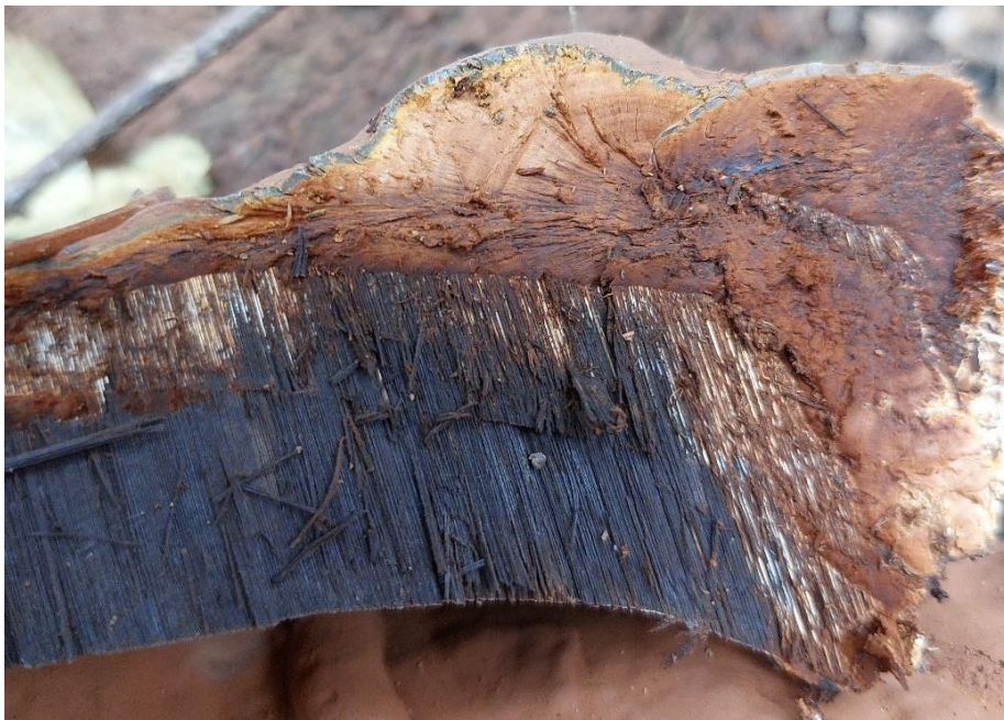
Slika 15. Ganoderma cf. adpersum , temeljeno na izostanku sloja sterilnog tkiva između dva sloja cjevčica, GJ Trstenik, šumarija Strizivojna, 28. listopada 2022.