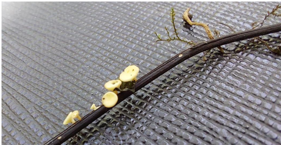
Slika 2. Apoteciji gljive Hymenoscyphus fraxineus na otpaljoj lisnoj peteljci, GJ Međustrugovi, Stara Gradiška, 17.7.2023.