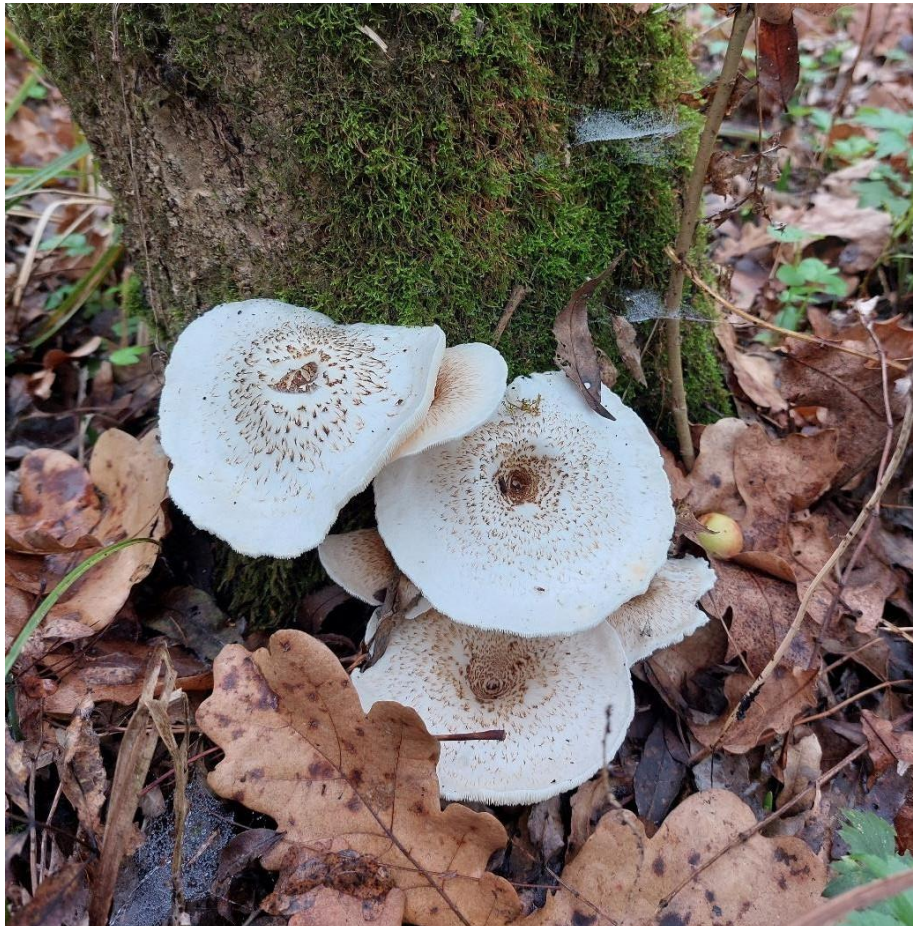
Slika 19. Lentinus tigrinus na pridanku jasena, GJ Kutinske nizinske šume, 28. listopada 2022.

Lentinus tigrinus truležnica je tipična u nizinskim staništima, gdje obrasta najčešće povaljene vrbe i topole, a javlja se cijele godine za vlažnijeg vremena. Raste busenasto, gdje nekoliko stučaka izbija iz zajedničkog primordija. Tvori klobuk koji može biti širine do 10 cm, himenij je u obliku listića bijele boje kao i ostatak gljive, a lako se prepoznaje po tamnim čehicama koje prekrivaju klobuk i stručak ( Slika 19. ). U narodu poznata kao vrbovača, zbog staništa, koristi se za ishranu ljudi (Božac, 2008).