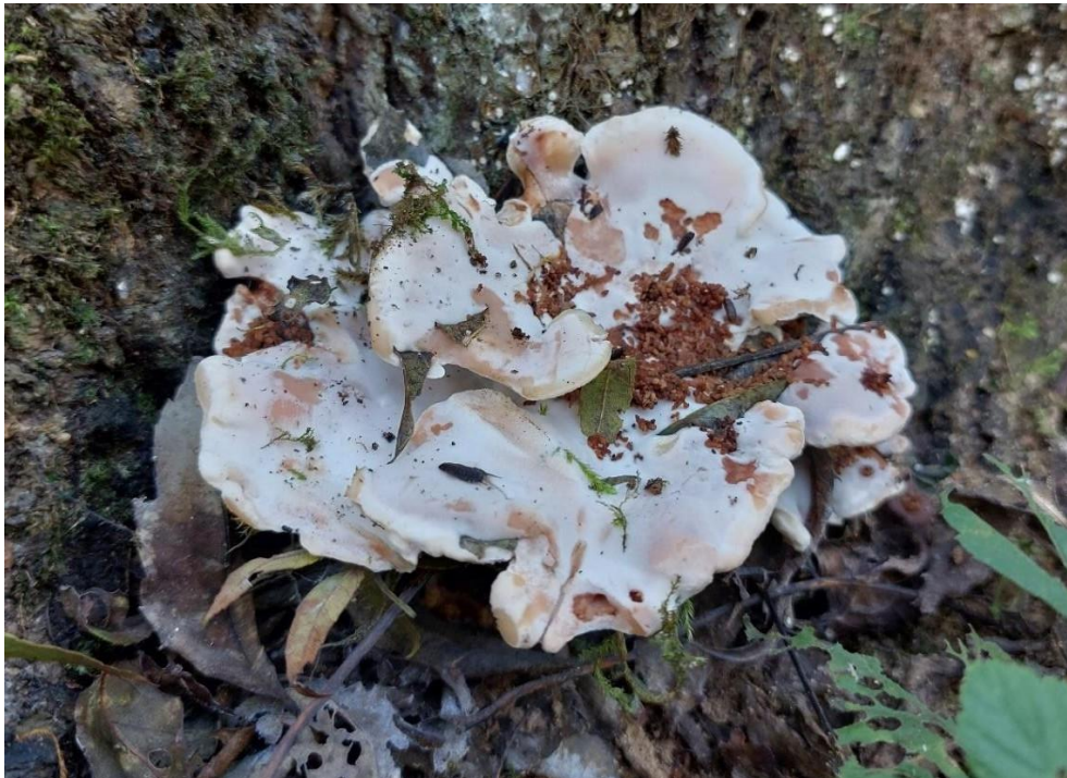
Slika 4. Abortiporus biennis na pridanku debla, GJ Radinje, 12. listopada 2023.

U sklopu ovog istraživanja, njegova pojavnost zabilježena je samo jednom, u šumariji Nova Kapela, GJ Radinje, odsjek 49c, 12. listopada 2023. Iako njegova prisutnost na panjevima jasena nije posve neuobičajena, pronađen je i na pridanku jednog živog stabla, što je vidljivo na Slici 4.