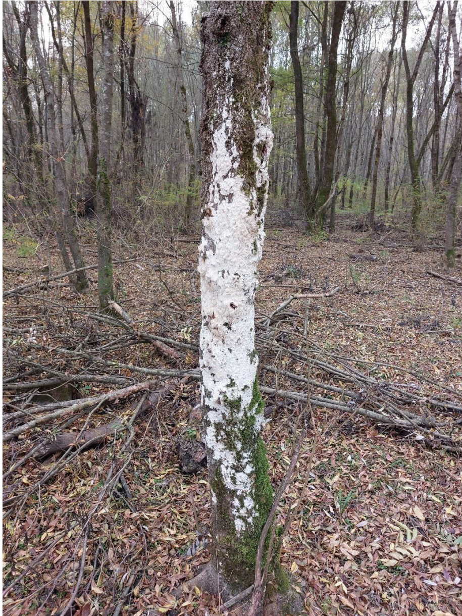
Slika 30. Mlađe stablo u potpunosti obrašeno vrstom Schizopora paradoxa , GJ Kutinske nizinske šume, 28. listopada 2022.