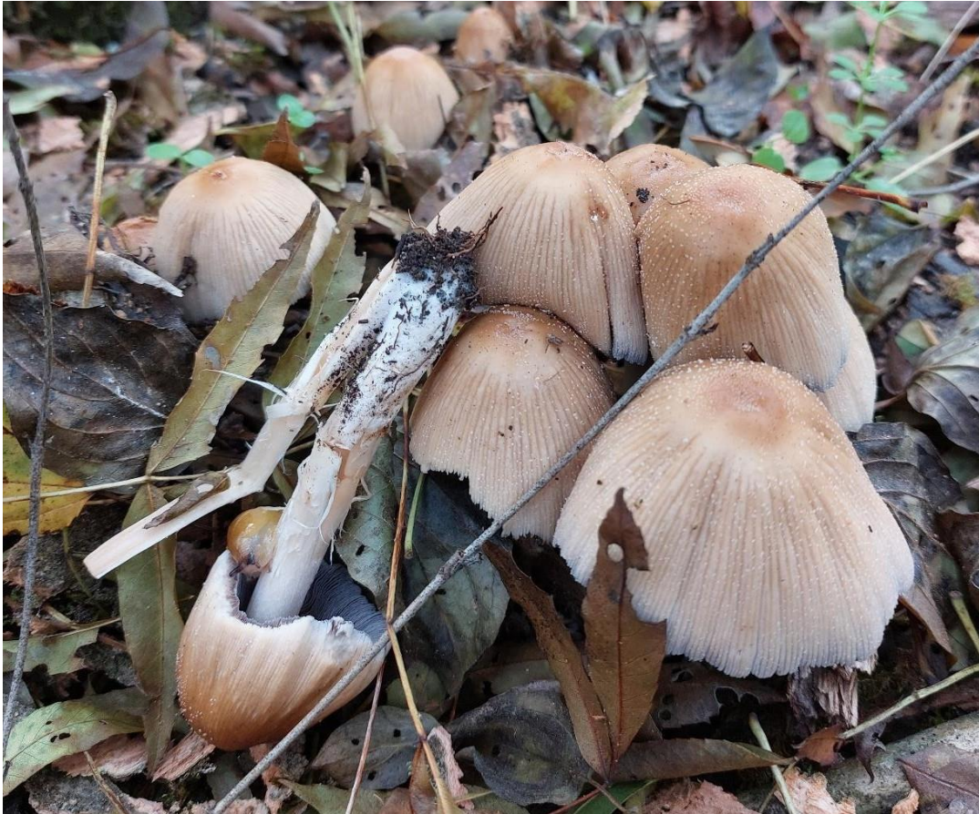
Slika 9. Coprionellus micaceus sa svojim prepoznatljivim morfološkim obilježjima, GJ Kutinske nizinske šume, 28. listopada 2022.

Vrlo je raširena u šumama koje su predmet istraživanja, a za vrijeme kišnih jesenskih dana u nekim sastojinama obrašta velik dio površine tla, razgrađujući odumiruće korijenje jasena. Takav prizor moguće je uočiti i u starijim i u mlađim sastojinama, gdje na stotine plodišta okružuju stabla. Velike nakupine raspadajućih plodišta pretvaraju se u viskoznu crnu tekućinu procesom autolize, što pak privlači brojne insekte. Takvi prizori pomalo poetično dočaravaju situaciju u kakvoj se nalaze naši jasenici gdje možemo doslovno prisustvovati umiranju čitavog jednog ekosustava. Sva stabla koja su okružena plodištima ove gljive vrlo su lošeg vitaliteta, a lako je uočljivo kako buseni izbijaju iz cijele površine postranog korijenja. Često se, slijedeći korijen do pridanka, ona mogu pronaći i na samome pridanku debla ( Slika 10. ), gdje često nalazimo i plodišta drugih vrsta truležnica.