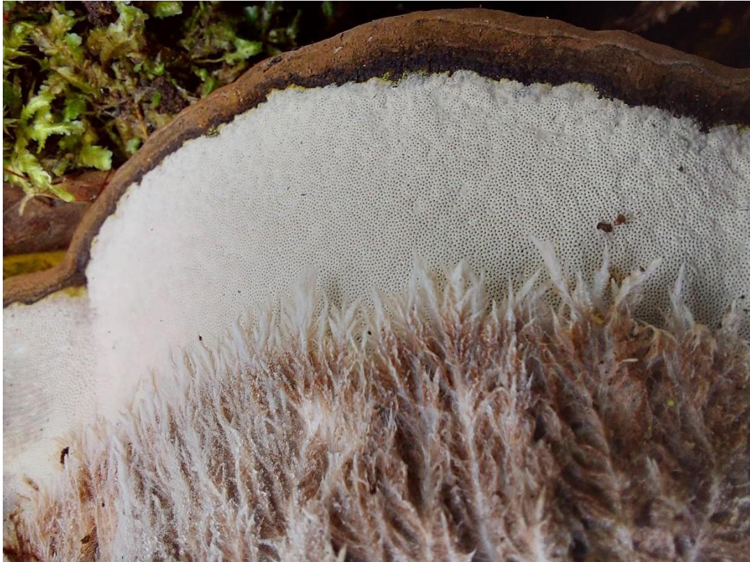
Slika 35. Sporophagomyces chrysostomus na Ganoderma cf. adpersum , GJ Trstenik, 11. listopada 2023.