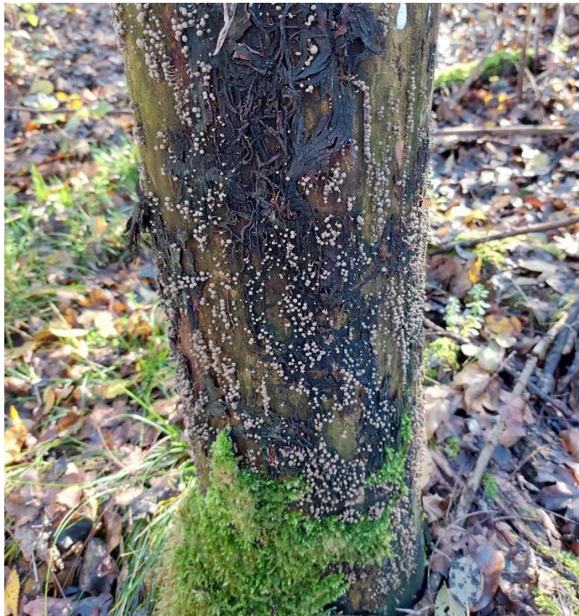
Slika 23. Phleogena faginea s rizomorfama, GJ Radinje, 25. studenoga 2022.