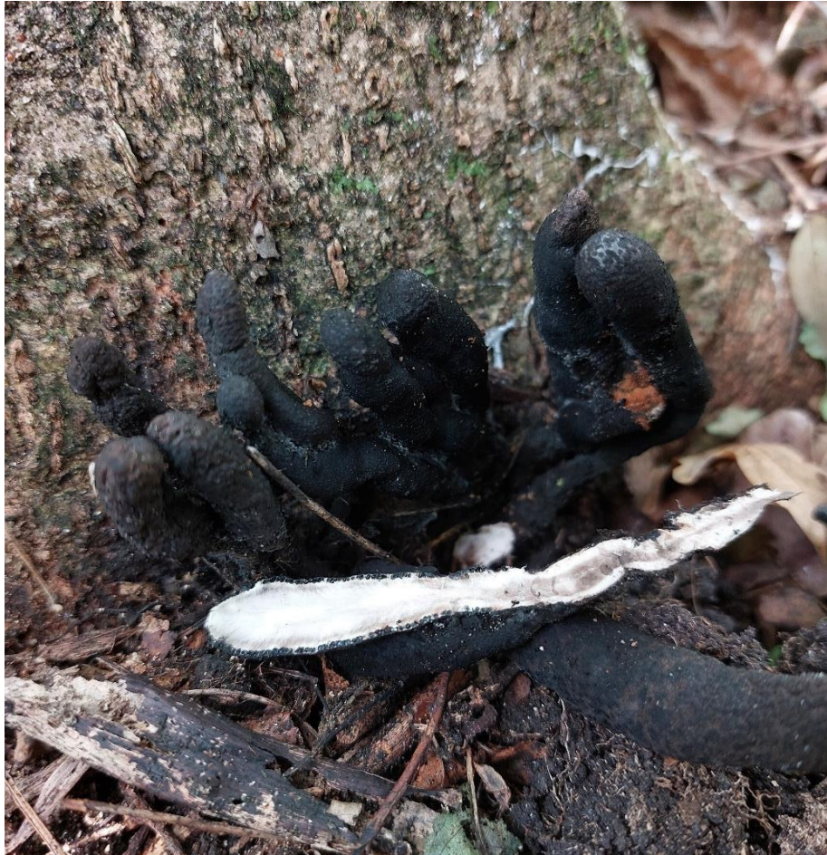
Slika 34. Xylaria polymorpha na vratu korijena živog poljskog jasena, GJ Trstenik, 11. listopada 2023.

Pronalazak ove vrste na živim stablima pomalo je neočekivan, jer se u literaturi kao njezino stanište navode odumrli biljni ostaci. 2023. godine pronađena je kako raste iz relativno vitalnih, mlađih stabala u 3 odvojena primjera, što pokazuje kako može kolonizirati i još živa stabla.