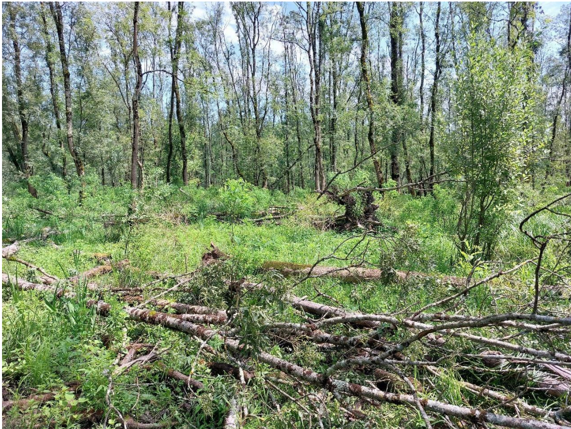
Slika 36. Vjetroizvale u odsjeku 39b, GJ Lonja, 20. srpnja 2023.

Osim poplava, zadnjih godina su u ljetnom periodu godine sve češće i razorne oluje. Nažalost, 19. srpnja 2023. svjedočimo jednoj od najrazornijih takvih oluja u posljednje vrijeme koja je poharala dobar dio kontinentalne Hrvatske. Velika količina padalina popraćena snažnim naletima vjetra tako u samo jednoj večeri uzrokuje golemu materijalnu štetu diljem kontinenta, a takva se šteta očitovala i u šumama. „Sreća u nesreći“ jest izlazak na teren idućeg dana, 20. srpnja, u GJ Lonja, šumarije Sunja. Na terenu odmah po dolasku svjedočimo izuzetno vjetroizvalama devastiranoj sastojini u odsjeku 39b ( Slika 36. ). Spomenuta je sastojina starosti oko 70 godina i tu je jasen pri kraju ophodnje, a florni sastav upućuje i na terminalni dio razvoja jasenove sastojine zbog visokog udjela mezofilnijih vrsta (Anić i dr., 2022).