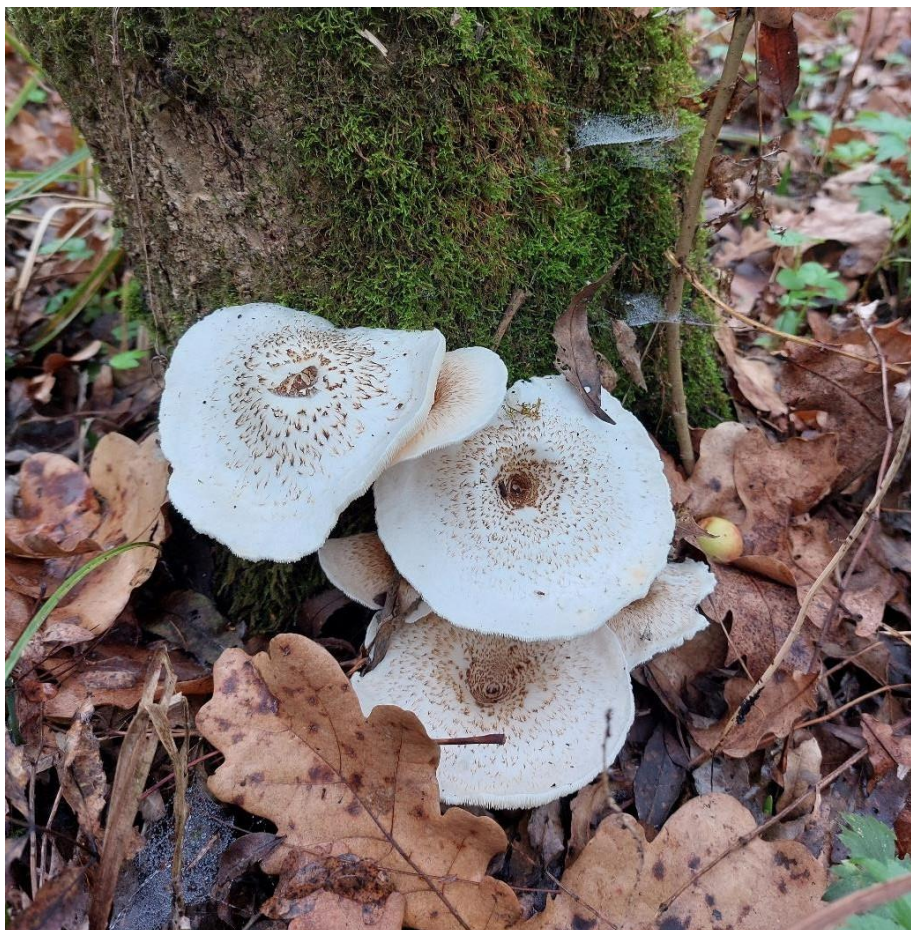
Slika 19. Lentinus tigrinus na pridanku jasena, GJ Kutinske nizinske šume, 28. listopada 2022.

Lentinus tigrinus truležnica je tipična u nizinskim staništima, gdje obrasta najčešće povaljene vrbe i topole, a javlja se cijele godine za vlažnijeg vremena. Raste busenasto, gdje nekoliko stučaka izbija iz zajedničkog primordija. Tvori klobuk koji može biti širine do 10 cm, himenij je u obliku listića bijele boje kao i ostatak gljive, a lako se prepoznaje po tamnim čehicama koje prekrivaju klobuk i stručak ( Slika 19. ). U narodu poznata kao vrbovača, zbog staništa, koristi se za ishranu ljudi (Božac, 2008).