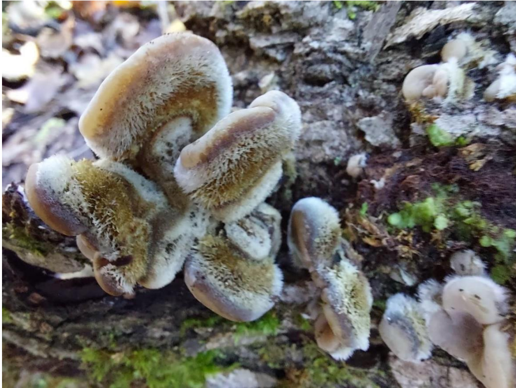
Slika 5. Auricularia mesenterica – mlada plodišta na živom poljskom jasenu, GJ Kutinske nizinske šume, 28. listopada 2022.

Njezina uloga u propadanju poljskog jasena vjerojatno je veća nego bi broj pronađenih uzoraka sugerirao. Spomenuti odsjek 16c u šumariji Kutina prepun je sušaca koje obrašta gomila plodišta ove gljive, a pošto je nalazimo i na živim primjercima, može se zaključiti da nakon iscrpljivanja domaćina nastavlja njegovo razlaganje kao saprotrof. Međutim, odsustvo na drugim lokacijama pokazuje kako je njezina uloga možda lokalnog karaktera te nije jedan od opasnijih štetnika.