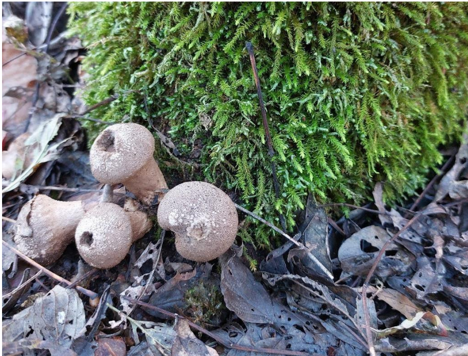
Slika 20. Lycoperdon perlatum na pridanku jasena, GJ Trstenik, 25. studenoga 2022.

Lycoperdon perlatum saprotrofna je vrsta koja se često nalazi u listopadnim i crnogoričnim šumama diljem Hrvatske. Raste na raspadajućim drvenim ostacima. Plodište je formirano od glave i stručka, tikvastog je oblika, a u mladosti je potpuno bijele boje. Kako gleba sazrijeva, boja se mijenja u maslinastozelenu dok se napokon cijelo plodište ne osuši, posmeđi i počinje otpuštati sazrijele spore (Cetto, 1983). Pronađena je samo jednom prilikom na živom jasenu ( Slika 20. )