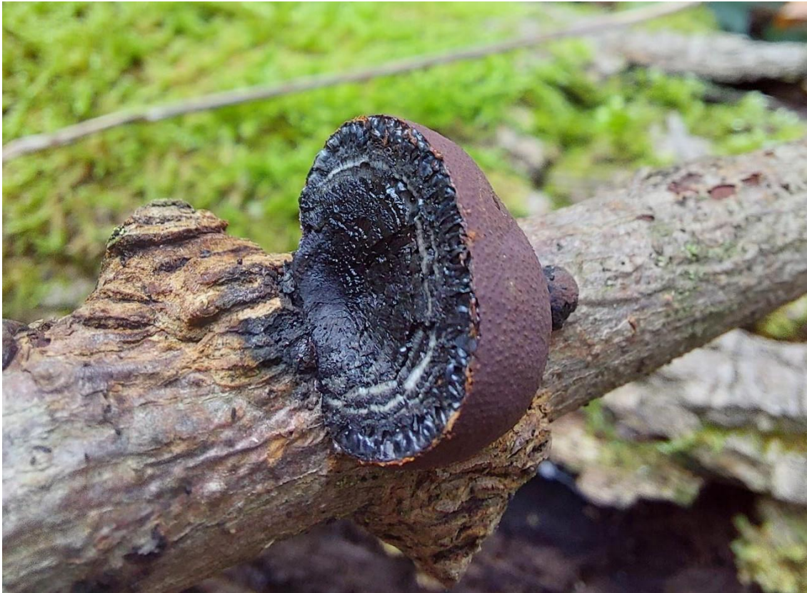
Slika 11. Daldinia concentrica na otpalnoj grani poljskog jasena, GJ Kutinske nizinske šume, 28. listopada 2022.

Daldinia concentrica jedna je od dvije pronađene truležnice koje pripadaju odjeljku Ascomycota , a njezino su uobičajeno stanište otpale grane različitog listopadnog drveća. Njeno plodno tijelo nepravilno je okruglasto ili jastučasto, valovite i kvrgave površine najprije crvenkastosmeđe, a zatim crne boje (Božac, 2008). Naziv concentrica dobila je po koncentričnim krugovima koji su vidljivi na presjeku plodišta ( Slika 11. ).