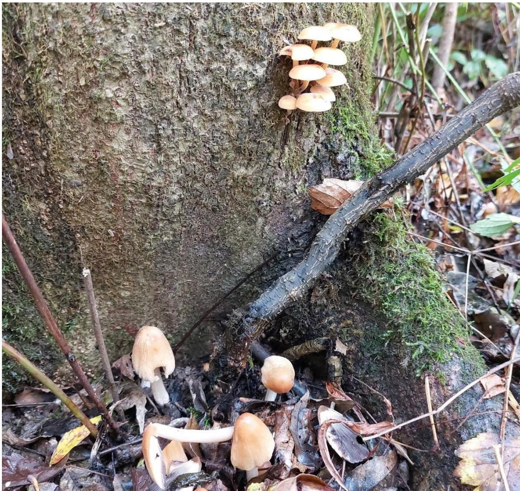
Slika 12. Flammulina velutipes na živom jasenu (gore), zajedno s Coprinellus cf. micaceus (dolje), GJ Lonja, 27. listopada 2023.

Flammulina velutipes , zimska ili baršunasta panjevčica, kako joj narodni nazivi glase, poznata je vrsta sakupljačima gljiva i gljivarima, osobito u nizinskim predjelima. Njezino najčešće stanište su ritske šume gdje nastanjuje najčešće vrbe i topole. Podjednako se često javlja na živim i na odumrlim biljnim dijelovima. Parazitira na živom drveću kojega iscrpljuje, a nakon njegovog ugibanja fakultativno nastavlja svoj razvoj kao saprotrof. Jedna od njezinih odlika je da raste tijekom cijele zime, što je uz bukovaču ( Pleurotus ostreatus ) čini najtraženijom jestivom gljivom hladnijeg dijela godine. Raste busenasto ( Slika 12. ), iako su velike nakupine plodišta prilično rijetke (Božac, 2005).