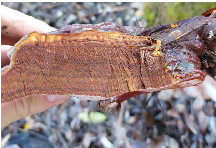
Slika 18. Poprečni presjek plodišta G. resinaceum , GJ Radinje, šumarija Nova Kapela, 25. studenoga 2022.