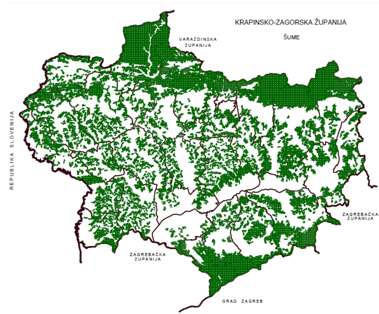
Slika 4: Šume u Krapinsko-zagorskoj županiji

U strukturi zemljišta u Krapinsko-zagorskoj županiji poljoprivredno zemljište čini oko 70.500 ha, od čega je u privatnome vlasništvu gotovo 99%, dok šuma i šumskih zemljišta ima oko 44.000 ha. Privatne šume na području Krapinsko-zagorske županije pokrivaju ukupno 78% svih šuma i uz Varaždinsku, Krapinsko-zagorska županija jedina je u kojoj je više privatnih nego državnih šuma. Osnovna karakteristika privatnih šuma je rascjepkanost i vrlo mala površina po vlasniku i parceli te lošije gospodarenje u odnosu na državne šume. Problemi u gospodarenju šumama u privatnom vlasništvu očituju se u nedostatku podataka o šumama i lošoj edukaciji vlasnika, a posljedica toga je loše ukupno stanje šuma, što se negativno odražava i na biološku raznolikost i gospodarsku vrijednost tih šuma.