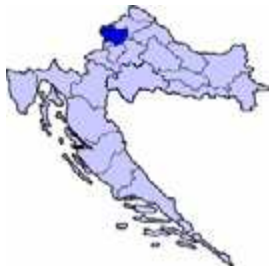
Slika 1: Položaj Krapinsko-zagorske županije

Krapinsko-zagorska županija nalazi se u sjeverozapadnom dijelu Republike Hrvatske, zasebna je geografska cjelina koja se pruža od vrhova Maclja i Ivančice na sjeveru do Medvednice na jugoistoku. Zapadna granica, ujedno i državna s Republikom Slovenijom, je rijeka Sutla, a istočna je vododjelnica porječja Krapine i Lonje