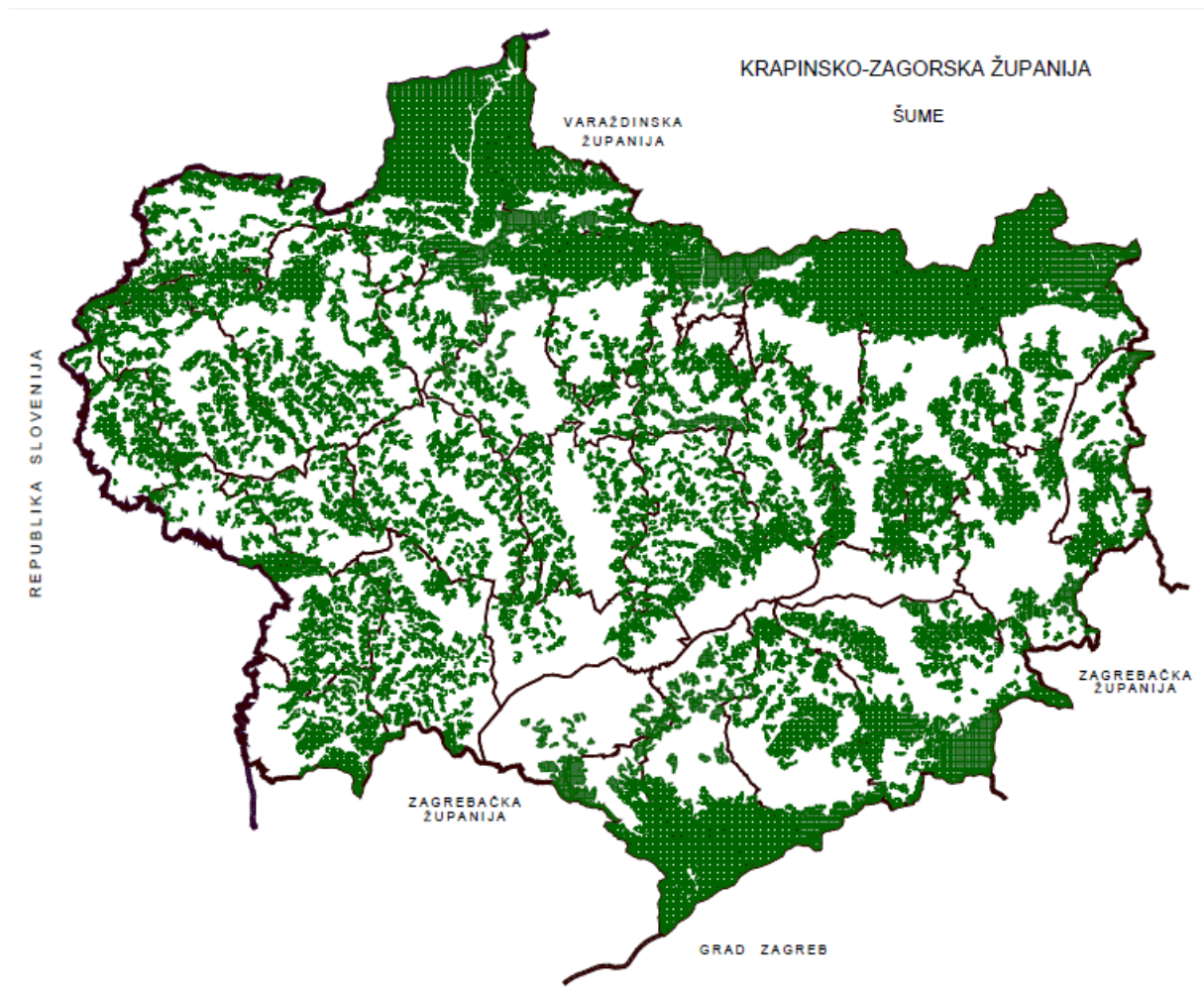
Slika 4: Šume u Krapinsko-zagorskoj županiji

U strukturi zemljišta u Krapinsko-zagorskoj županiji poljoprivredno zemljište čini oko 70.500 ha, od čega je u privatnome vlasništvu gotovo 99%, dok šuma i šumskih zemljišta ima oko 44.000 ha. Privatne šume na području Krapinsko-zagorske županije pokrivaju ukupno 78% svih šuma i uz Varaždinsku, Krapinsko-zagorska županija jedina je u kojoj je više privatnih nego državnih šuma. Osnovna karakteristika privatnih šuma je rascjepkanost i vrlo mala površina po vlasniku i parceli te lošije gospodarenje u odnosu na državne šume. Problemi u gospodarenju šumama u privatnom vlasništvu očituju se u nedostatku podataka o šumama i lošoj edukaciji vlasnika, a posljedica toga je loše ukupno stanje šuma, što se negativno odražava i na biološku raznolikost i gospodarsku vrijednost tih šuma.