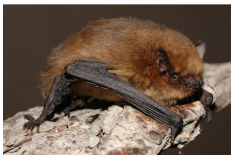
Slika 19. Pipistrellus pipistrellus (Kaup, 1829) – patuljasti šišmiš