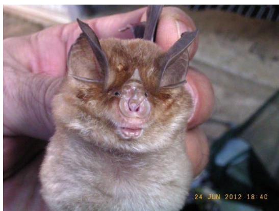
Slika 21. Rhinolophus euryale (Blasius, 1853) – južni potkovnjak

Izrazito špiljska vrsta, iako na sjeveru areala ljeti boravi u zvonicima ili zgradama. Živi u toplim šumama na krševitoj podlozi s brojnim špiljama u blizini vode. Na sjevernom rubu areala živi do visine od 943 m, iako je 70% zimskih skloništa niže od 400 m n. v.