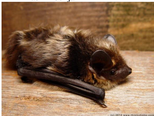
Slika 2. Eptesicus serotinus (Schreber, 1774) – kasni noćnjak

Kasni noćnjak jedna je od najvećih vrsta šišmiša u Europi.