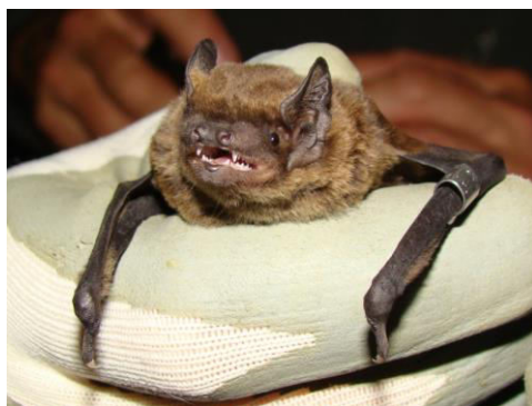
Slika 12. Nyctalus leisleri (Kuhl, 1817) – mali večernjak

Mali večernjak voli otvorena staništa, rijeke ili jezera, a često se nađe i u gradskim parkovima. Tipična je šumska vrsta, nije vezana uz određeni tip drveća, odnosno šumskog staništa, ali jasno preferira šume s brojnim starim stablima. Boravi u većim dupljama i pukotinama stabla koja se nalaze na visini iznad 18 metara.