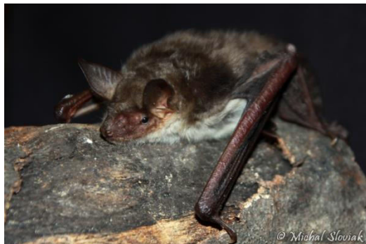
Slika 6. Myotis blythii (Tomes, 1857) – oštouhi šišmiš

Veliki glatkonosac. Značajna špiljska vrsta. Živi u toplijim područjima s rijetkim šumama i grmljem, parkovima, naseljima. Daje prednost krškom području. Često formira kolonije s vrstom M. myotis , iako M. blythii daje prednost toplijim područjima. Nije točno poznato koliko se vrste ekološki razlikuju. U planinama dolazi do visine od 1500 m.