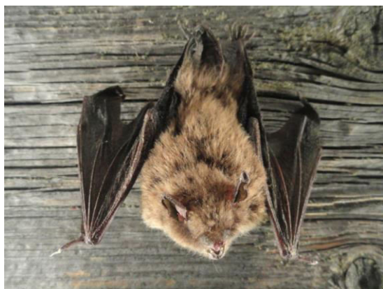
Slika 8. Myotis daubentonii (Leisler, 1819) – riječni šišmiš

Tipičan stanovnik šuma. Naseljava pukotine i šupljine u stablima (prvenstveno bukvi), čiji su otvori udaljeni manje od jednog metra od razine tla. Živi u blizini vodenih površina, jezera, lokvi i potoka. Ljeti dolazi do visine od 750 m, a zimi je dokazan do 1400 m n. v.