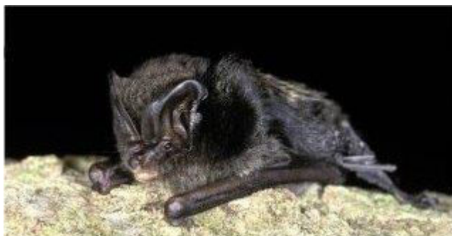
Slika 1. Barbastella barbastellus (Schreber, 1774) – širokouhi mračnjak

Širokouhi mračnjak srednje je velika vrsta šišmiša.