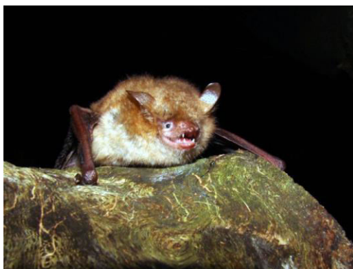
Slika 9. Myotis emarginatus (Goeffroy, 1806) – riđi šišmiš

Riđi šišmiš vrsta je koja voli topla područja i krške predjele. Na sjeveru je pretežno kućni šišmiš, a na jugu boravi u špiljama. Nastanjuje šumska i grmljem obrasla staništa, vrtove i parkove u blizini vodenih područja; u ravnicama i donjem brdskom području. Porodiljske kolonije najčešće se nalaze na visinama od 200-500 m, no postoje podaci i o kolonijama u špiljama na 1800 m n. v. Kolonije formira i s drugim