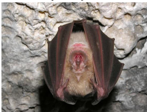
Slika 22. Rhinolophus ferrumequinum (Schreber, 1774) – veliki potkovnjak

Najviše mu odgovaraju topla područja, južne padine i doline djelomično prekrivene šumama, grmljem, garizima i makijom; u blizini stajaćih ili tekućih voda. Daje prednost krškim područjima. Na sjeveru boravi u kućama, a na jugu areala u špiljama. Čest je u