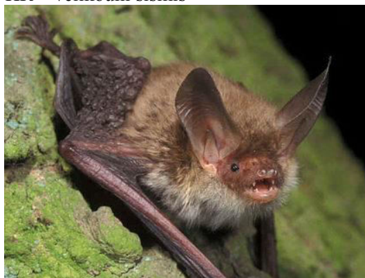
Slika 5. Myotis bechsteinii (Kuhl, 1818) – velikouhi šišmiš