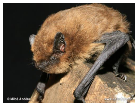
Slika 20. Pipistrellus pygmaeus (Leach, 1825) – močvarni patuljasti šišmiš

Patuljasti i bjeloruski šišmiš vrsta je vezana za kuće odnosno naselja te djelomično parkove i šume. Novotkrivena vrsta močvarni patuljasti šišmiš češće koristi vodena i šumska