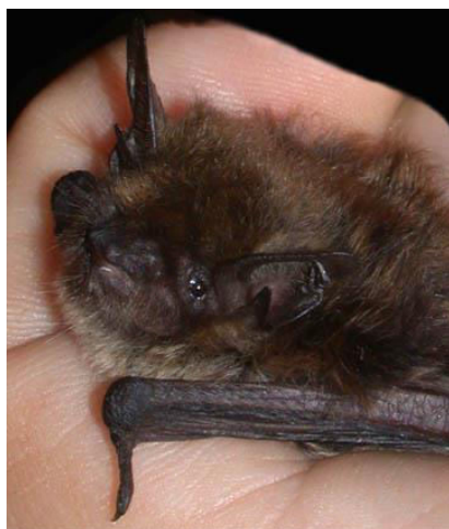
slika 7. Myotis brandtii (Eversmann, 1846) – Brandtov šišmiš

Brandtov šišmiš je po mnogočemu sličan brkatom šišmišu ( Myotis mystacinus ). Osim u razlici da je brkati šišmiš nešto manji od brandtovog šišmiša, najveća razlika je u izgledu tragusa, spolovila te dodataka na zubima.