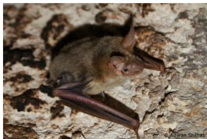
Slika 10. Myotis myotis (Borkhausen, 1797) – veliki šišmiš