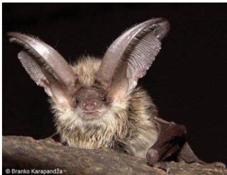
Slika 14. Plecotus austriacus (Fischer, 1829) – sivi dugoušan

Rod Plecotus (dugoušani) karakteriziraju izričito duge uši. U Hrvatskoj dolazi 4 vrste dugoušana od kojih je 3 zabilježeno na Medvednici ( P. auritus , P. austriacus i P. macrobullaris )