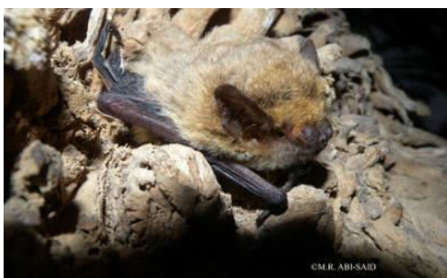
Slika 17. Pipistrellus kuhlii (Kuhl, 1817) – bjeloruski šišmiš

Rod Pipistrellus u Europi i Hrvatskoj obuhvaća najmanje šišmiše, a na Medvednici pa i u cijeloj Hrvatskoj dolaze 4 vrste ( P. kuhlii , P. nathusii , P. pipistrellus , Pipistrellus pygmaeus )