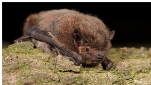
Slika 18. Pipistrellus nathusii (Keyserling&Blasius, 1839) – mali šumski šišmiš