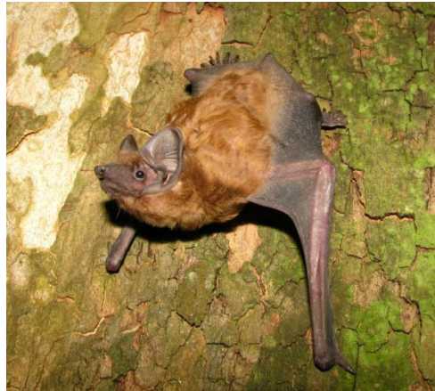
Slika 13. Nyctalus noctula (Schreber, 1774) – rani večernjak

Prvenstveno nastanjuje listopadne šume, a kao sklonište preferira duplje koje je napravio djetlić, te nešto manje ostale rupe u stablima, koje se nalaze na visini 4 do 12 ili više metara iznad tla. Stabla koja odabire uglavnom su uz rub šume ili unutar šume, ali uz neku čistinu, put ili vodeno stanište. Jako rijetko zalazi u ruralna područja.