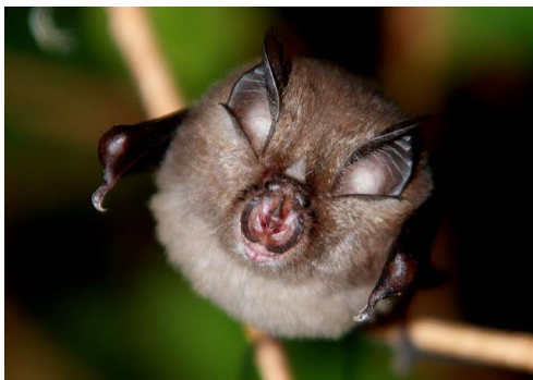
Slika 23. Rhinolophus hipposideros (Bacstein, 1800) – mali potkovnjak

Vrsta živi u toplijim područjima, predjelima zaštićenim od vjetrova, u podnožju planina, šumovitim područjima, kršu. Boravi u zvoncima, potkrovljima, špiljama i zapuštenim rudnicima. Dokazano je da ljeti dolazi do 1160 m n. v., a zimi do 2000 m n. v. Kolonija je zabilježena na najvećoj visini od 1177 m.