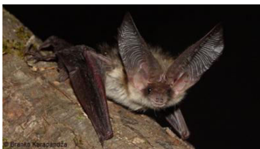
Slika 16. Plecotus macrobullaris (Kuzjakin, 1965) – gorski dugoušan

Smeđi dugoušan ( P. auritus ) u Hrvatskoj je najraširenija vrsta dugoušana, izrazito vezana za šumska staništa. Sivi dugoušan ( P. austriacus ) vezan je za nizinske krajeve sjevernog dijela Hrvatske gdje na tavanima zgrada stvara ljetne porodiljske kolonije. Gorski dugoušan ( P. macrobullaris ) novootkrivena je vrsta dugouhog šišmiša o čijoj se ekologiji i biologiji ne zna gotovo ništa, zna se samo da mu je ukupna brojnost znatno manja od drugih dugoušana.