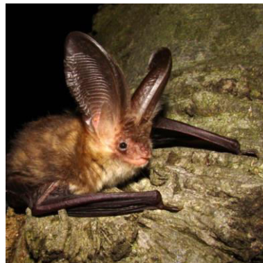
Slika 15. Plecotus auritus (Linnaeus, 1785) – smeđi dugoušan