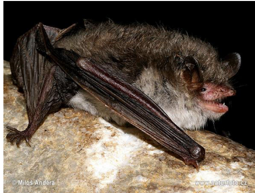
Slika 11. Myotis nattereri (Kuhl, 1818) – resasti šišmiš

Pretežno je šumski šišmiš. Živi u šumama, parkovima i naseljima blizu vlažnih, vodenih područja. Koristi različita skloništa: šupljine u drveću, pukotine u podzemnim objektima, špilje, šupljine i pukotine u unutarnjim zidovima zgrada te u gredama na tavanima. U svim tipovima skloništa zabilježene su i kolonije i pojedinačne jedinke.