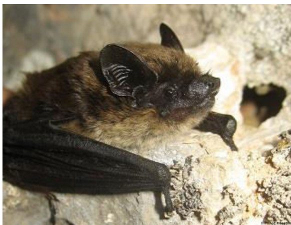
Slika 3. Hypsugo savii (Bonaparte, 1837) – primorski šišmiš

Često se smatra karakteristična vrsta kamenih planinskih područja, ali je njegova raznolikost staništa ipak puno veća. Mozaični krajolik od stjenovitih litica do širokih dolina te ruralnih područja. Često znaju biti u zgradama i drveću, ali rijetko u podzemlju.