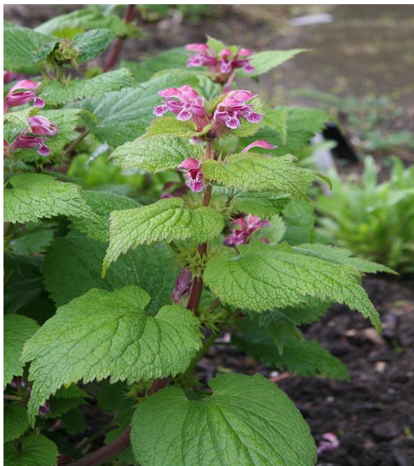
Slika 3. Velika mrtva kopriva ( Lamium orvala )

Fagetum i na panonskom gorju Festuco drymeiae-Fagetum . Sve su asocijacije obilježene ilirskim vrstama iz sveze Aremonio-Fagion , ali su Lamio orvalae-Fagetum i Omphalodo-Fagetum puno bogatije jer se nalaze na prostoru glavnine areala tih vrsta. Florna razlika asocijacija uvjetovana je ekološkim i biogeografskim značajkama područja na kojem se nalaze. Upravo te razlike omogućuju jasnu diferencijaciju unutar podsveze. Svojevrsne vrste podsveze su Lamium orvala , Scopolia carniolica , Cardamine waldsteinii , Cardamine kitaibelli i Cardamine pentaphylla (Vukelić 2012).