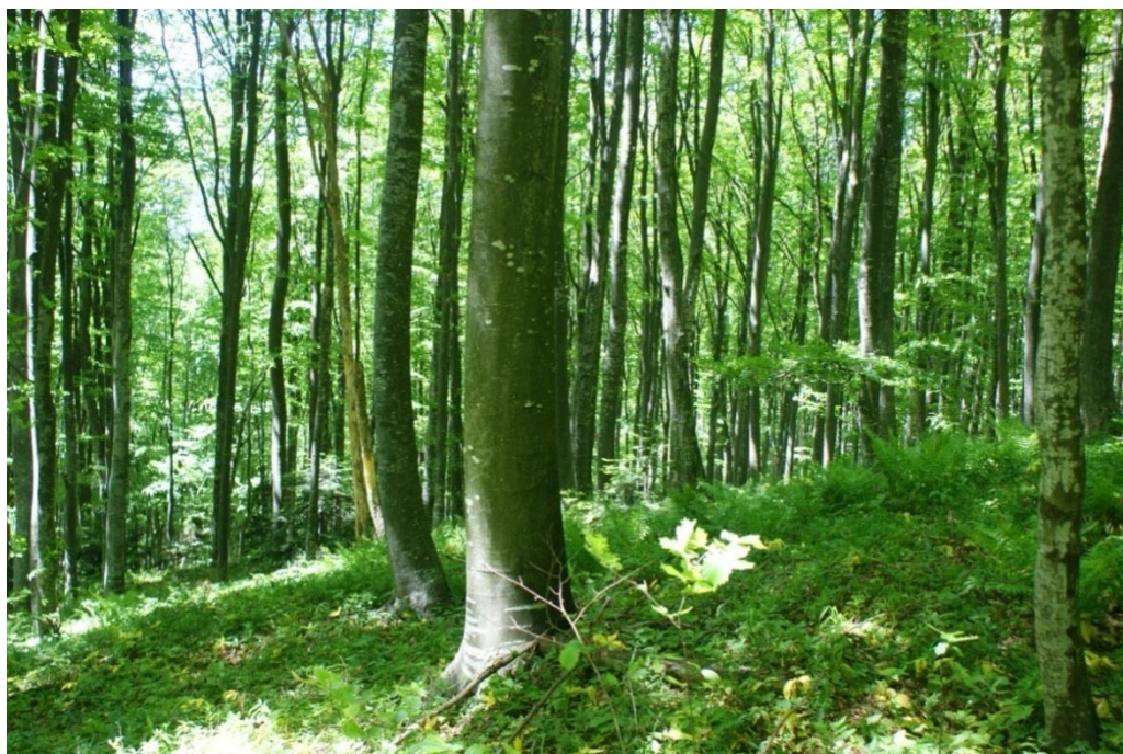
Slika 4. Asocijacija Lamio orvalae-Fagetum na Medvednici

Edifikatorska vrsta u sloju drveća je obična bukva, ali osim nje rastu i gorski javor, mliječ, obični jasen, gorski brijest, pitomi kesten, velelisna lipa, mjestimično jela i dr. Sloj grmlja često je vrlo bogat, te ga grade vrste poput Daphne mezereum , D. laureola , Staphylea pinnata , Sambucus nigra , Lonicera alpigena , Euonymus latifolius , Corylus avellana , Cornus sanguinea , Crataegus monogyna i mnoge druge. U sloju prizemnog rašća ističe se Lamium orvala kojoj je područje rasprostiranja zajednice glavnina areala. Može se istaknuti razlika između južnog i sjevernog dijela areala zajednice. Južni je dio bogatiji dinarsko-ilirskim vrstama dok u sjevernom dijelu izostaju, a i sama asocijacija je rijedja. Oba dijela areala bogata su vrstama svojstvenim za europske bukove sastojine kao što su Galium odoratum , Sanicula europaea , Actaea spicata , Carex sylvatica , Pulmonaria officinalis , Anemone nemorosa , Lilium martagon , Mercurialis perennis , Lamium galeobdolon , Mycelis muralis , Cardamine bulbifera , Viola reichenbachiana , Galium sylvaticum , Euphorbia amygdaloides , Fragaria vesca i dr.