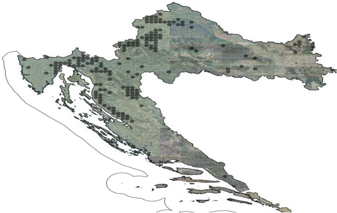
Slika 1. Areal vrste Lamium orvala , izvor: Flora croatica

Bukove šume s mrtvom koprivom rasprostranjene su u dinarskom području Gorskoga kotara, Male i Velike Kapele, Velebita, na području Plitvičkih jezera te u sjeverozapadnoj Hrvatskoj (Samoborsko gorje, Strahinščica, Ivanščica, Medvednica, Moslavačka gora i Kalnik), što se u velikom dijelu poklapa s arealom vrste Lamium orvala (slika 1). Zajednica se prostire na nadmorskoj visini između 400 i 800 m, na različitim ekspozicijama, ravnim terenima, platoima, slabije izraženim grebenima i na ne odveć strmim padinama (Vukelić 2012).