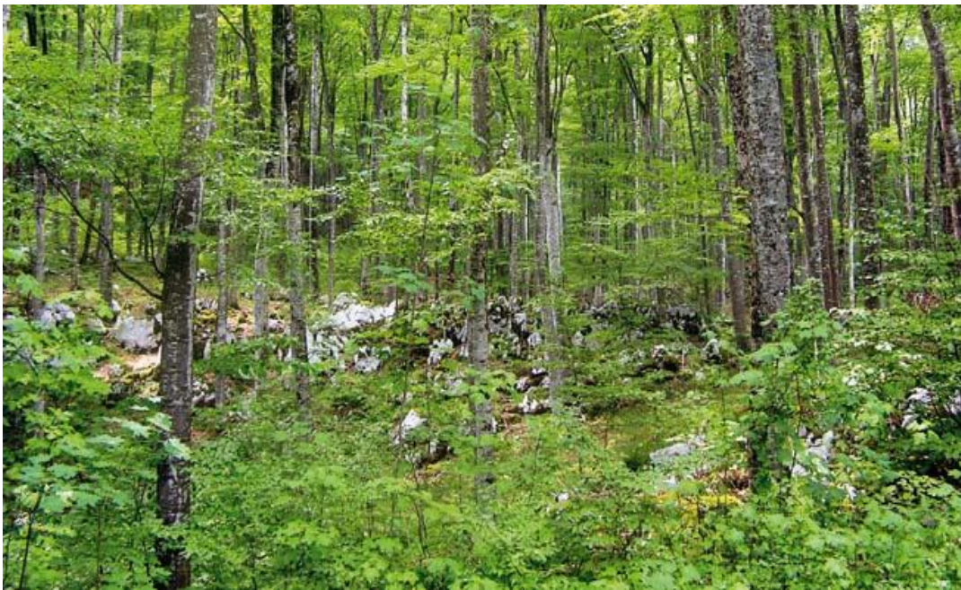
Slika 5. Asocijacija Lamio orvalae-Fagetum u predjelu Medveđak na Plitvičkim jezerima, izvor: Vukelić

Zbog povoljnih ekoloških uvjeta, pravilnoga gospodarenja i relativne nepristupačnosti brdskih položaja većina sastojina ove zajednice je dobro očuvana, stabilnoga i bogatoga flornog sastava (Vukelić 2012).