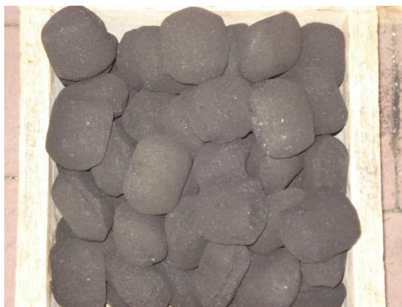
Slika 10. Briket drvnog ugljena za roštilj

Prema normi EN ISO 17225-1 u svojstva drvnog ugljena koja se uzimaju u razmatranje spadaju dimenzije, udio vode, udio pepela, vezani ugljik, gustoća i neto kalorijska vrijednost. Detaljniji prikaz klasifikacije drvnog ugljena po normi EN ISO 17225-1 nalazi se u tablici 5.