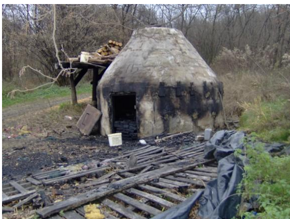
Slika 9. Ugljenica (www.ekopoduzetnik.com)