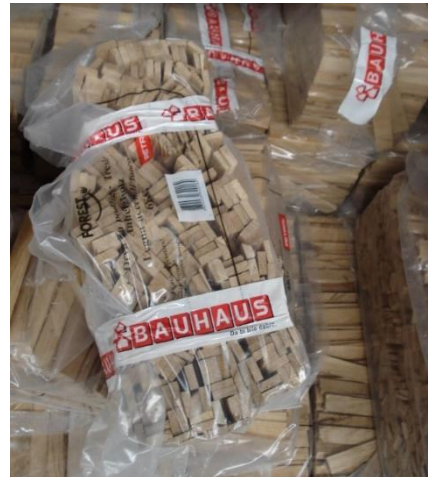
Slika 4. Drvo za potpalu