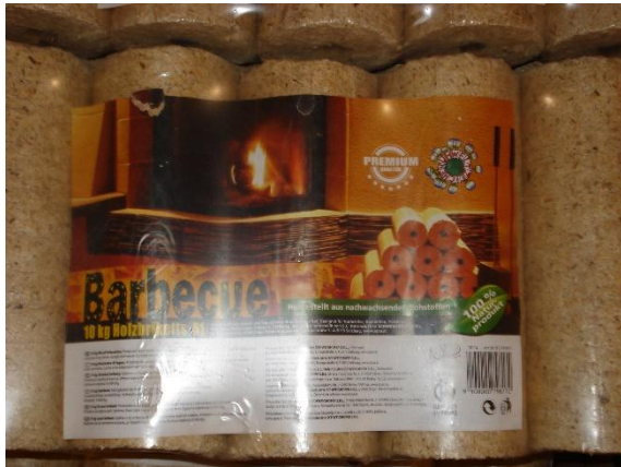
Slika 7. Drvni briketi za roštilj