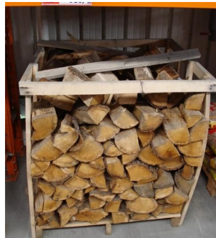
Slika 2. Kratko rezano i cijepano drvo na paleti 1x1x0,8 m