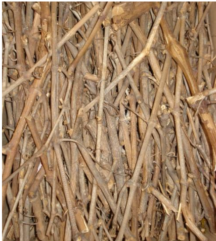
Slika 3. Drvo vinove loze za roštilj