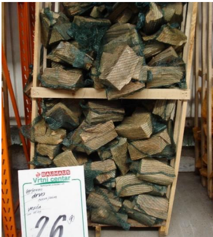
Slika 1. Kratko rezano i cijepano drvo složeno u vreće na paleti

Prilikom prerade oblog energijskog drva u kratko rezano i cijepano drvo, na učinkovitost proizvodnje utječu kvaliteta proizvoda i vrijeme koje se utroši za proizvodnju jedinice proizvoda. Da bi proizvedeno čvrsto biogorivo imalo najbolju moguću kakvoću s obzirom na sirovinu iz koje je proizvedeno, potrebno je provoditi sustavnu kontrolu kvalitete proizvodnje. Tako će se izbjeći da se od sirovine najveće kvalitete proizvede nekvalitetno biogorivo (Vusić i dr. 2014). Visine složaja kratkog cijepanog drva koje se isporučuje na paletama su 1 m, 1,4 m, 1,8 m i 2 m (Krpan i dr. 2015).