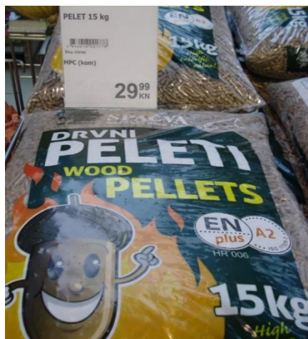
Slika 5. Drvni peleti u ambalaži

je cijena peleta u odnosu na cijenu sirove nafte do kolovoza 2008. godine bila niža za 60 %. Cijena peleta niža je i danas, ali razlika iznosi 40 % ( http://www.drwnipelet.hr ).