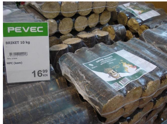
Slika 8. Drvni briketi za ogjev