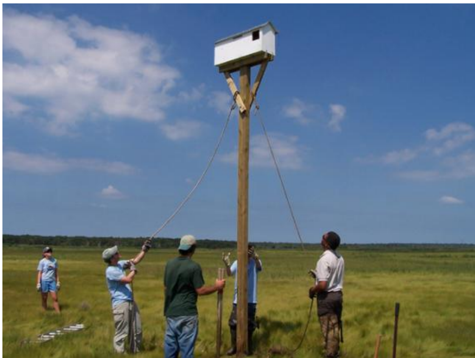
Slika 17. Postavljanje gnijezda na stupovima za kukurviju drijemavicu ( Tyto alba )

Kukurvije drijemavice se odavno koriste za kontrolu sitnih glodavaca zahvaljujući primjeni umjetnih gnijezda i smanjenju uporabe rodenticida. Prethodne studije pokazale su da je korištenje kukurvije drijemavice u svrhu biološke kontrole glodavaca u poljoprivredi ekonomski isplativo. Stoga je Ministarstvo poljoprivrede i ruralnog razvoja, zajedno sa Društvom za zaštitu prirode započelo Nacionalni program „Kukurvija drijemavica“ kojim pokušavaju ovu biološku metodu „usaditi“ u praksu izraelskih poljoprivrednika u čemu su i uspjeli. Sve većom uporabom bioloških metoda, očekivan je pad primjene rodenticida. Većina farmera koji koriste kukurvije drijemavice za redukciju broja glodavaca smanjili su upotrebu rodenticida za 10% ili su ih prestali koristiti u potpunosti. Na nacionalnoj razini, uporaba rodenticida je smanjena za čak 80-90%, a brojnost glodavaca se stalno prati i stabilna je u cijeloj zemlji.