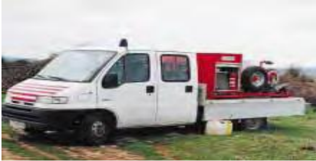
Slika 7. Višenamjenska oprema za šumarstvo

„Arhimed“. Detaljnije informacije o navedenoj inovaciji moguće je pronaći u časopisu Hrvatske šume, broj 52 iz 2001. godine.