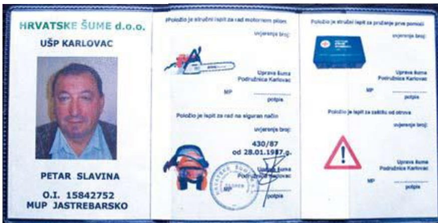
Slika 11. Unutarnja strana iskaznice – brojevi uvjerenja