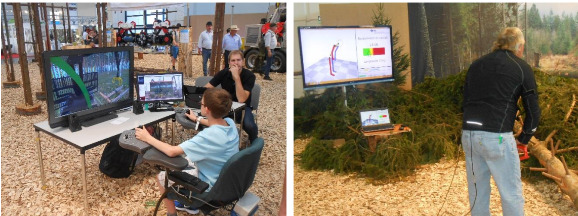
Slika 4. Ranolikost primjene informatičkih tehnologija u šumarstvu

Raznolikost primjene informatičkih tehnologija u šumarstvu prikazana je u E - šumarskoj areni gdje su prezentirana razna softverska rješenja i aplikacije za privatne šumovlasnike, za potrebe osposobljavanja i obrazovanja rukovatelja sredstva rada u šumarstvu pa sve do najmodernijih foto-optičkih mjernih uređaja i sl.