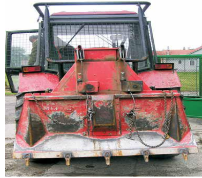
Slika 12. Grebač koji se priključuje na traktor i klinovi zavareni na dasku