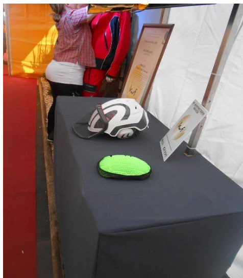
Slika 6. Zaštitna kaciga s inovativnim apsorberom udaraca