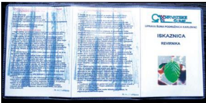
Slika 10. Vanjska strana iskaznice

Naime, prilikom inspekcije na terenu radnik mora predložiti sva uvjerenja o osposobljenosti za rad na siguran način, o stručnoj osposobljenosti za rad s motornom pilom, uvjerenju o položenom ispitu iz prve pomoći, za rad s biljnim otrovima itd. Budući da nisu svi ljudi uvijek na istom mjestu moralo se napraviti mnogo kopija tih uvjerenja te ih nositi i držati u kombiju što nije praktično. Isto tako inspektori traže da sjekači uvijek imaju sa sobom Upute za rad na siguran način koja su se umnožavala i plastificirala pa se ne mogu lako savijati i teško ih je imati uza se pa su ih radnici najčešće gurali pod šljem.