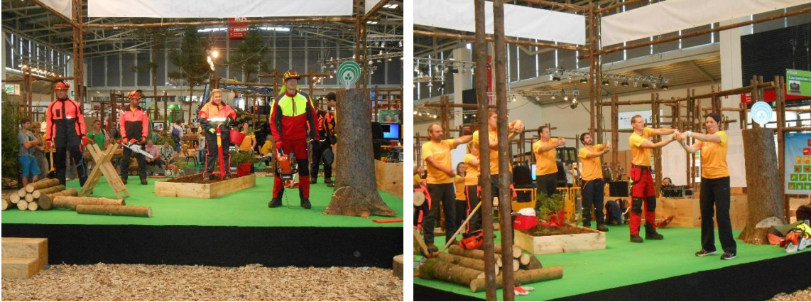
Slika 3. Pokazne vježbe i nastupi šumskih radnika sjekača i instruktora sigurnoga rada

Raznolikost primjene informatičkih tehnologija u šumarstvu prikazana je u E - šumarskoj areni gdje su prezentirana razna softverska rješenja i aplikacije za privatne šumovlasnike, za potrebe osposobljavanja i obrazovanja rukovatelja sredstva rada u šumarstvu pa sve do najmodernijih foto-optičkih mjernih uređaja i sl.