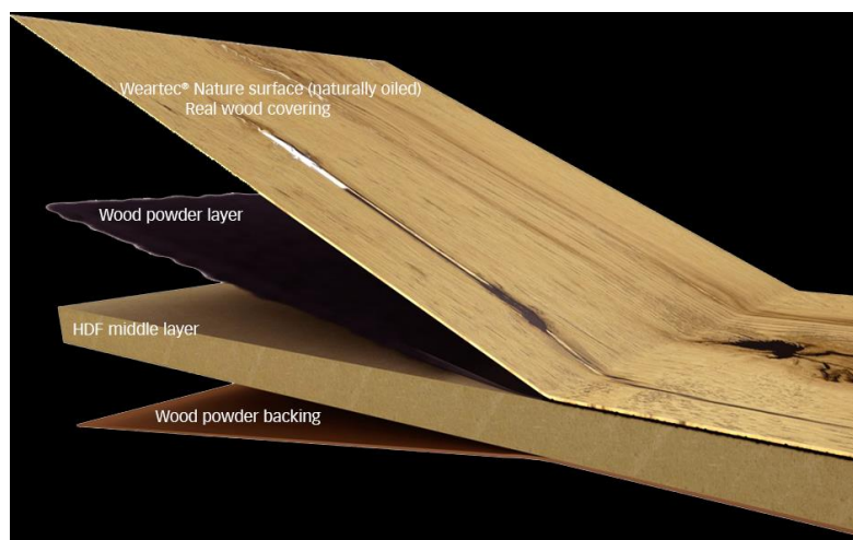
Slika 1. Presjek kroz sustav otpornih drvnih obloga

koja je razvijena od strane tvrtke Välinge za smanjenje proizvodnih koraka u procesu proizvodnje laminata. Drvo u prahu, materijal mješavina finih drvnih vlakana i drugih prirodnih sastojaka, uspješno je implementiran od strane tvrtke MeisterWerke u proizvodnji drvenoga poda Lindura. Pod utjecajem topline i tlaka drveni puder se topi i na taj način spaja gornji sloj furnira na HDF pločama. Rezultat je visoko-otporni drveni pod koji je izdržljiv, jednostavan za održavanje i otporan, te ima jedinstven, rustikalni izgled. (više informacija na www.valinge.se ; www.meisterwerke.com/en )