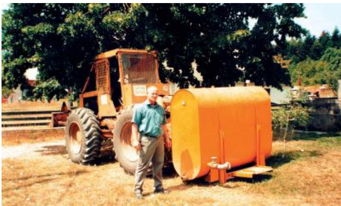
Slika 8. Zglobni traktor s nadogradnjom za gašenje požara

Nadogradnje se montira na traktor u roku od desetak minuta i stroj je spreman za gašenje požara. Rezervoar od dvije tisuće litara na stroju, zamjenjuje 100 vatrogasaca koji na svojim leđima nose dvadesetak litara vode. Poznavajući fizičke napore kojima su gasitelji izloženi prigodom gašenja požara i koliko se izlažu opasnosti, vidljivo je da se postojećom ugradnjom uz minimalna ulaganja postižu izuzetno velike uštede pri gašenju požara. Izrada nadogradnje stoji 20.000 kuna, a više je detalja moguće pronaći u broju 57, 2001. godina (časopis Hrvatske šume).