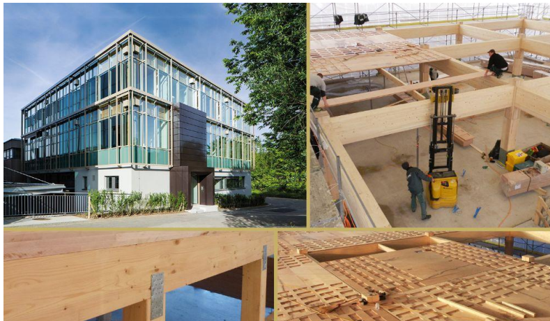
Slika 2. Prikaz pilot kuće sa inovativnim drvnim konstrukcijama