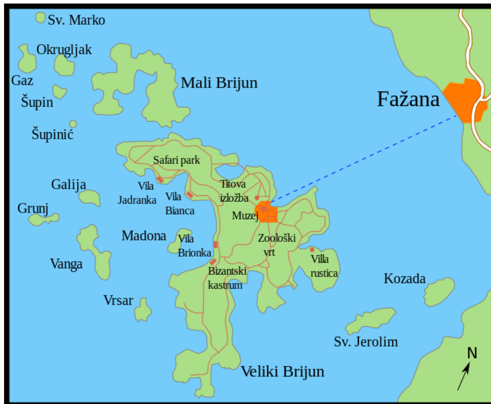
Slika 1. Pregled otoka i znamenitosti u NP Brijuni

Otoci imaju veliku pomorsku važnost. Naseljeni su već u prapovijesno doba, o čemu svjedoče kameni, koštani i keramički nalazi iz neolitika (4000. pr.Kr.) i eneolitika (3000. pr.Kr.). Gradine Velog i Malog Brijuna podigli su brončanodobni stanovnici (oko 2000. pr.Kr.) i Histri, (oko 1000. pr.Kr.). Gradinska (kasteljska) naselja, kiklopski zidovi na Gradini, tumuli, nekropole, ostatci gradina na Malom i Velom Brijunu svjedoče o naseljenosti otoka od ranoga brončanog do antičkog doba. Od 177. bili su u vlasti Rimljana pod nazivom Insulae Pullariae. Nakon propasti Zapadnog Rimskog Carstva u vlasti su Istočnih Gota (476. - 533.), zatim Bizanta do 776. godine. Neko su vrijeme bili pod Francima, potom (od 1230.) pod akvilejskim patrijarsima, a od 1331. vlast je imala Venecija. Tijekom stoljeća su zapušteni, a stanovništvo se iselilo zbog učestalih haranja malarije. Od 1806. su pod vlašću Austrije, odnosno Austro-Ugarske. Krajem 19. st. kupio ih je meranski industrijalac P. Kupelwieser i pretvorio u ekskluzivno ljetovalište. Uz turizam, otoci su bili dio obrambenog sustava puljske luke i Fažanskoga kanala, pa je na njima bilo izgrađeno sedam tvrđava, od kojih je najveća Fort Tegetthoff na brdu Vela straža. Talijanskom okupacijom Istre nakon I. svj. rata otočje gubi značaj mondenoga ljetovališta. Za II. svj. rata ondje je bilo sjedište talijanske vojno-pomorske akademije, potom časničko ljetovalište (odmorište za posade