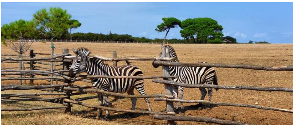
Slika 4. Safari park

Isključen je svaki ribolov i bilo kakvo korištenje podmorja, osim lova na plavu ribu. Ovo zaštićeno morsko prostranstvo nije izgubljena površina za ribolov, jer će more oko Nacionalnog parka time postati bogatije životinjskim vrstama.