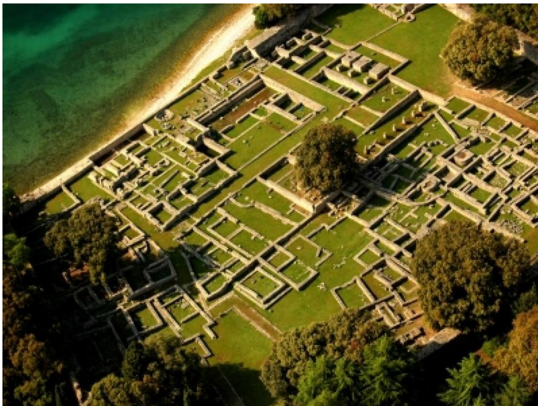
Slika 5. Pogled na ostatke rimske carske vile u uvali Verige

U cijelosti sačuvane građevine koje prezentiraju razdoblje od srednjega vijeka do 18. stoljeća malobrojne su i sve se nalaze na Velikom Brijunu. Najbrojnije su građevine s kraja 19. i prve polovice 20. stoljeća. Znatno je broj tih objekata građevinski sačuvan u izvornom stanju (npr. sve austrijske vojne građevine, dvije vile, hotel Karmen, i dr.).