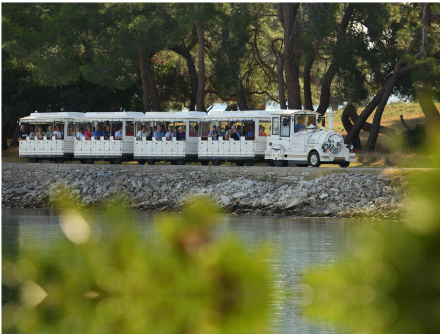
Slika 6. Električni turistički vlakić

Povoljan zemljopisni smještaj NP “Brijuni” omogućuje posjetiteljima dolazak u mjesto Fažanu korištenjem različitih vrsta prometa – cestovni, pomorski, željeznički i zračni, te se onda iz Fažane korištenjem brodica putuje do otočja. Na prostoru Nacionalnog parka “Brijuni” tijekom 20. Stoljeća izgrađeno je ukupno 274 km javnih prometnica, od toga 100 km internih cesta (asfaltnih i makadamskih) i 174 km uređenih posjetiteljskih staza. Postojećim asfaltiranim putovima odvija se promet turističkih posjetitelja izletničkim električnim “vlakovima”. Na obalama Brijunskog otočja uređeno je 10 lokaliteta (luka i pristaništa) za pristajanje brodova i drugih plovila. Glavna luka na Velikom Brijunu izgrađena je početkom 20. stoljeća u prirodnoj uvali, na prostoru nekadašnjeg teretnog pristaništa (za odvoz kamena i dr.). Rekonstrukcija je dovršena 1953. god. Ova luka predstavlja najbliži pomorski lučki objekt u odnosu na istarsku obalu i luku mjesta Fažana, i preko nje se odvija gotovo sav promet posjetitelja nacionalnog parka. Glavna teretna luka “Mletački kaštel”, uz uvalu Tore, služi za prihvat trajekata. Preko ovog mola na Brijunsko otočje stiže pretežni dio teretnog prometa (dnevna opskrba, građevinski materijali, komunalni servisi i dr.).