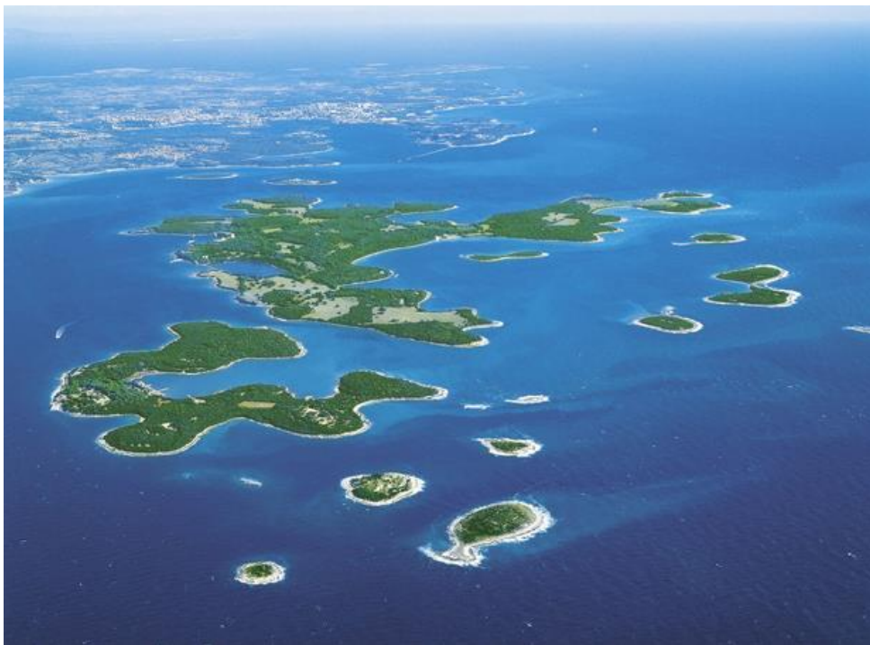
Slika 2. Pogled na NP Brijuni i Pulu iz zraka