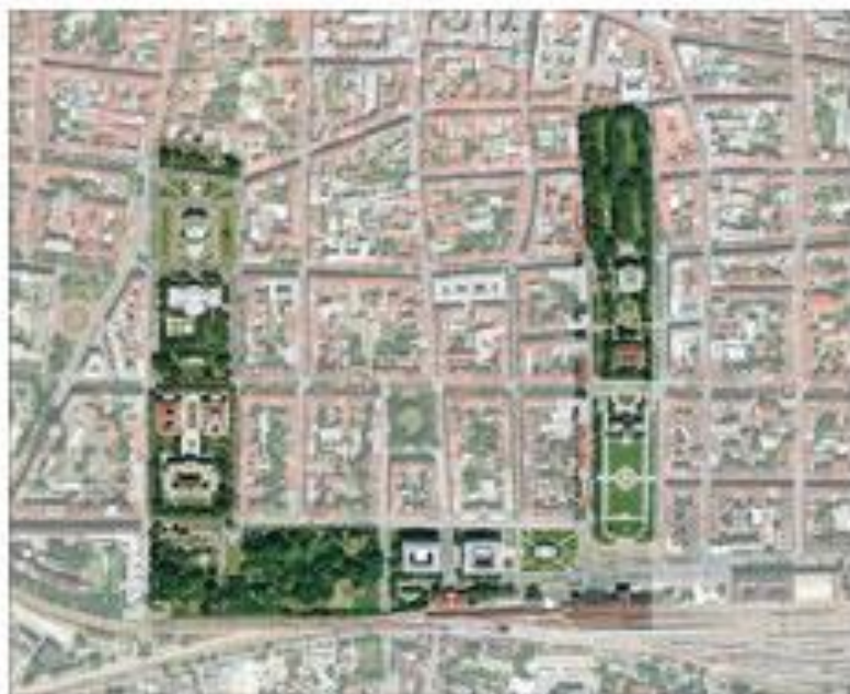
Slika 4. Današnji izgled Lenčićeve potkove.

Iako većina njegovih zamisli i projekata nikada nije ostvarena, barem ne u potpunosti, Milan Lenuzzi (slika 5) postavio je temelje urbanog razvoja Zagreba 20. stoljeća.