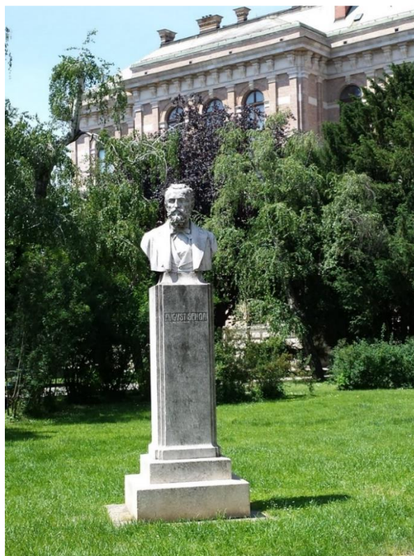
Slika 7. Spomenik Augustu Šenoi.