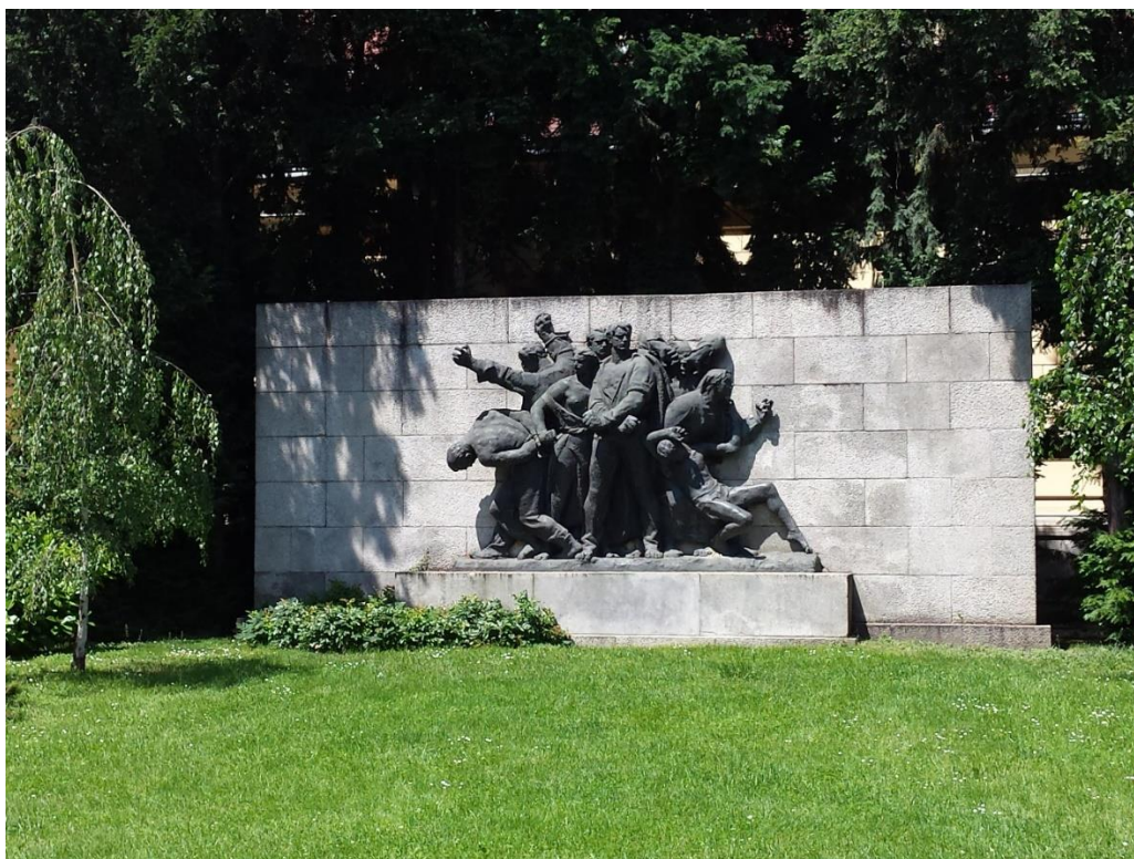
Slika 8. Spomenik Strijeljani, rad Frane Kršinića.