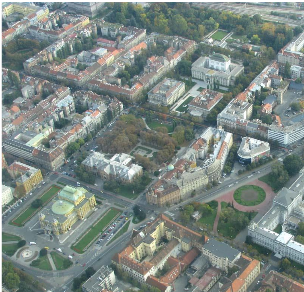
Slika 3. Zapadni i južni perivoj.

Ideja južnog perivoja (slike 3 i 4) nazire se već u prvoj Regulatornoj osnovi , ali njezina realizacija počinje tek utvrđivanjem lokacije za gradnju Botaničkog vrta 1884. godine (1889. godine osniva ga Antun Heinz). Botanički vrt jedini je pejzažni perivoj u sklopu Lenucijeve potkove. Na istočnoj strani Botaničkog vrta 1920. godine utvrđena je lokacija i današnji oblik posljednjeg trga – Trga dr. Ante Starčevića – na kojem se danas nalazi Hotel Esplanade te Gradska knjižnica Zagreb .