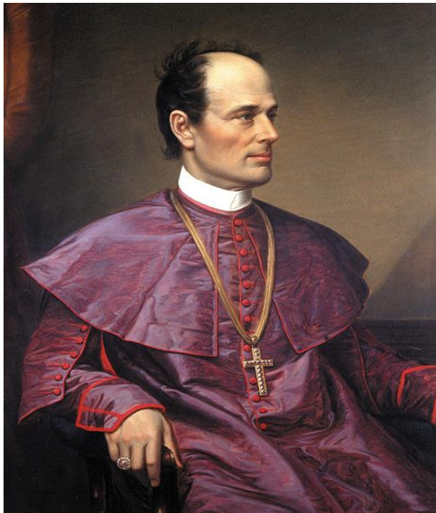
Slika 9. Portret Josipa Jurja Strossmayera.

Starine i dr.), gradnju palače JAZU-a (dovršena 1880.) i utemeljenje galerije, kojoj je darovao svoju privatnu zbirku slika (1884). Sa Starčevićem je dijelio naziv „oca domovine“.