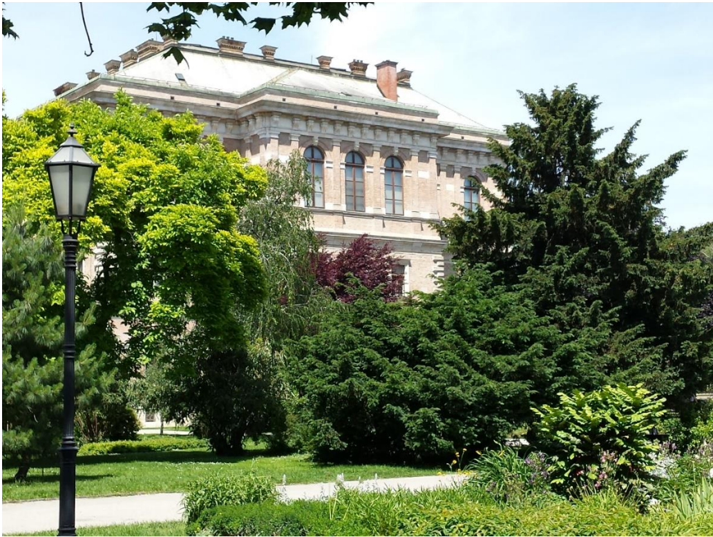
Slika 13. Pogled na palaču HAZU-a sa zapadne strane Trga.