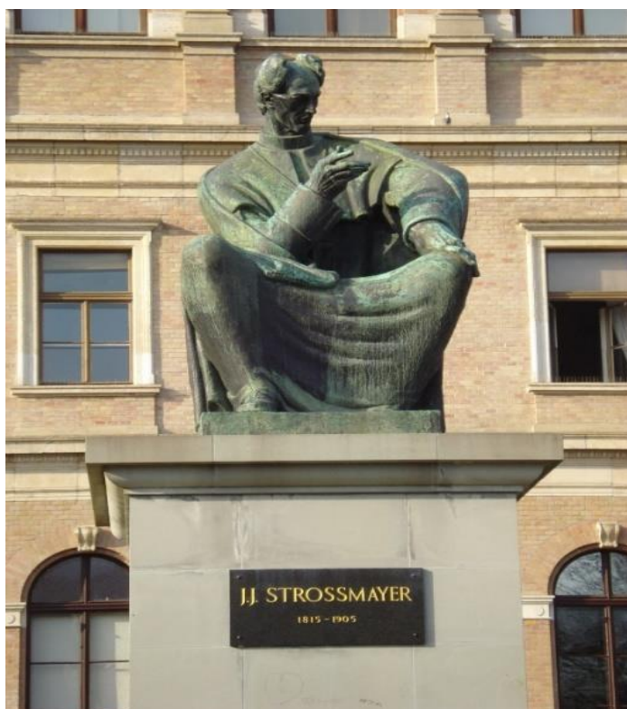
Slika 6. Spomenik Josipu Jurju Strossmayeru na Strossmayerovu trgu.