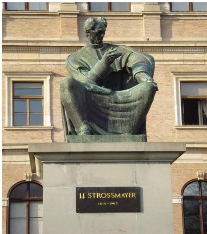
Slika 6. Spomenik Josipu Jurju Strossmayeru na Strossmayerovu trgu.