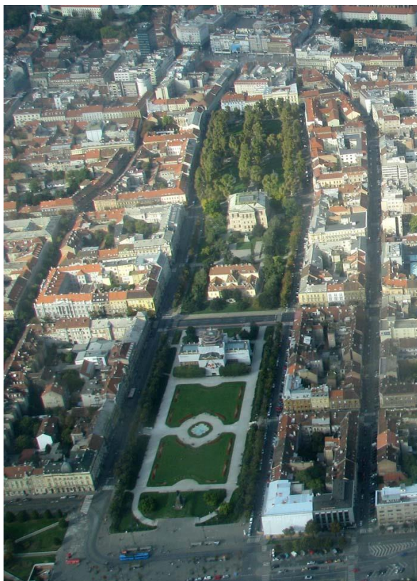
Slika 2. Istočni perivoj.

Trg Franje Josipa I. (Trg kralja Tomislava) – Na prostoru između Akademičkog trga i Kolodvora kraljevske državne ugarske željeznice (danas Glavnoga kolodvora) 1895. godine nastaje Trg Franje Josipa I., čiji je položaj uvjetovan darivanjem Umjetničkog paviljona Zagrebu (1896.) odlukom bana Khuena Héderváryja. Ova tri trga zajedno čine tzv. istočni perivoj (slike 2 i 4).