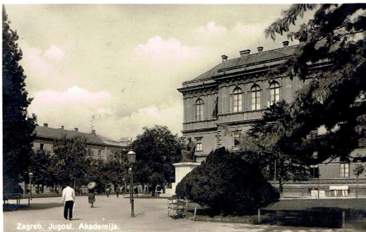
Slika 10. Pogled s istočne strane Trga na palaču HAZU-a.

kao urbanističko-arhitektonska i parkovna cjelina trgova, smatra kulturnom cjelinom te je također zaštićeno kulturno dobro.