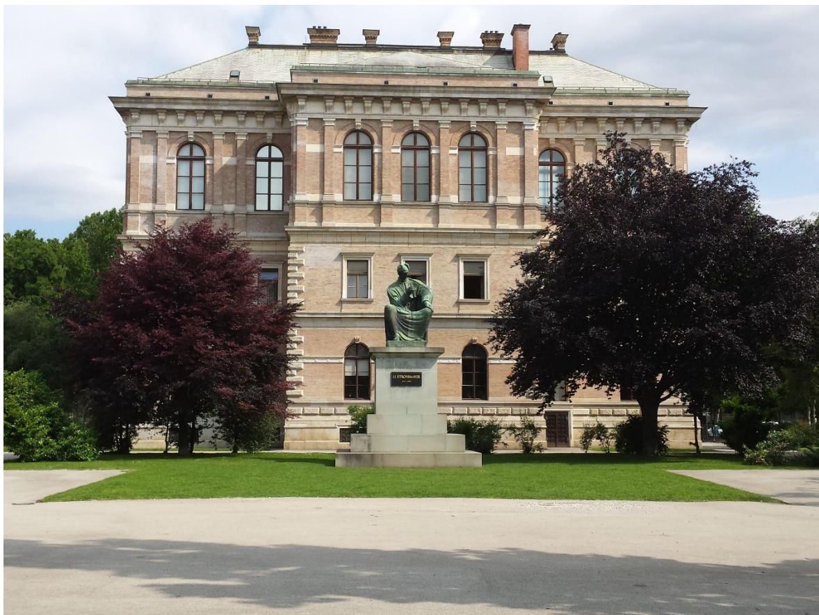
Slika 12. Pogled na palaču HAZU-a sa spomenikom Josipu Jurju Strossmayeru.