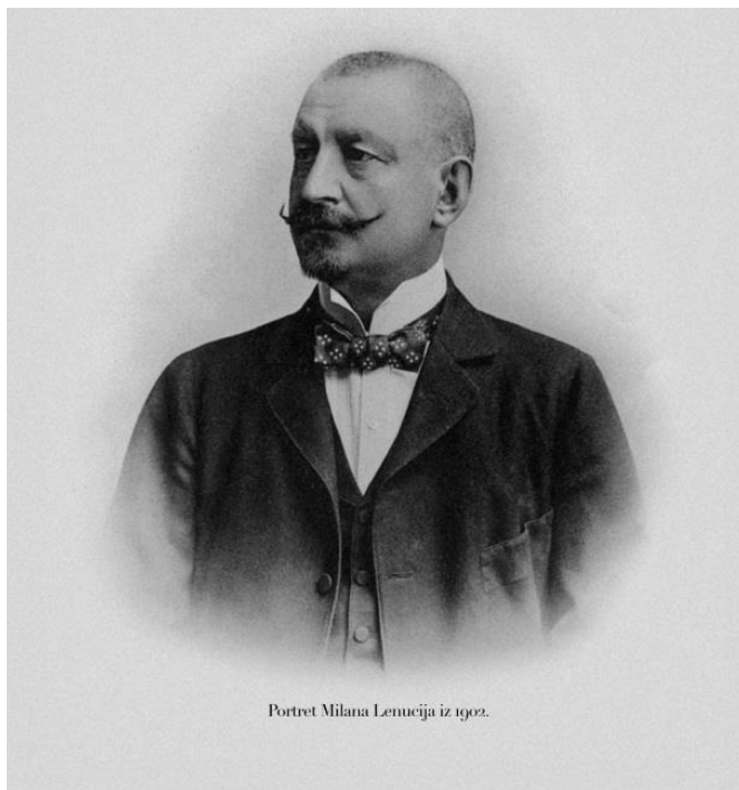
Portret Milana Lenuccija iz 1902.

Iako većina njegovih zamisli i projekata nikada nije ostvarena, barem ne u potpunosti, Milan Lenuzzi (slika 5) postavio je temelje urbanog razvoja Zagreba 20. stoljeća.