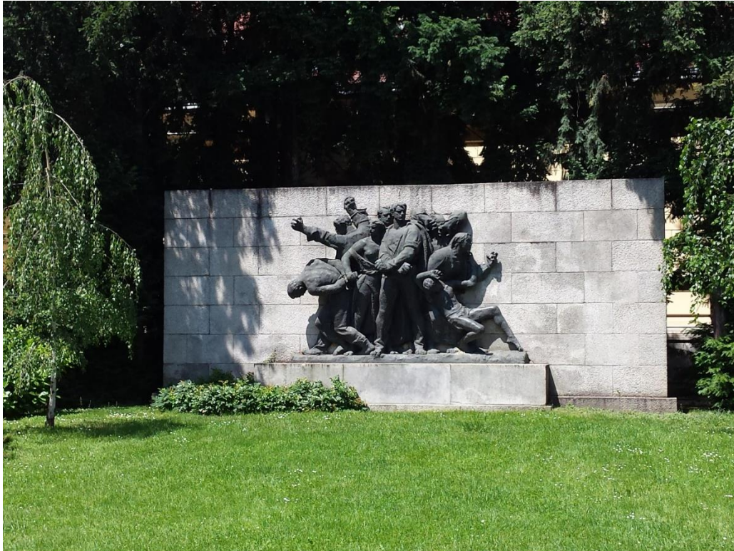
Slika 8. Spomenik Strijeljani, rad Frane Kršinića.