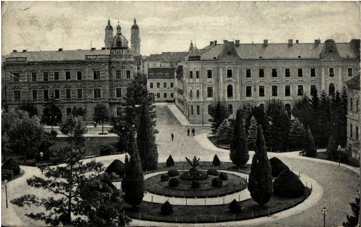
Slika 11. Nekadašnji izgled Strossmayerova trga.