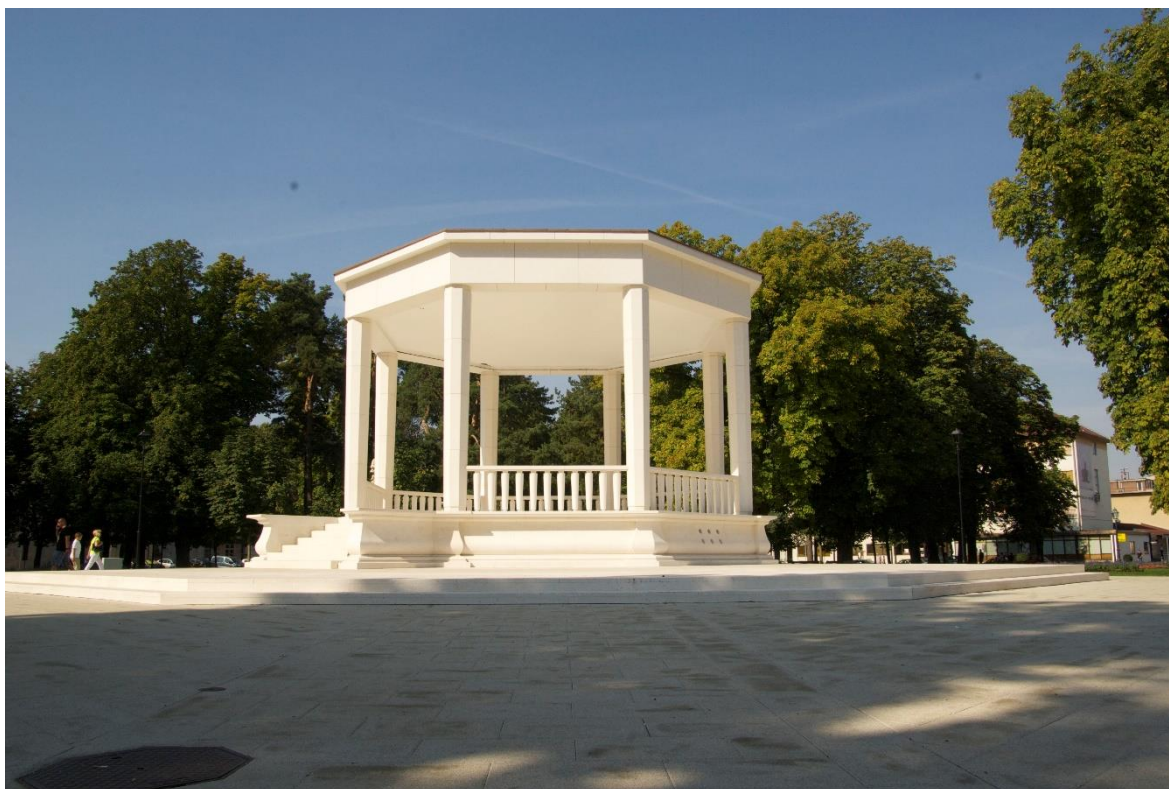
Slika 2. Glazbeni paviljon na trgu Eugena Kvaternika - prepoznatljiv simbol grada (slikano nakon obnove 2016. godine).

vježbanje vojnika i sakupljanje stoke prije tjeranja na ispašu. Oko 1883. godine trg je počeo poprimati oblik perivoja. Trg je stazama razdijeljen u četiri dijela te su 1889. godine posađena stabla divljega kestena. Neka od tih stabala zadržala su se do danas, iako nisu u najboljem zdravstvenom stanju. 1943. godine u središtu parka sagrađen je glazbeni paviljon od bijelog bračkog mramora, koji je u potpunosti obnovljen 2016. godine. Tijekom 20. stoljeća u park su unesene brojne egzotične vrste, čemu svjedoči popis vrsta iz 1977. godine koji bilježi čak 40 stranih vrsta i svega 4 autohtone.