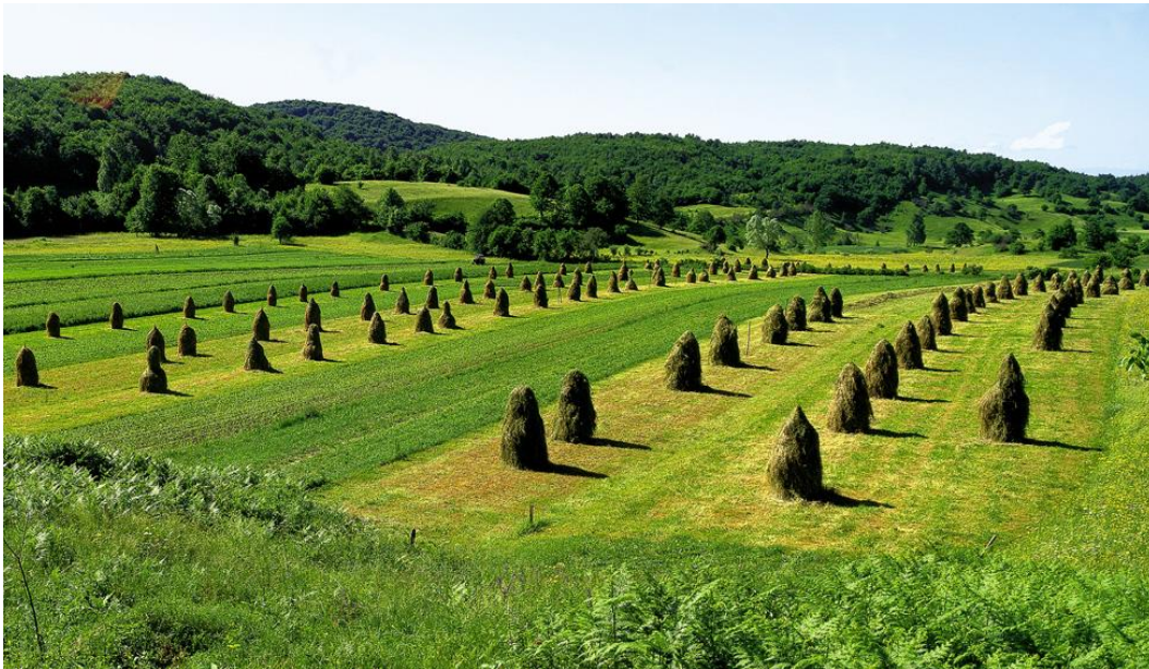
Slika 2 - Stogovi sijena na Žumberku