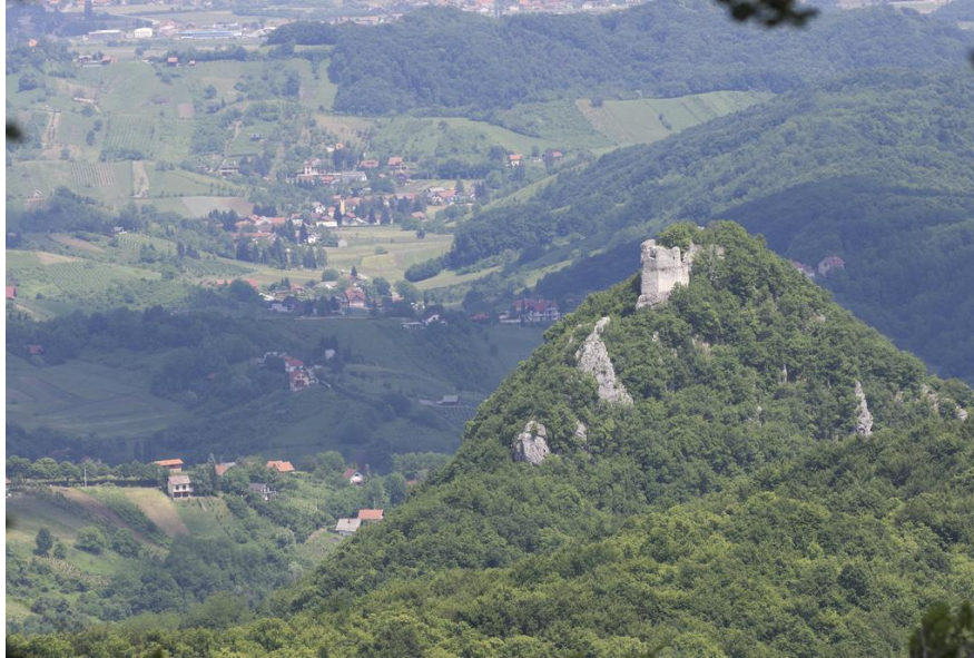
Slika 5 - Ruševine starog grada na Okiću

Plešivica – na vrhu Plešivice koja je uglavnom obrasla šumom u kojoj ima i dosta alohtone crnogorice postavljen je vidikovac (778 m.n.v.) s kojega se pruža pogled prema južnim ekspozicijama po kojima dominiraju vinogradi i mala sela. Od događaja ovdje se izdvajaju vinske svečanosti, te sanjkaški kup.