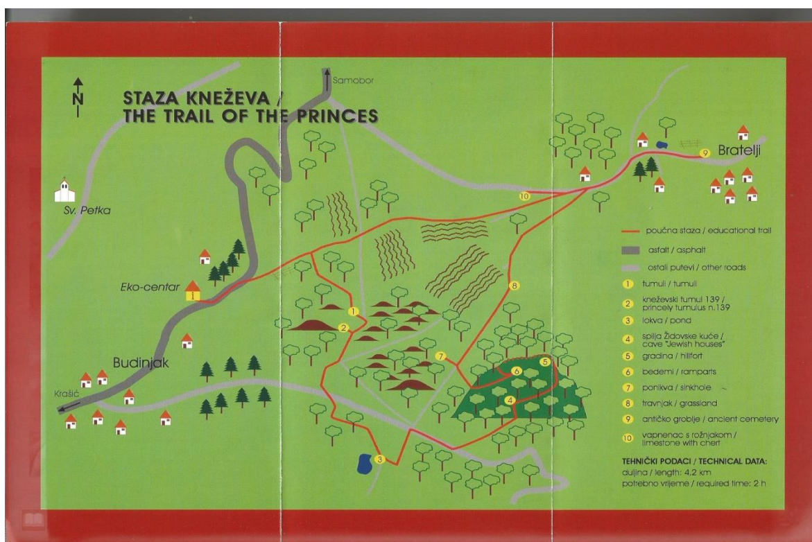
Slika 3 - tematski prikaz poučne staze "Staza kneževa"