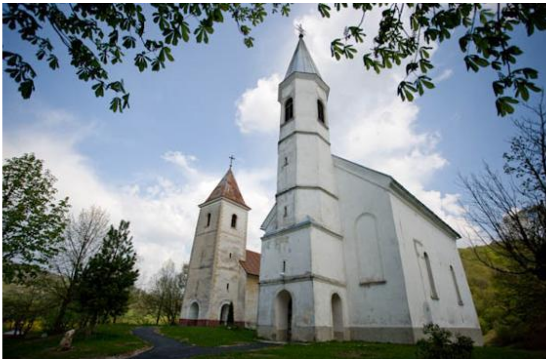
Slika 6 - grkokatolička crkva Sv. Petra i Pavla i rimokatolička kapela Uznesenja Blažene Djevice Marije u Sošićama.

poput dva plućna krila Katoličke Crkve, jedna kraj druge stoje i dvije crkve – rimokatolička kapela Uznesenja Blažene Djevice Marije s početka 19.st. i grkokatolička crkva Sv. Petra i Pavla iz 18.st.