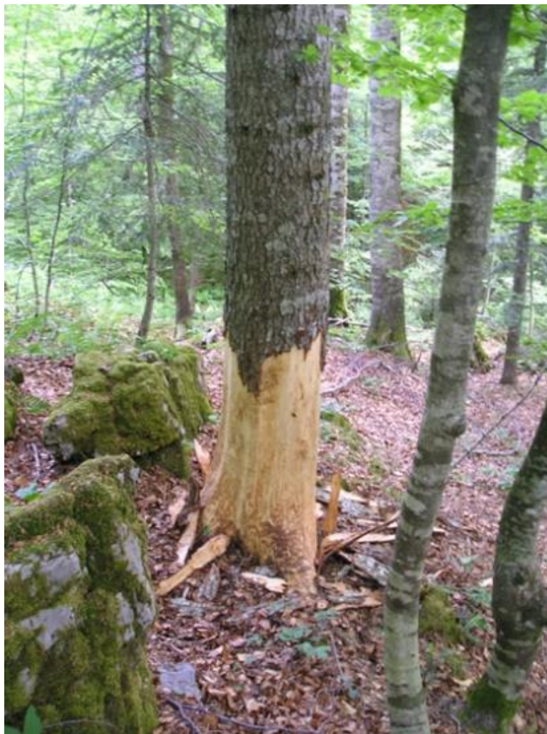
Slika 5. Šteta od medvjeda, oguljeno stablo jele

Štete u stočarstvu i pčelarstvu znatno su izraženije i upravo te štete najčešće su razlog za nastajanje sukoba između čovjeka i medvjeda. Ponekad štete čini i na krupnoj i sitnoj stoci. U zadnjih 20 – 30 godina one su izrazito manje nego prije, što je posljedica radikalnog smanjenja sezonskog istjerivanja stoke na ispašu u staništa medvjeda. Poznati su slučajevi da pojedini medvjed učestalo napada krupnu stoku ili svinje u krugu domaćinstva ili u staji. Ne nadoknađuje se šteta koju medvjed počinu na stoci na površinama na kojima je posebnim propisom zabranjen pristup i ispaša stoke. Najčešći oblik štete koju počinu medvjed jest šteta na pčelama. Na području staništa medvjeda nalazi se mnogo medonosnih biljaka, a neke pčelinje ispaše toga područja (vrijesak i 38 medun) drže se izrazito najboljim i razlog su snažnog razvoja pčelarstva na tim područjima. Također treba napomenuti da su to ekološki očuvana područja, gdje se