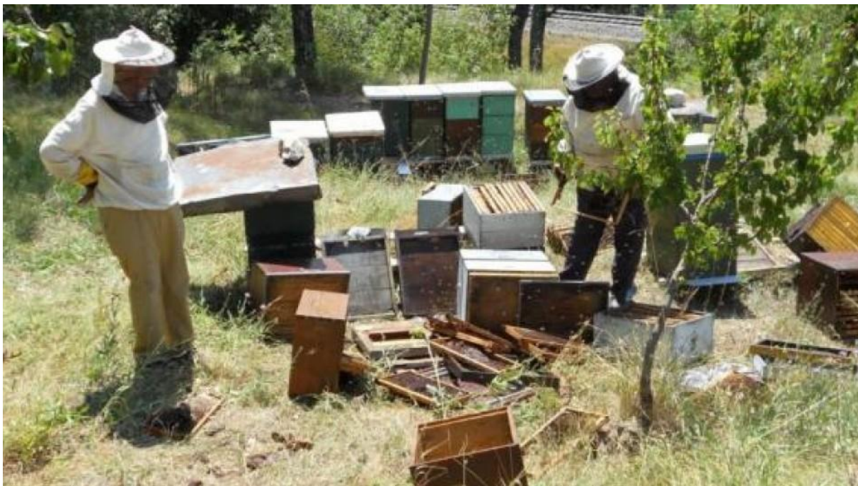
Slika 6. Štete od medvjeda u pčelarstvu

proizvodi med najviše kvalitete i gdje je pčelarstvo već sada, a u budućnosti će biti još i više, prioritetni dio razvojnih programa tih područja. Ocjenjuje se da na području staništa medvjeda stalno ili u selećem pčelarenju postoji više od 70 000 košnica.