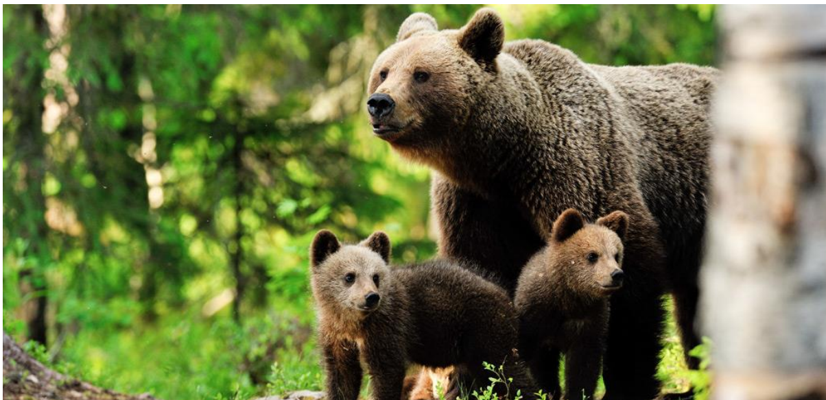
Slika 3. Ženka smeđeg medvjeda s mladuncima

Schwartz i sur. (2003.) navode da spolna aktivnost smeđeg medvjeda počinje relativno kasno, obično nakon četvrte godine života. Naši smeđi medvjedi spolno su zreli u dobi od 3 do 4 godine. Smeđi medvjed u prirodi može doživjeti 10 do 20 godina (Huber i sur., 2008.). Potraga za hranom je glavni pokretač kretanja kao i odabira staništa smeđeg medvjeda (Herrero, 1985.; Swenson, 2000.). U proljeće, smeđi medvjed svake noći traži hranu, u pravilu u područjima manje nadmorske visine i veće otvorenosti prostora s ranijom vegetacijom i proteinskom hranom, odnosno bliže ljudima, a danju se povlači u mirna i gusto obrasla područja (Huber i sur., 2008.).