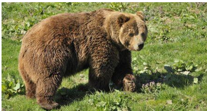
Slika1. Smeđi medvjed

Mir, dovoljne količine hrane i prostrana šumska područja tri su osnovna uvjeta za uspješan uzgoj i zaštitu medvjeda. Najbolje stanišne uvjete nalazi u preostalim mirnim oazama šireg risnjačko-snježničkog masiva na zapadu i Bjelolasice na istoku s nadmorskim visinama od 500 do 1100 metara. U potrazi za hranom i prikladnim brlogom čini opsežna horizontalna i vertikalna premještanja, boraveći tako u pojedinim lovištima duže ili kraće vrijeme. U stanju je u jednoj noći prevaliti udaljenosti i do 30 km. U proljeće biraju niža područja s ranijom vegetacijom i proteinskom hranom, dok u jesen trebaju pristup starim zrelim šumama s velikim količinama hranjivih plodova. Biljne tvari glavna su mu i osnovna hrana koja čini preko 90% svih njegovih potreba. Od hrane životinjskog podrijetla na njegovu jelovniku nađe se sve ono što može naći u šumi, od mravljih ličinki, crva, osinjih saća, puževa, sve do lešina uginulih životinja.