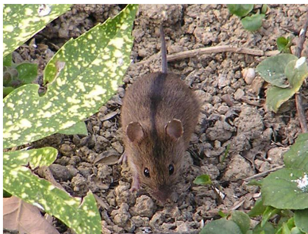
Slika 19. Prugasti poljski miš u potrazi za hranom