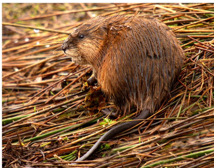
Slika 18. Bizamski štakor prilikom izlaska iz vode