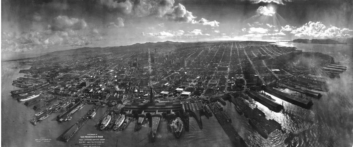
Slika 13: panoramska slika San Francisca iz 1906.g. G. R. Lawrencea

George R. Lawrence je snimio predivnu aerosnimke San Francisca prije i nakon velikog požara i potresa 1906.g. Spojio je 17 zmajeva koji su podigli tešku panoramsku kameru 600 m iznad grada. Posebnost kamere je to što je imala zaobljeni film koji je omogućio snimanje panoramskih slika.