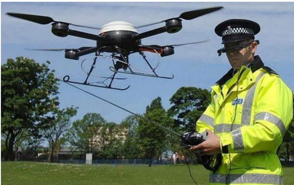
Slika 14: policijska bespilotna letjelica u Ujedinjenom Kraljevstvu

Kao što je već rečeno, njihove prednosti naspram ljudske posade u helikopteru ili manjem zrakoplovu su višestruke. Malih su dimenzija, tihe su (iznimno korisno tijekom policijske potjere), dugotrajne su i teško uočljive pogotovo u urbanom području (mnoštvo zgrada, plakata itd.).