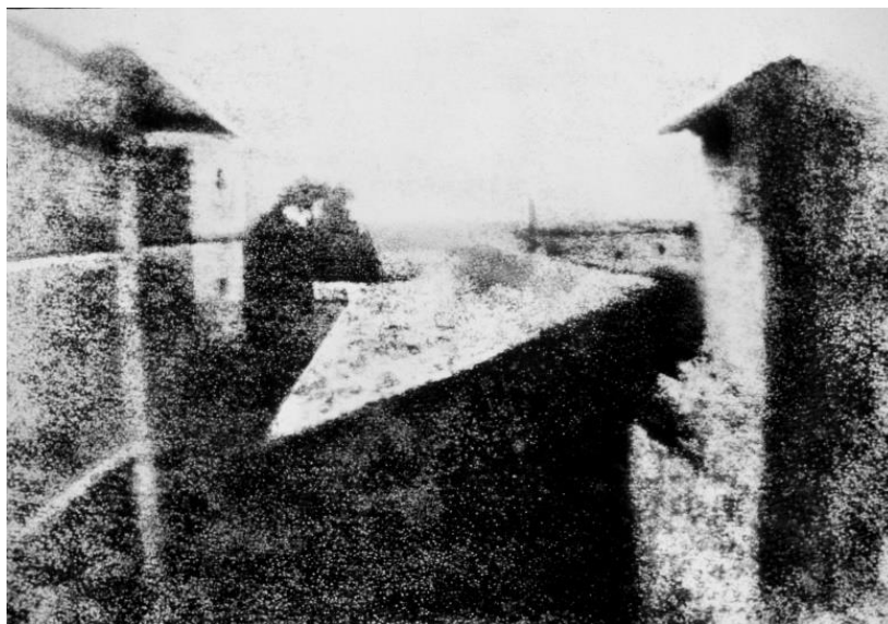
Slika 8: prva fotografija - Vue de la fenêtre à Le Gras 1826./1827.g.

Joseph Niépce i fotograf Louis Daguerre 1829.g. su surađivali na fotografskom postupku za dobivanje trajne slike. Zajedno su ga izumili, ali ga je Daguerre sam usavršio nakon raspada suradnje povodom smrti Niépcea 1833.g. Prvotna upotreba živinih para za dobivanje trajne slike se pokazalo neuspješnim, te je riješio problem pomoću otopine kuhinjske soli, kako bi se otopio neosvijetljeni srebrni jodid. Godine 1837. tom tehnikom je snimio svoj studio, "L'Atelier de l'artiste", koja je nazvana dagerotipija 3 . Patentirao ga je kao svoga jer mu je te godine Niépceov sin, Isidore prodao prava na patent.