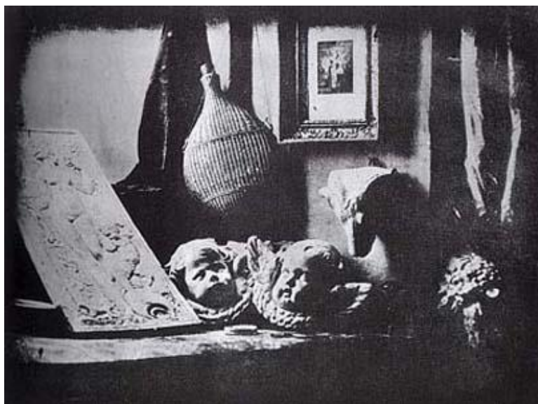
Slika 9: prva trajna fotografija 1837.g., - "L'Atelier de l'artiste"

Nakon otkrića, dagerotipija je postala veliki hit, te se počela masovno proizvoditi. O popularnosti dagerotipije govori činjenica da se samo nakon četiri tjedna otkrića već počeo proizvoditi u SAD-u.