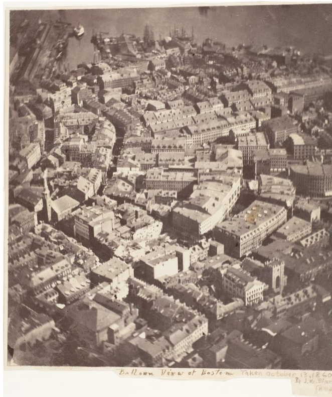
Slika 11 J.W. Black - najstarija očuvana aerosnimka pod nazivom - "Boston, as the Eagle and the Wild Goose See It" iz 1860.g.

Otac fotografije sa zmaja, Arthur Batut je 1889.g. pričvrstio kameru za zmaj i načinio prvu aerosnimku pomoću zmaja iznad Labruguierea u Fancuskoj. Kamera je pričvršćena direktno na zmaj, imala je visinomjer koji je očitavao visinunna filmu čime je omogućeno skaliranje slike