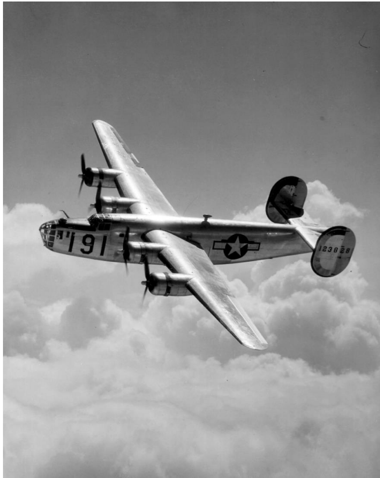
Slika 3: bomber B-24 korišten tijekom II. svjetskog rata

Unaprjeđenje radio-daljinsko kontroliranih aviona (bespilotnih letjelica) ostvario je Edward M. Sorensen. Omogućio je kontroliranje aviona na udaljenostima daljim od vidnog polja pilota koji njime upravlja. Time je omogućen daljnji razvoj radio kontroliranih aviona sve do modernih bespilotnih letjelica, tj dronova koji danas prelaze i tisuće kilometara do mete.