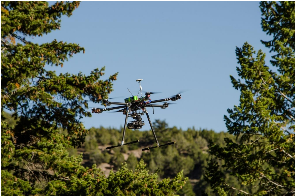
Slika 18: primjena bespilotne letjelice u šumi

Neke od ilegalnih aktivnosti su: sječa i odvoz drvne mase, skupljanje zaštićenih i ugroženih gljiva i biljaka, krivolov (kopneni i riječni), odlaganje otpada, podmetanje požara itd. Kod provođenja tih aktivnosti, bespilotne letjelice putem radijske frekvencije, izravnim putem ili preko satelita odašilju podatke koji se onda prosljeđuju nadležnim ustanovama te se kreće u akciju saniranja štete i traženja krivca.