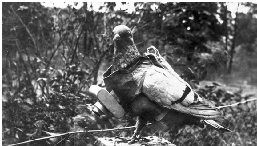
Slika 12: Neubronnerova kamera na golubu

1903.g. u Bavarskoj je prvi puta prezentirano korištenje golubova u snimanju aerosnimaka. Julius Neubronner je patentirao malu kamericu od 70 grama, koja je snimala svakih 30 sekundi. Kamera bi se montirala da golublja prsa te bi bili pušteni, iako su bili brži od balona, bili su i nepouzdaniji.