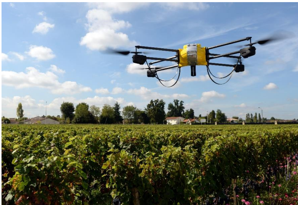
Slika 17: primjena bespilotne letjelice u agrikulturi