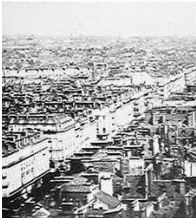
Slika 10: najstarija Nadarova očuvana fotografija Pariza iz 1866.g.

Najstarija poznata aerosnimka nastala 1860.g. iznad grada Bostona iz balona na vrući zrak, Jamesa Wallacea Blacka. To je prva aerosnimka koja bistro prikazuje neki grad bilogdje u svijetu. Te je prvi puta fotografija korištena u vojne svrhe tijekom Građanskog rata.