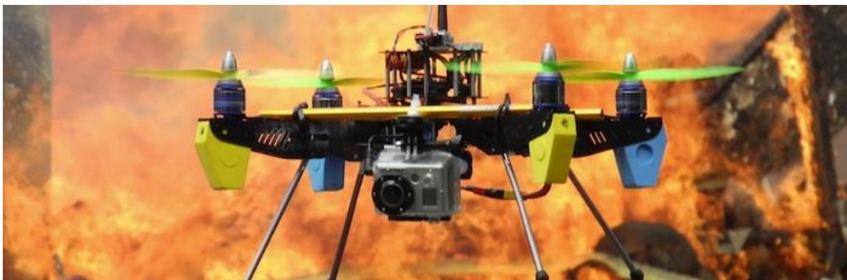
Slika 15: vatrogasna bespilotna letjelica