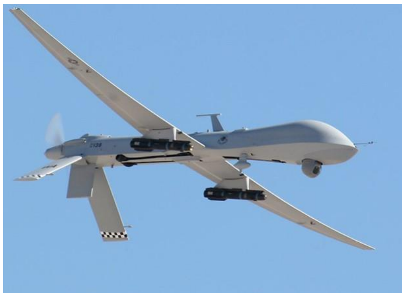
Slika 16: bespilotna letjelica korištena za detektiranje imigranata i zaštite granica

Praćenje obala u početku je bilo bitno zbog praćenja stanja okoliša obale. Danas se upotreba bespilotnih letjelica bazira na čuvanju morskih granica, pogotovo u državama poželjnim imigrantima. Bespilotnim letjelicama se uvelike smanjuje potreba za ljudstvom, nije potrebno toliko patrolnih brodova na granicama, te se troši manje sredstava iz proračuna koja se mogu iskoristiti u neke druge svrhe. Pomoću letjelica prate se nelegalne imigracije i obavještavaju nadležne u slučaju nesreće.