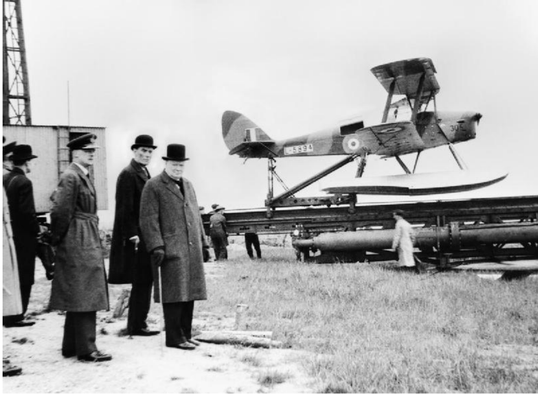
Slika 2: W. Churchill i tajnik ministarstva obrane čekaju lansiranje "Queen Bee-a" 1941.g.

Tijekom II. svjetskog rata dogodio se neuspjeli pokušaj daljinskog upravljanja aviona. Američka mornarica pokrenula operaciju Anvil za otkrivanje nacističkih bunkera korištenjem modificiranih B-24 aviona, tj. bomblera. Bili su ispunjeni eksplozivom i navođeni daljinskim upravljanjem sve do meta u Njemačkoj i Francuskoj. No budući da je i dalje daljinsko upravljanje bilo limitirano te su zapravo piloti morali upravljati avionima do Engleske gdje bi iz aviona izlazili padobranima, te bi do mete bili navođeni. Ta operacija je ubrzo ukinuta zbog pogibelji pilota i srušenih aviona.