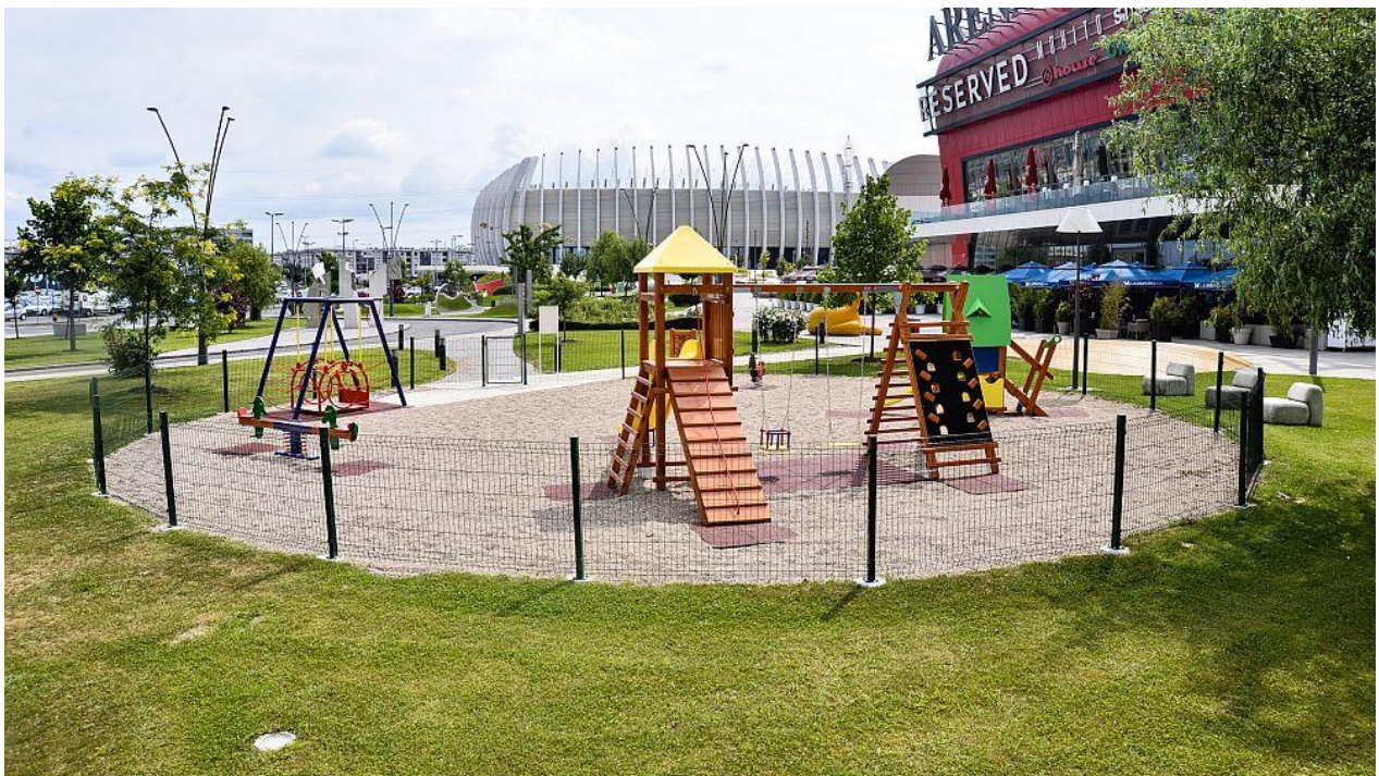
Slika 13. Dječje igralište u sklopu Arena Centra.

Ovo igralište također ostavlja estetski dojam i privlači djecu svojim živim bojama, raznim i neobičnim kombinacijama sprava.