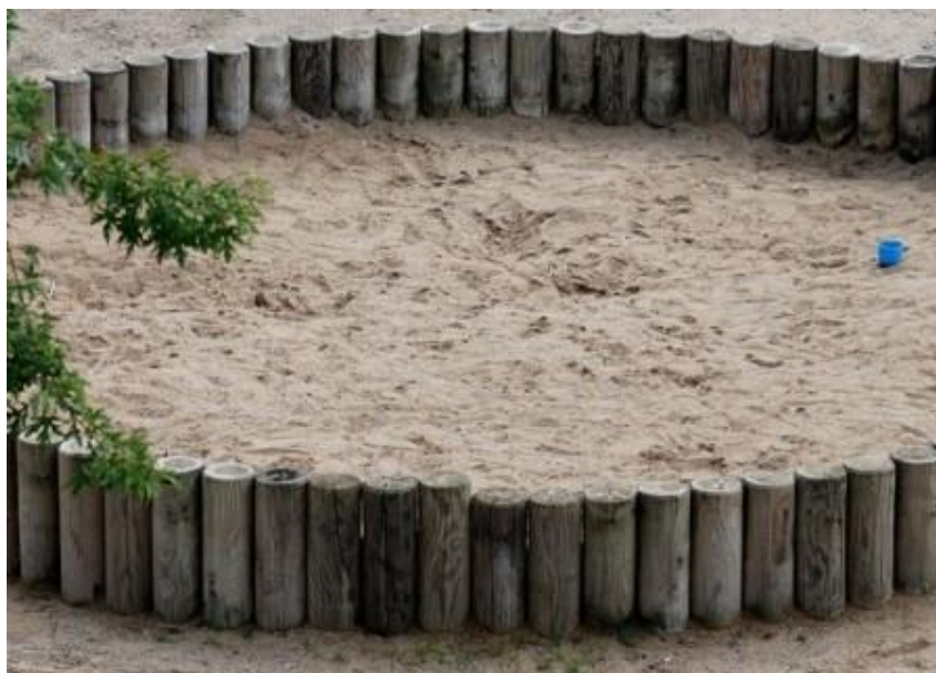
Slika 4. Pješčanik u dječjem igralištu.