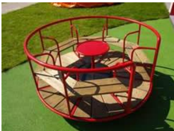
Slika 8. Vrtuljak.