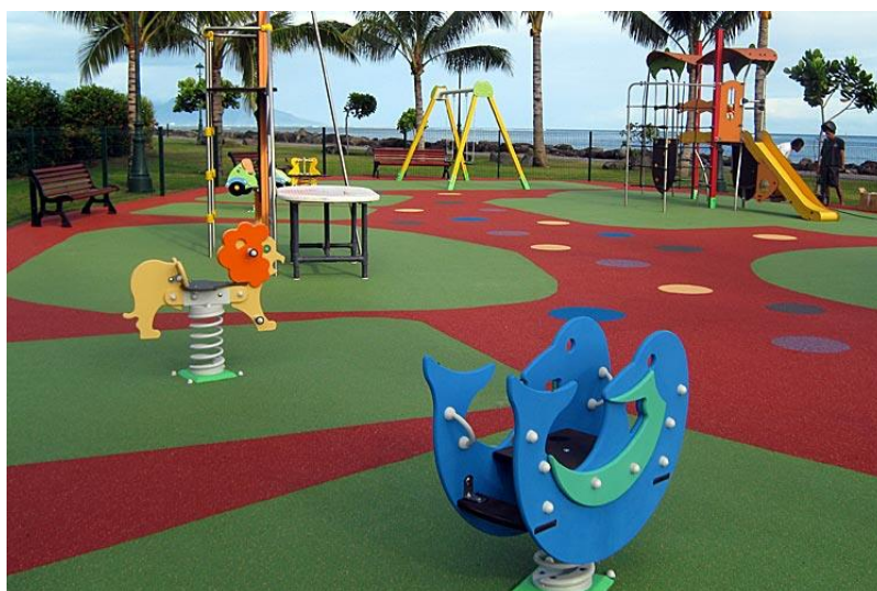
Slika 3. Primjer anti-stres podloge u dječjem igralištu.