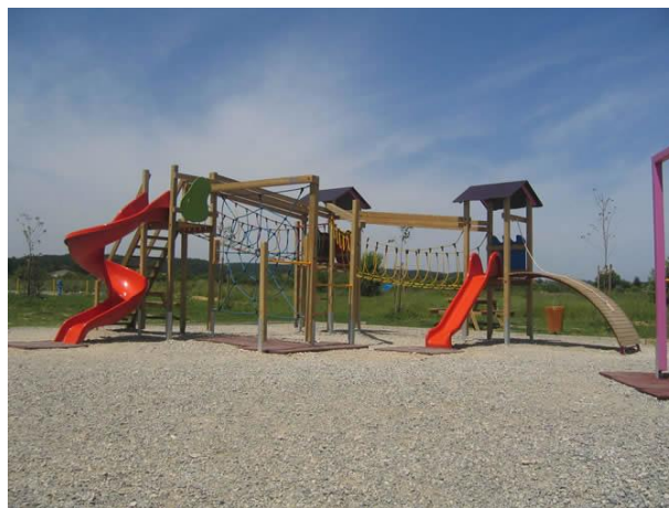
Slika 1. Primjer šljunčane podloge u dječjem igralištu.

Šljunčane i travnate podloge potrebno je češće održavati pa su gumene podloge dugoročno gledano puno isplativije s obzirom da su dugotrajnije, vodonepropusne, jednostavne za održavanje i korištenje, a daju i atraktivniji izgled igralištu.