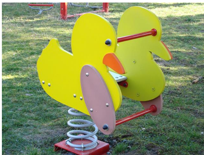
Slika 7. Njihalica na opruzi.