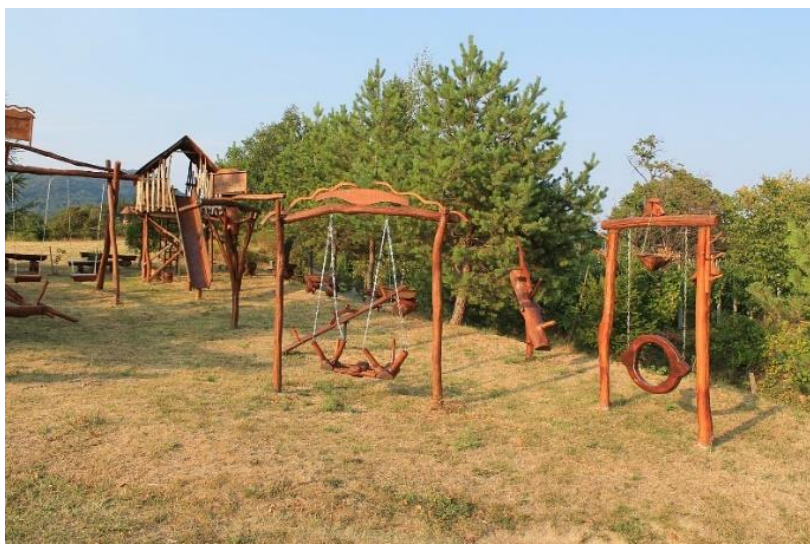
Slika 2. Primjer travnate podloge u dječjem igralištu.