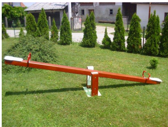
Slika 9. Klackalica.