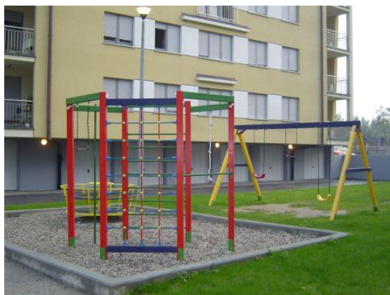
Slika 10. Penjalica