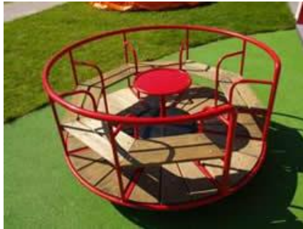
Slika 8. Vrtuljak.