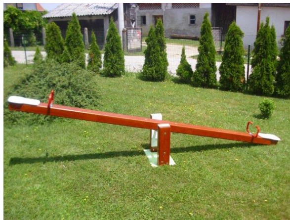
Slika 9. Klackalica.