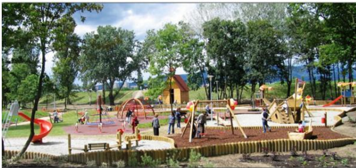
Slika 12. Dječje igralište u sklopu parka Bundek.

Kombinacijom različitih materijala, boja i oblika park ostavlja snažan estetski dojam.