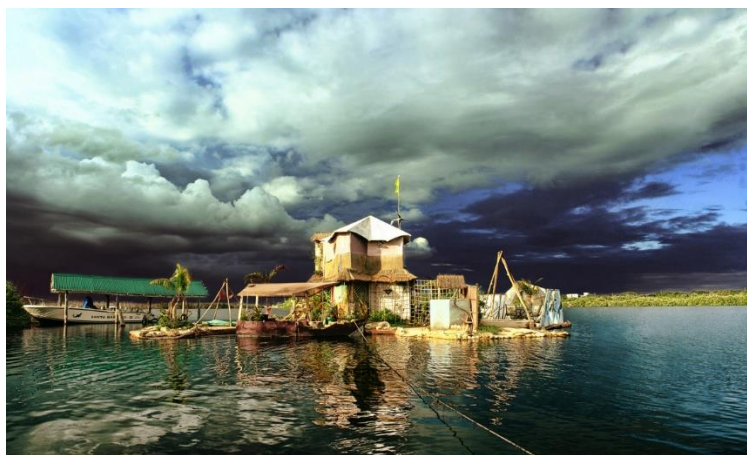
Slika 6. Spiralni otok Richarda Sowe.

Otok predstavlja jedinstveni eko projekt jer je u potpunosti izgrađen od materijala koji se mogu reciklirati, ali i pravi turističku atrakciju jer je otvoren za posjetitelje.