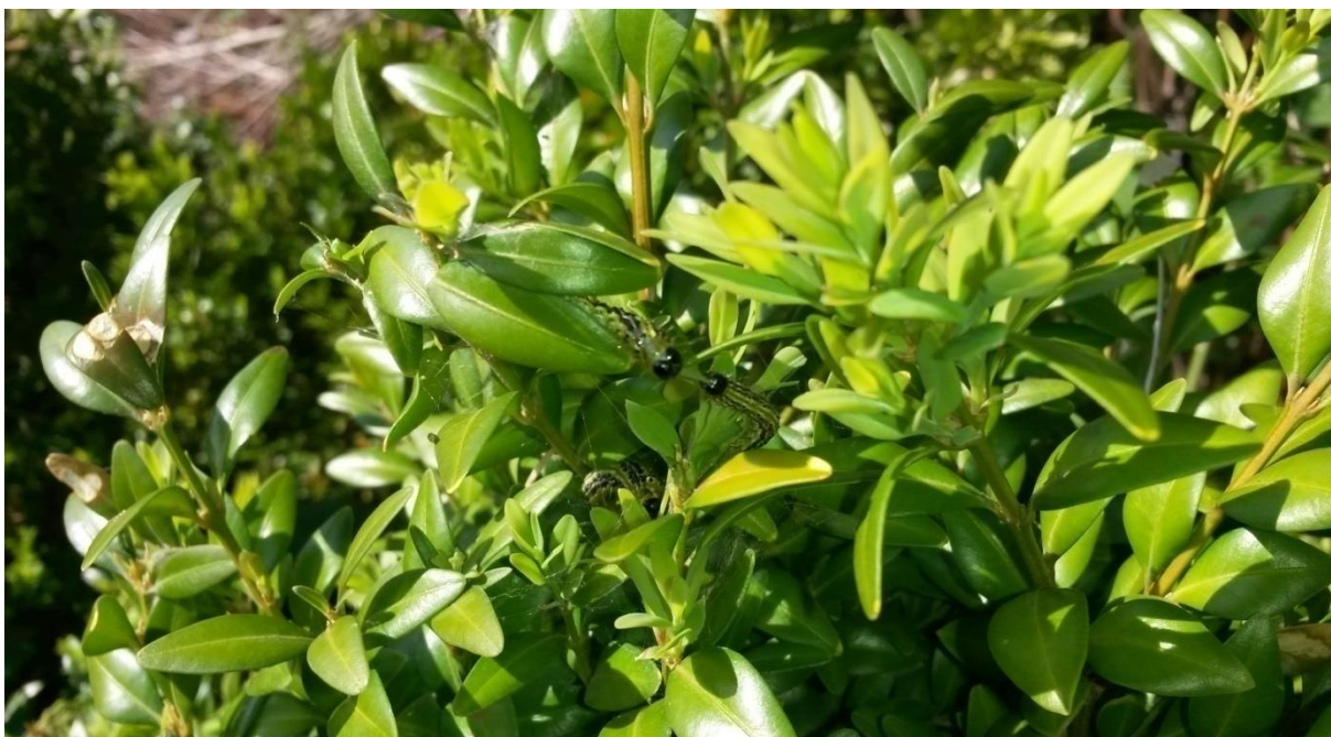
Slika 13. Gusjenice koje su započele sa „žderanjem listova“ do adultnog stadija tj. stadija leptira