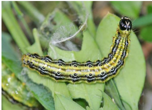
Slika 1. Gusjenica šimširovog moljca

Razmnožavanje šimširovog moljca započinje tako što leptir odlaže jaja s donje strane šimširovog lista u skupinama od 5 do 20 jajašca prekrivenih prozirnomo opnom. Na početku su jajašca blijedo žute boje, dok su kasnije vidljive smeđe glave ličinki. Mlade gusjenice su zeleno-žute boje sa crnom glavom. Kada dosegnu svoju punu veličinu riječ je o odraslim gusjenicama koje su zelene i imaju karakteristične debele crne i tanke bijele pruge po sebi sa crnim točkama na leđnoj strani te su dugačke do četiri centimetara. Mlade gusjenice najprije oštećuju epidermu (kožicu) lista i dosta se teško zamjećuju. Sakrivene su s donje strane lista u paučini. Nakon što narastu počinju proždirati cijele listove od kojih ostaju samo gole grane obavijene paučinom. Razvoj ličinke traje 17 do 87 dana, ovisno o temperaturi, dok je laboratorijski uzgoj europske populacije ove jedinke pokazao kako odrasle jedinke mogu živjeti i do dva tjedna (Leuthardt,2013).