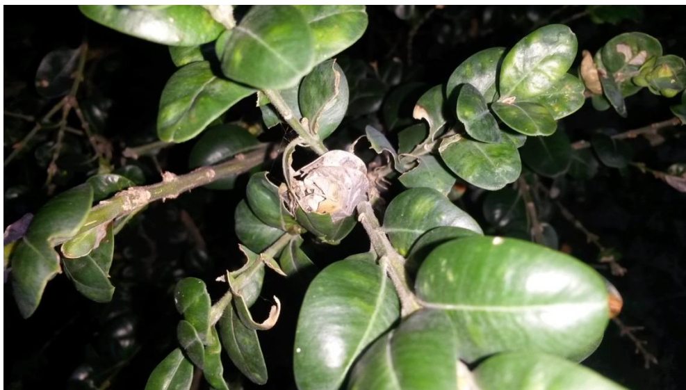
Slika 8. Izbojak šimšira na kojem su nađene gusjenice u stanju mirovanja

Na slici 7. je vidljivo oštećenje šimšira koje nam prikazuje da je grm već napadnut jednom generacijom moljca koja je uspjela obrstiti lišće sa izbojaka, ali se grm donekle uspeo oporaviti tj. novi listovi su niknuli na vrhovima izbojaka, ali su donje grane tj. stariji izbojci ostali obršteni sa lišćem pa je narušen estetski izgled biljke.