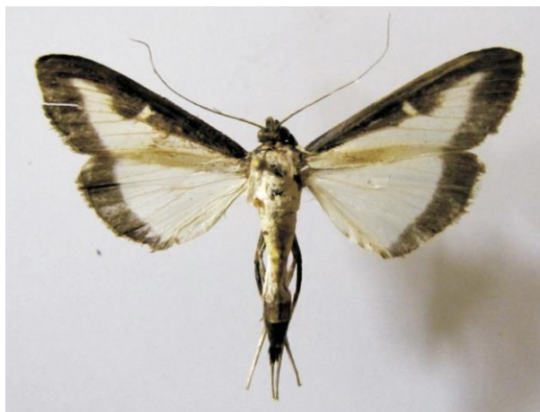
Slika 3. Leptir šimširovog moljca

Leptiri šimširovog moljca imaju raspon krila oko četiri centimetara. Imaju dugačka ticala te bjelkasta krila sa smeđim rubom.