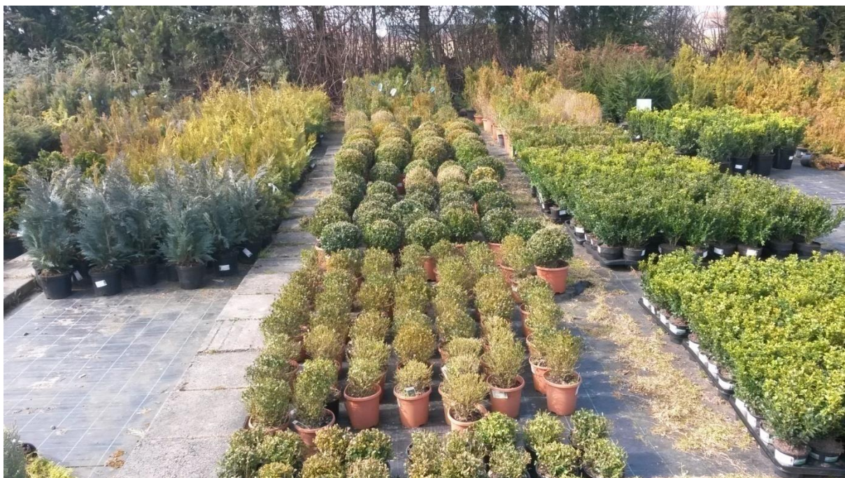
Slika 6. Sadnice šimšira ( Buxus sempervirens ) u vrtnom centru Mbm Lučko