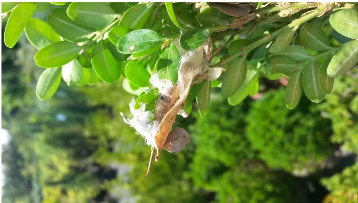
Slika 14. Napuštena kukuljica, imaga šimširovog moljca vani u stadiju leptira