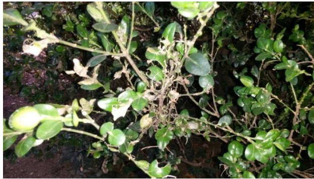
Slika 7. Oštećeni grm šimšira pored zgrade HNK u Zagrebu

Proučavajući biologiju šimširovog moljca ( C. perspectalis ), prikupljen je značajan broj podataka i rezultata koji sljede u nastavku sa opisima i slikama. Na grmu šimšira ( Buxus sempervirens ) pored zgrade HNK u Zagrebu uočeni su prvi znakovi pojave šimširovog moljca.