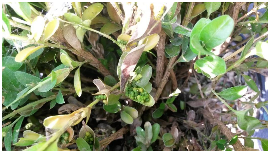
Slika 17. Odbačeni ekskrementi od gusjenica šimširovog moljca