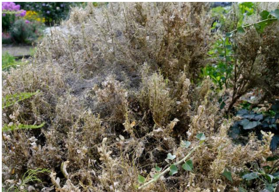
Slika 4. Obršten grm prekriven svilenastim nitima

Šimširov moljac uzrokuje značajne štete na biljkama. Dok se mlade gusjenice hrane samo gornjom stranom lista, starije gusjenice žderu lišće, zelene izbojke i koru što narušava estetski izgled biljke, uzrokuje potpuni gubitak listova i ugibanje mladih biljaka. U nekim europskim zemljama ovaj je štetnik uzrokovao značajno ugibanje šimšira u vrtovima, parkovima i šumama. Štetnik se može prepoznati po svilenkastim zaprecima i svilenim nitima (paučini) na šimširu, kod jakog napada njima je prekrivena cijela biljka koja je ostala bez lista. S obzirom da se mlade gusjenice zadržavaju u unutrašnjosti biljaka šimšira gdje su dobro zaštićene, štete se često dosta kasno primjećuju. Kada dođu do vanjskih dijelova biljke štete su vidljive no tada je najčešće već prekasno jer je došlo do gubitka skoro svih listova. Savjetuje se kontrolirati biljke razmicanjem grana i praćenjem unutrašnjosti jer su tu vidljive prve štete i mlade gusjenice.