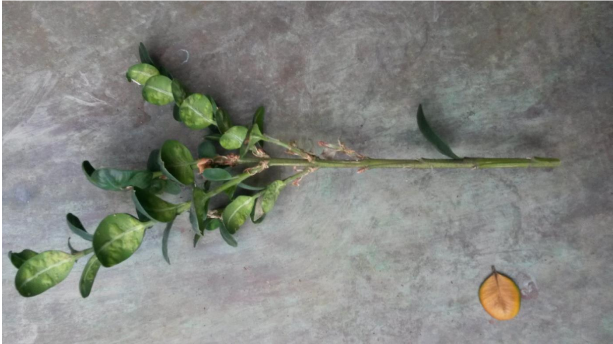
Slika 9. Izbojak šimšira sa simptomima napada dva štetnika ( Monarthropalus buxi ) te

Na slici 8. je vidljiv izbojak na kojemu se između dva obrštena lista u „paučini“ u obliku svilenih niti nalazi gusjenica, te je taj izbojak odnešen na promatranje u entomološki laboratorij na Šumarski fakultet u Zagrebu, kako bi se promatralo razdoblje mirovanja gusjenice, te kada će početi sa novim napadom odnosno hranjenjem sa lišćem.