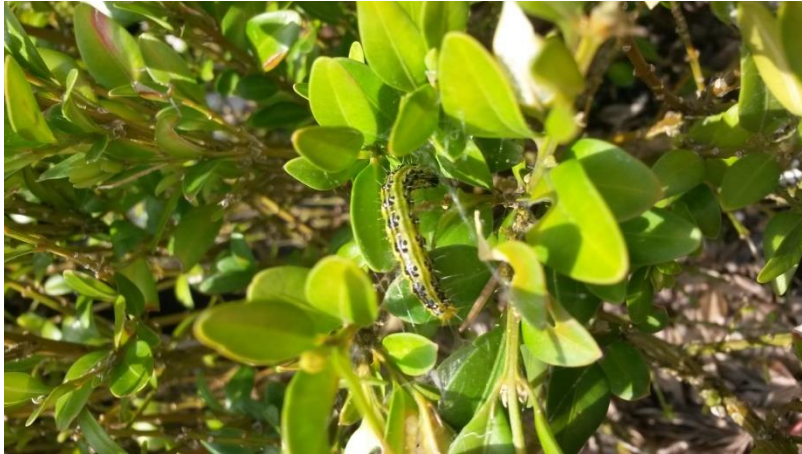
Slika 15. Odrasla gusjenica šimširovog moljca