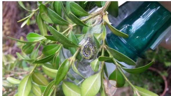
Slika 16. Priprema za kukuljenje

Krajem travnja primjećuje se polagano zavlačenje gusjenica u unutrašnjost sadnica, te omotavanje sa svilenastim nitima tj. paučinom, što označava pripremu za kukuljenje, a vidljivo je na slici ispod.