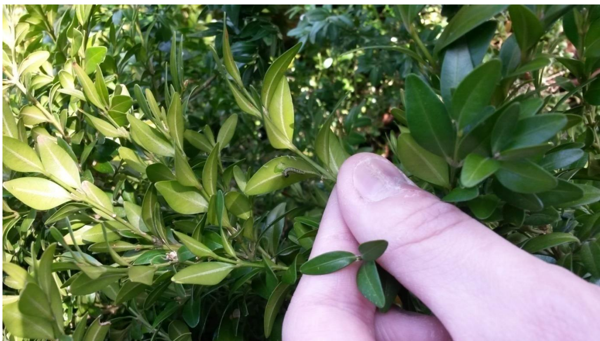
Slika 11. Gusjenica šimširovog moljca na listu

Sadnice koje su prikazane na slici su već zahvaćene prošlogodišnjim napadom šimširovog moljca koji je u stadiju mirovanja, te se nove štete očekuju.