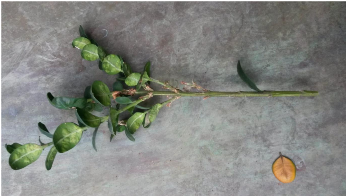
Slika 9. Izbojak šimšira sa simptomima napada dva štetnika ( Monarthropalpus buxi ) te

Na slici 8. je vidljiv izbojak na kojemu se između dva obrštena lista u „paučini“ u obliku svilenih niti nalazi gusjenica, te je taj izbojak odnešen na promatranje u entomološki laboratorij na Šumarski fakultet u Zagrebu, kako bi se promatralo razdoblje mirovanja gusjenice, te kada će početi sa novim napadom odnosno hranjenjem sa lišćem.