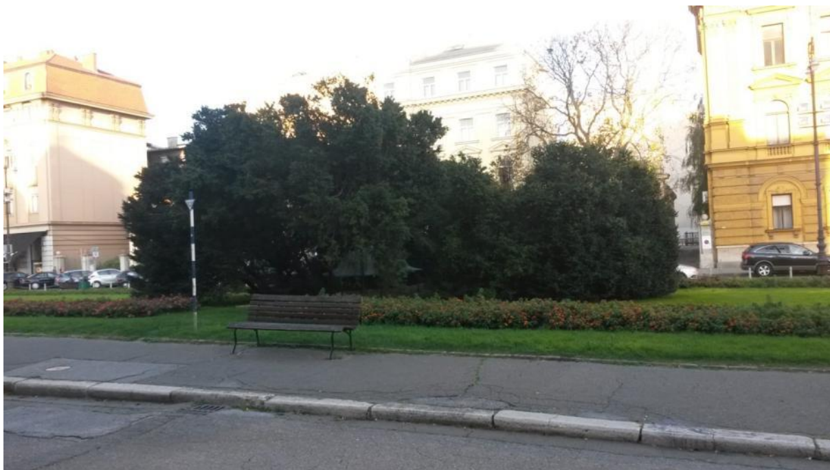
Slika 5. Grm šimšira ( Buxus sempervirens ) pokraj zgrade HNK u Zagrebu