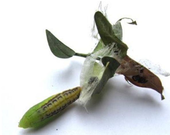
Slika 2. Kukuljica i svilenkasti zapredak šimširovog moljca

Kukuljice šimširovog moljca dugačke su u prosjeku dva centimetara, smeđe su boje te su skrivene u kokonu sačinjenom od svilenih niti između listova i grančica šimšira.