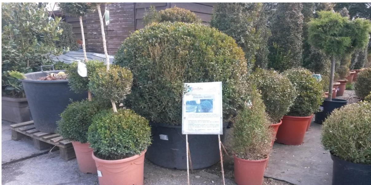
Slika 10. Sadnice šimšira u vrtnom centru Mbm Lučko