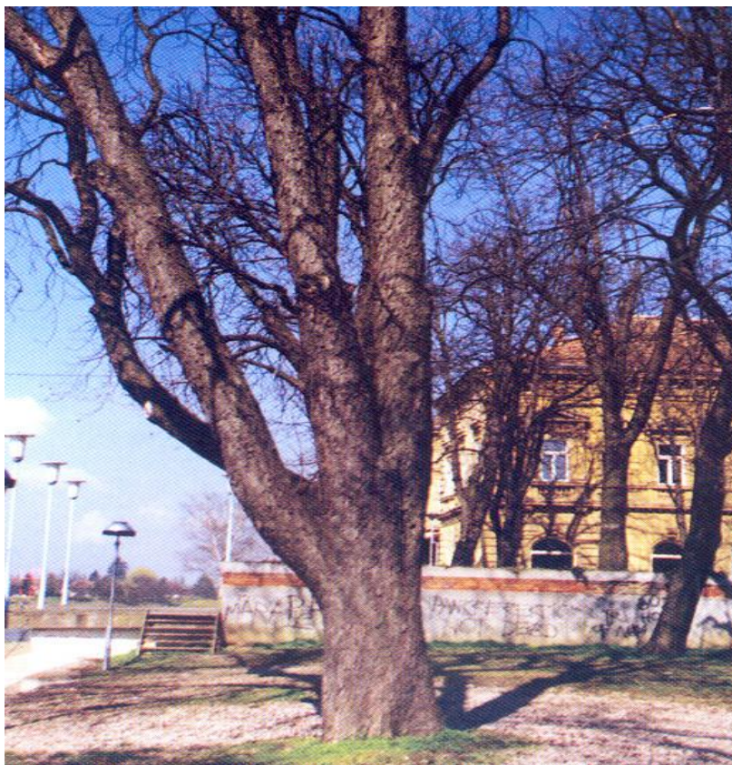
Slika 12. Stablo divljeg kestena iz drvoreda na sisačkoj šetnici