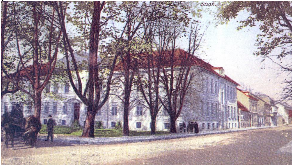
Slika 7. Trg s početka 20.stoljeća