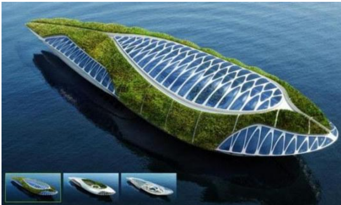
Slika 7. Izgled Physalie izvana

Vire i ispod vodenog vrta, bit e vatreni vrt za namjenske/posve ene izložbe i gdje posjetitelji mogu gledati okolinu rijeke kroz podvodne prozore. Na kraju, amfiteatar zra nog vrta uklju ivat e sastanke i prostor za konferencije. (Callebaut Vincent, web 12.)