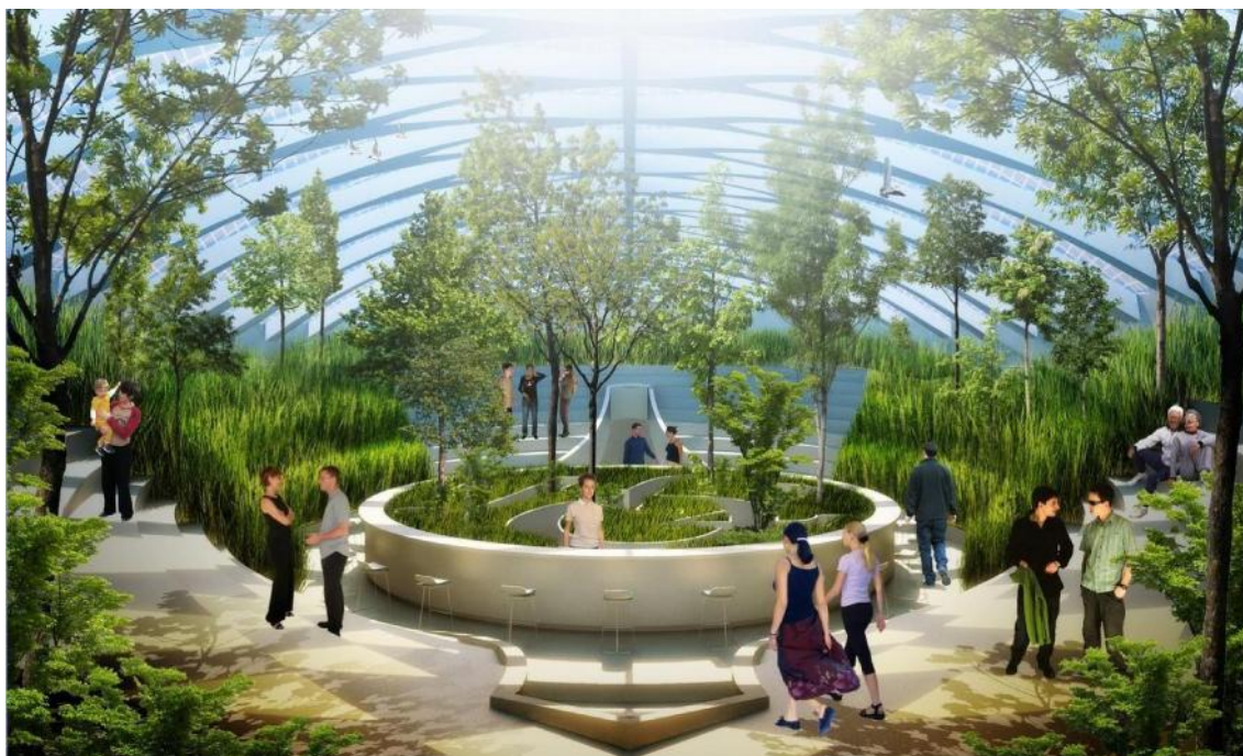
Slika 10. Prikaz unutrašnjosti Zračnog vrta