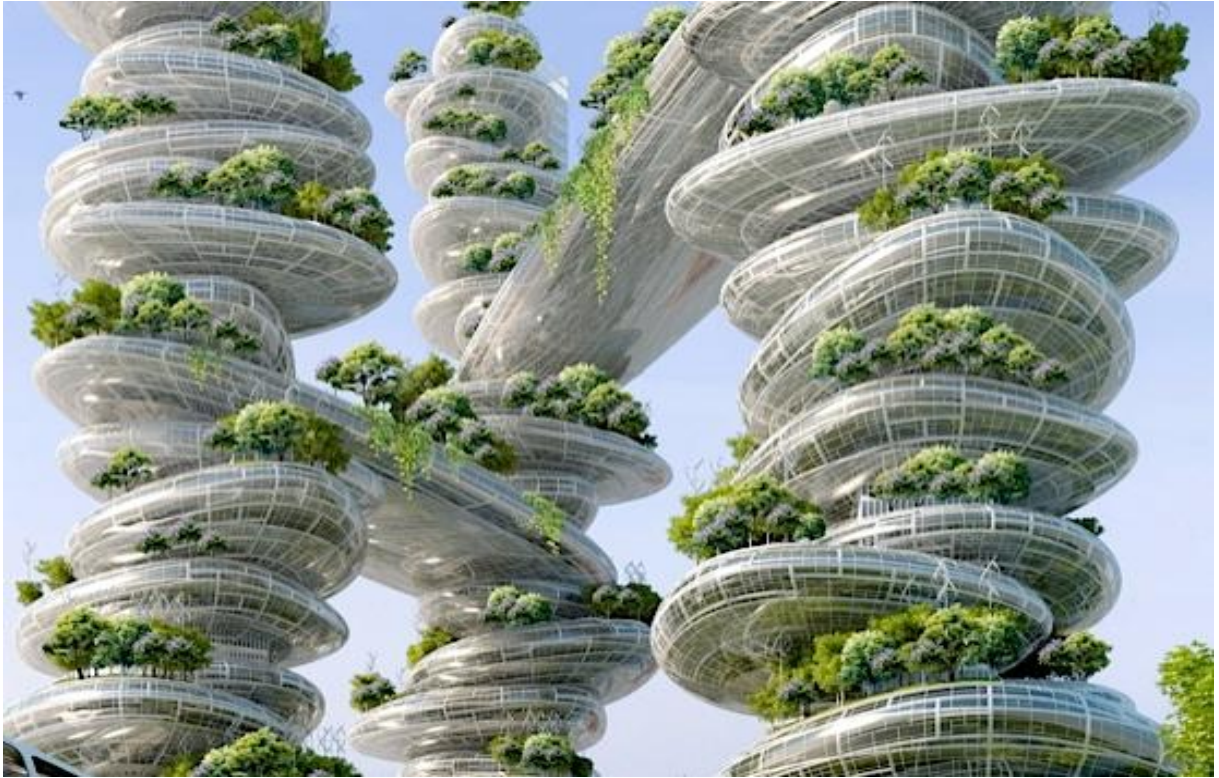
Slika 4. Toranj za uzgoj voćnica i povrća