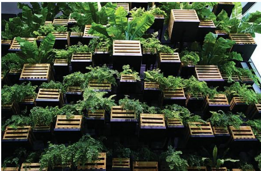
Slika 2. Primjer suvremenog vertikalnog vrta

Vrijednost vertikalnih vrtova je već bila prepoznata u antičko doba u Babilonu, poznati kao Vise i vrtovi. Vrtovi su pogrešno nazvani vise ima, zapravo su zasadeni na više razina ili terasa. Za takve vrtove su Rimljani koristili vinovu lozu i ruže penjačice kako bi ih ozelenili. Danas vertikalni vrtovi imaju ekonomsku, ekološku i estetsku važnost. (Green roof organization, 2008)