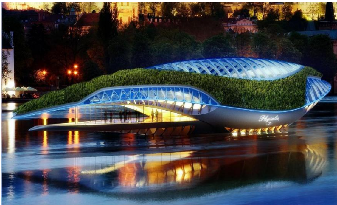
Slika 8. Physalia nave er