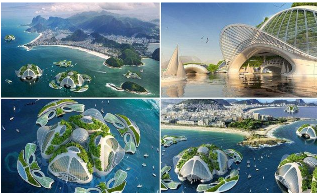
Slika 5. Aequorea

proteinima i vitaminima. Koraljni grebeni na balkonima e biti uzgajalište za vodene flore i faune. Sva hrana e se mo i višekratno koristiti i distribuirati u biorazgradivim kontejnerima. Kretanje uokolo e biti mogu e brodom ili podmornicom zahvaljuju i gorivu algi ili ugljikovodicima koji se proizvode bez emisije stakleni kih plinova. (Callebaut Vincent, web 9.)