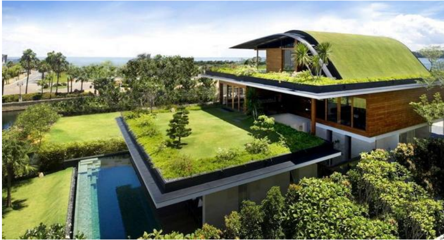
Slika 1. Primjer zelenog krova