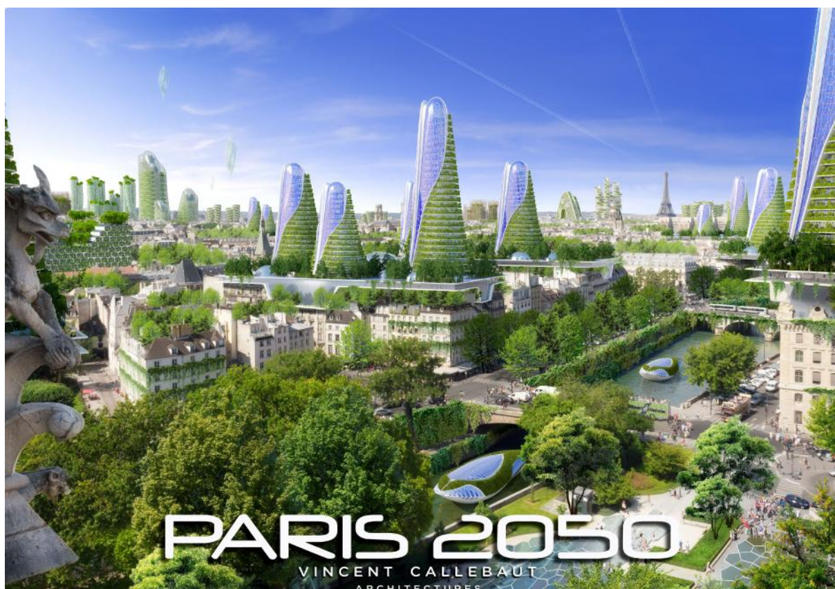
Slika 3. Panorama Pariza 2050

strane, "Kule fotosinteze" bi bile prekrivene izolacijskim bio-materijalima, koji bi proizvodili vlastito bio-gorivo. Hibridni sistem turbina - "Phylolight" nova je tehnologija pomoću koje bi se osiguralo i osvjetljenje i energija neophodna za njegovu proizvodnju. Tornjevi poput mosta „Bridge toranj“ su građevine sa dva mosta poprijeko Seine koji proizvode energiju koriste i kinetičku energiju dobivenu radom vjetrenjača i vodenica na Seini. „Planina toranj“ se zove tako jer ima funkciju da solarno, hidrodinamički i biljkama zasadi na njemu sprečava pojavu da je temperatura grada u centru veća za nekoliko stupnjeva od temperature na periferiji grada. Ta pojava je poznata pod terminom „gradski vrući i otok“. Svaki toranj ima svoju namjenu, tako uz navedene postoji i toranj koji smanjuje štetan utjecaj ispušnih plinova te toranj za uzgoj povrća i voća. (Callebaut V., Fertile cities, 2014.-2015. i web 6.)