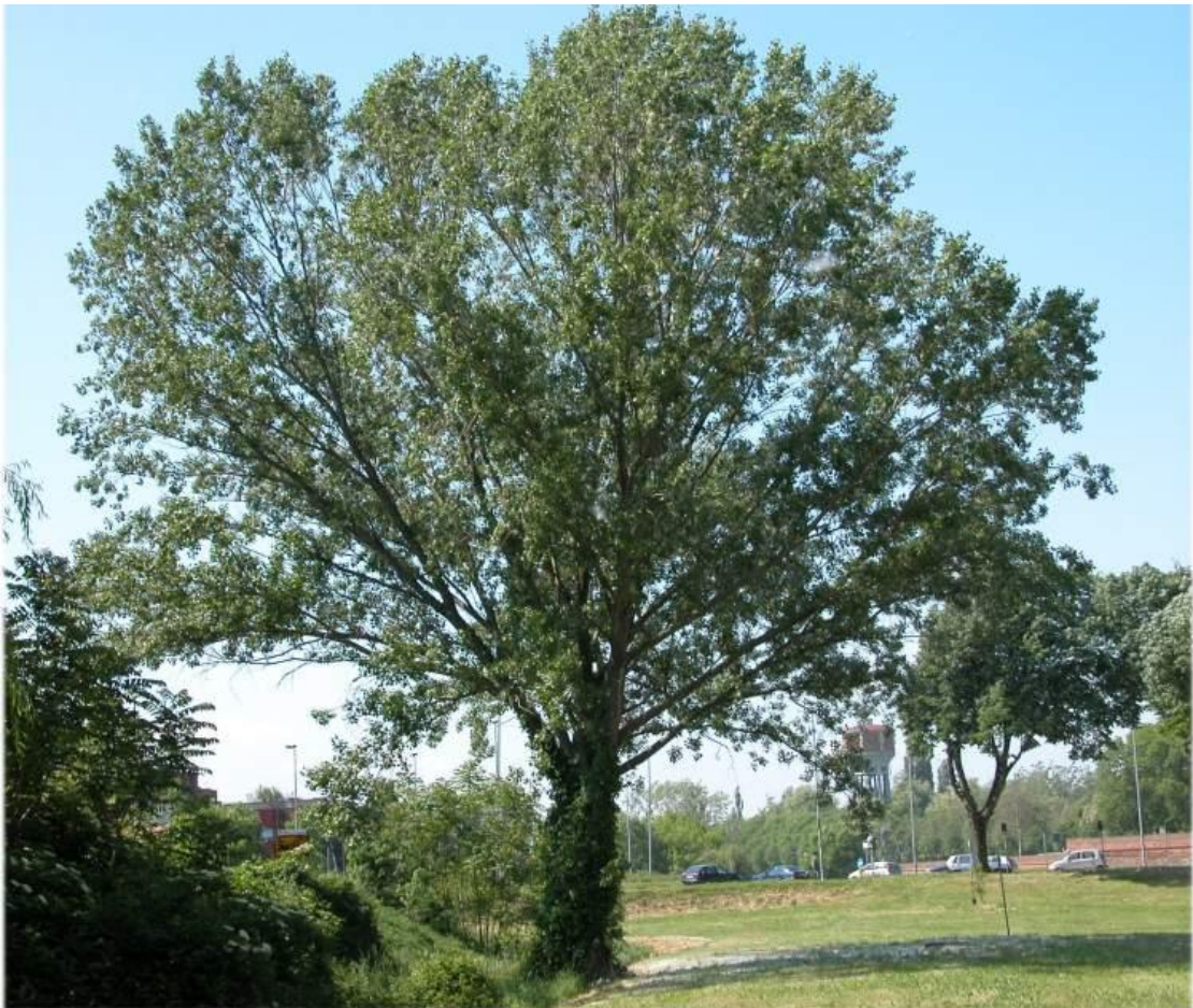
Slika 1. Europska crna topola ( Populus nigra L.) ( http://luirig.altervista.org )

Europska crna topola raste kao stablo i postiže visinu do 35 m i promjer do 2 m. Kora mladih stabala je glatka i pepeljastosiva, a kod starih stabala je ispucala, izbrazdana i tamnosiva. Ima površinski korjenski sustav s nekoliko dubokih žila. Krošnja je široka, granata i rahla.