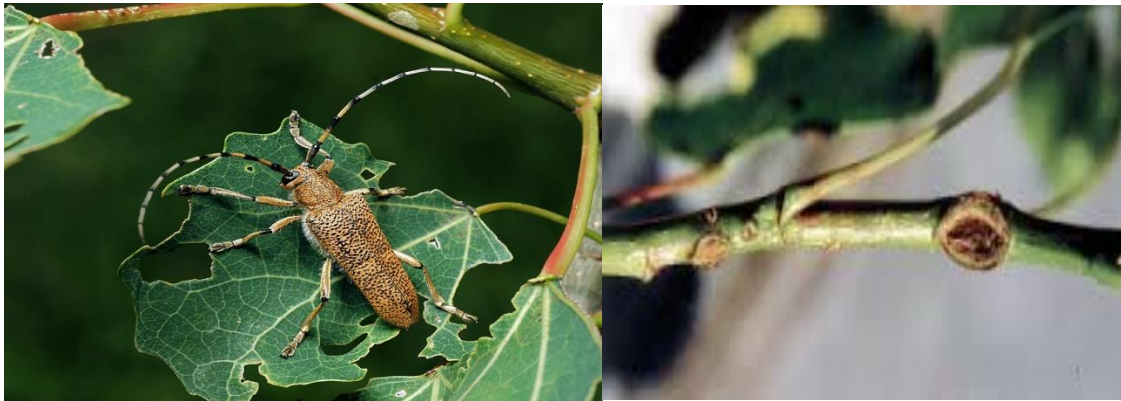
Slika 3. Saperda carcharias i Cryptodiaporthe populnea ( https://www.zin.ru ; http://www.sumins.hr )

Najpoznatije gljivične bolesti koje napadaju europsku crnu topolu i njene hibride su: Cryptodiaporthe populnea , Melampsora allii-populina , Melampsora larici-populina itd. Cryptodiaporthe populnea napada oslabljena stabla i uzrokuje upalu kore i rak topole. Najprije uzrokuje nekrozu kore, zatim ugibanje kambija, a to rezultira sušenjem stabala. Melampsora allii-populina uzrokuje rđu topolova lišća, a Melampsora larici-populina rđu topolovog lišća i ariševih iglica.