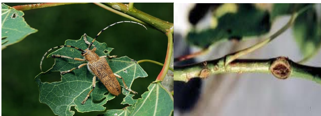
Slika 3. Saperda carcharias i Cryptodiaporthe populnea ( https://www.zin.ru ; http://www.sumins.hr )

Najpoznatije gljivične bolesti koje napadaju europsku crnu topolu i njene hibride su: Cryptodiaporthe populnea , Melampsora allii-populina , Melampsora larici-populina itd. Cryptodiaporthe populnea napada oslabljena stabla i uzrokuje upalu kore i rak topole. Najprije uzrokuje nekrozu kore, zatim ugibanje kambija, a to rezultira sušenjem stabala. Melampsora allii-populina uzrokuje rđu topolova lišća, a Melampsora larici-populina rđu topolovog lišća i ariševih iglica.