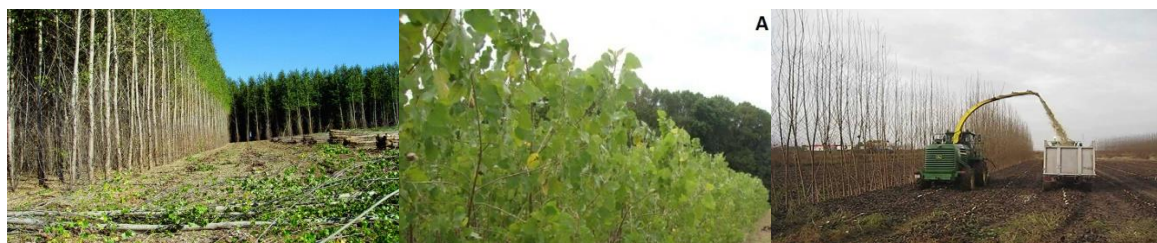
Slika 8. Energetski nasad topola i postupak eksploatacije ( http://www.nrs.fs.fed.us )

Zbog svoje velike izbojne snage, laganog vegetativnog razmnožavanja i dobrih svojstava rasta u širokom rasponu geografskih širina, topola je izvanredno drvo za proizvodnju biomase. Kroz genetičko oplemenjivanje ima veliku mogućnost povećanja prinosa. Kao najproduktivnija vrsta u umjerenom pojasu idealna je za osnivanje kulture kratkih ophodnji. To su intenzivni nasadi brzorastućih vrsta drveća na tlima koja su napuštena, na kojima poljoprivredna proizvodnja nije rentabilna ili su nepodesna za uzgoj vrijednijih šumskih vrsta, a nazivaju se i bioenergetski nasadi ili bioenergetske plantaže (Kajba, 2009). U takvim kulturama proizvodi se biomasa iz koje se proizvodi drvna sječka koja se konvertira u energiju. U kulturama kratkih ophodnji topola uzgajaju se biljke u uzgojnom obliku panjača sa jako velikom gustoćom sadnje koja se kreće od 1000 do 30 000 biljaka po hektaru. Sjeku se svake druge do pete godine, a nakon sječe potjeraju izbojci i izdanci koji se opet sjeku za dvije do pet godina. Na taj način moguće je sjeći 6-8 ophodnji, a nakon toga pada produkcija biomase i vitalitet biljaka pa je potrebno iskrčiti kulturu i zasaditi nove biljke. Proizvodnja biomase u Republici Hrvatskoj još nije zaživjela, ali nedvojbeno predstavlja veliki potencijal za cijelokupno gospodarstvo države. Također, takve kulture ne doprinose učinku staklenika, obnovljiv su izvor energije i svakako postoji potencijal za njihovo širenje.