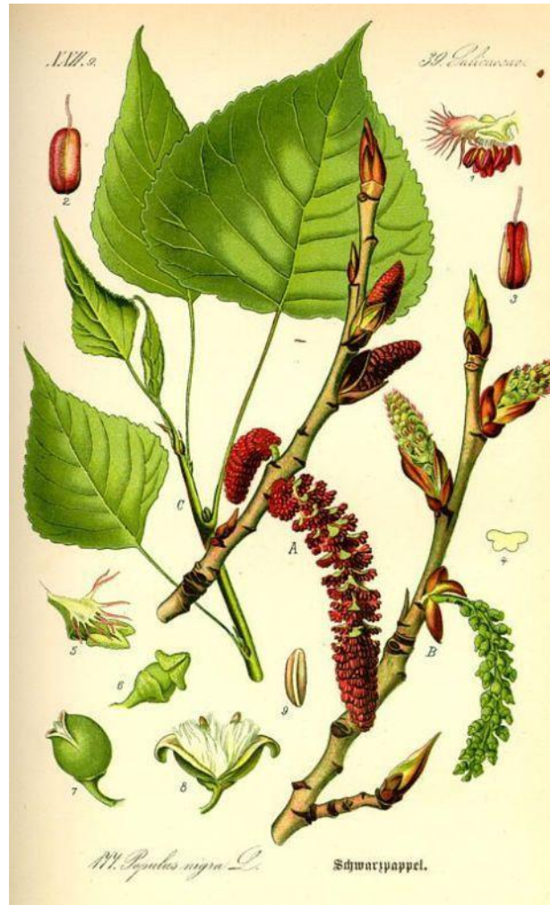
Slika 2. Izbojak s pupovima, lišćem, resama, tobolcima i sjemenkama

Cvjetovi europske crne topole su u valjkastim resama i macama duljine 3-6 cm. Muški cvjetovi su sjedeći i prije oprašivanja su ljubičastocrvene boje, a ženske mace se nalaze na peteljci. Cvjeta u travnju (prije listanja). Plod je gol, zelenkastosmeđi jajasti tobolac 7-9 mm dužine. Sjemenke su sitne, svjetlosmeđe, obavijene su kunadrom i najčešće ih je po pet u jednom tobolcu. Plodovi dozrijevaju u svibnju. Sjeme klije epigeično.