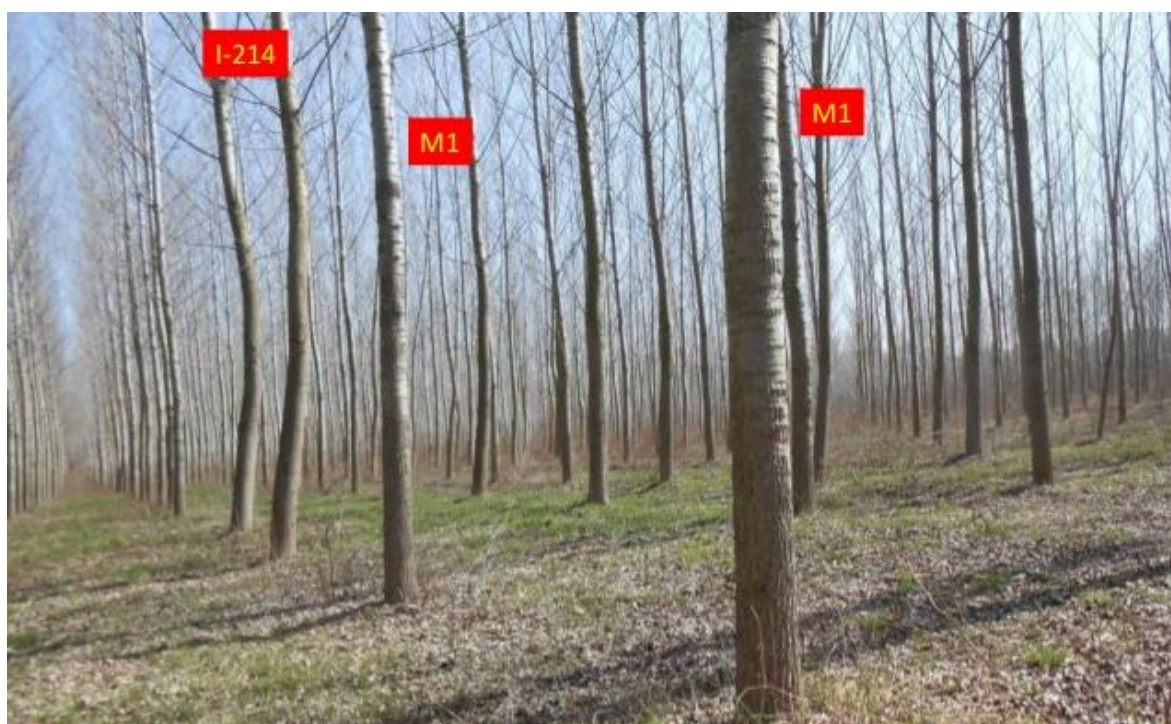
Slika 7. Plantaža klonova 'I-214' i 'M1'

Neki jugoslavenski klonovi su '55/65', '180/65', '200/65', '86/66'. Oni su stvoreni u Institutu za topolarstvo u Novom Sadu kao rekacija na pojavu bolesti Marssonina brunnea koja je napadala dotadašnje klonove.