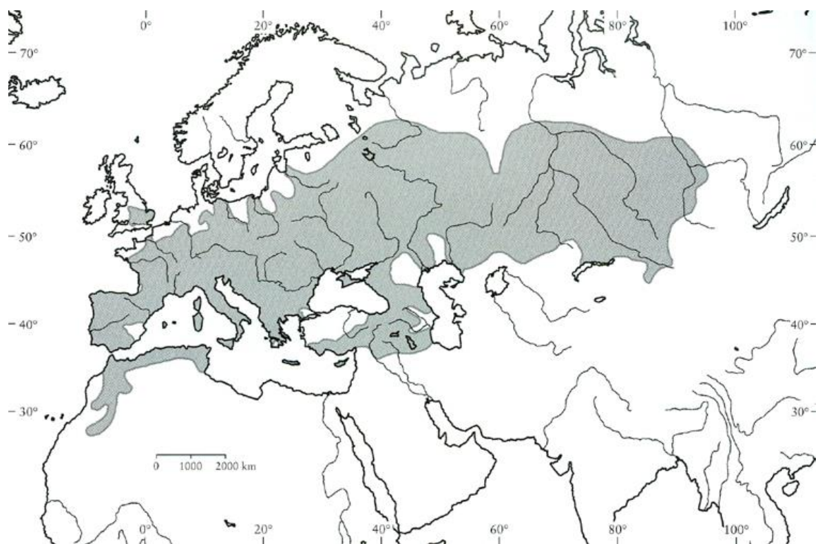
Slika 4. Prirodno rasprostranjenost europske crne topole

Crna topola dolazi na poplavnim područjima nizinskih rijeka, ali se može naći čak i do nadmorske visine od 1500 metara. Najbolje uspjeva na aluvijalnim pjeskovitim ilovačama.