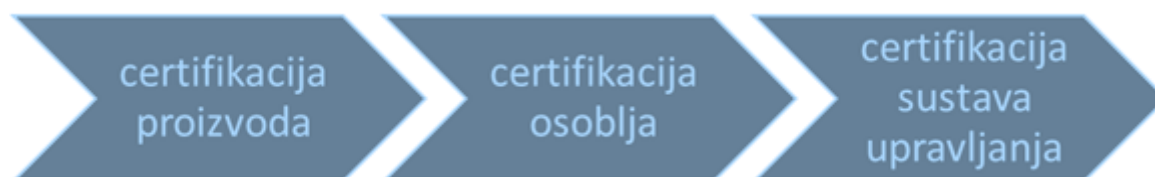
Slika 10. Shema certificiranja

Pojam certifikacija podrazumijeva potvrđivanje koje provodi treća strana, a koje se odnosi na proizvode, procese, sustave ili osobe. Drugim riječima, certifikacija je postupak u kojem neovisna organizacija na temelju provedenog ocjenjivanja sukladnosti, utvrđuje zadovoljava li proizvod, proces, sustav upravljanja ili osoba kriterije sadržane u određenom normativnom dokumentu. Pri tome, normativni dokument može biti međunarodna ili nacionalna norma, specifikacija, zakonski akt (pravilnik ili sl.) ili vlastito razvijena certifikacijska shema nekog certifikacijskog tijela. U slučaju ispunjenja postavljenih kriterija definiranih spomenutim normativnim dokumentom, certifikacijsko tijelo izdaje certifikat.