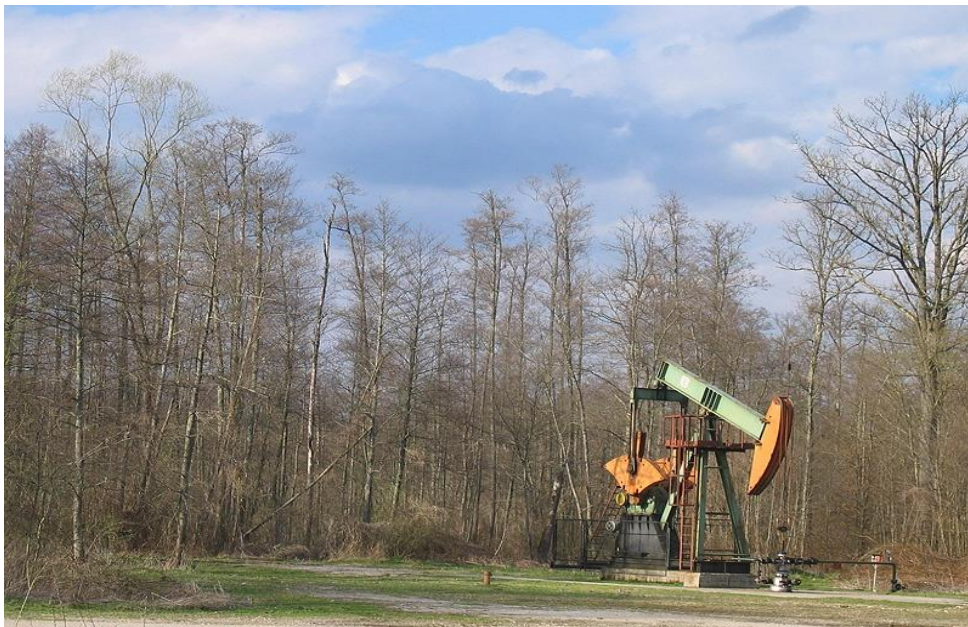
Slika 5. Velika opasnost za šume Žutice su izvori nafte (Moslavina info)

Šumski ekosustavi na području šume Žutica već od početka, a posebice od polovice 20. stoljeća pod intenzivnim su antropogenim utjecajima što je u jednom sinergističkom djelovanju dovelo do mjestimičnih promjena i nestabilnosti. Može reći da su ovo i dalje nestabilni i dinamični ekosustavi, ali i da u većini situacija pokazuju snagu šumske vegetacije i njen postupni oporavak.