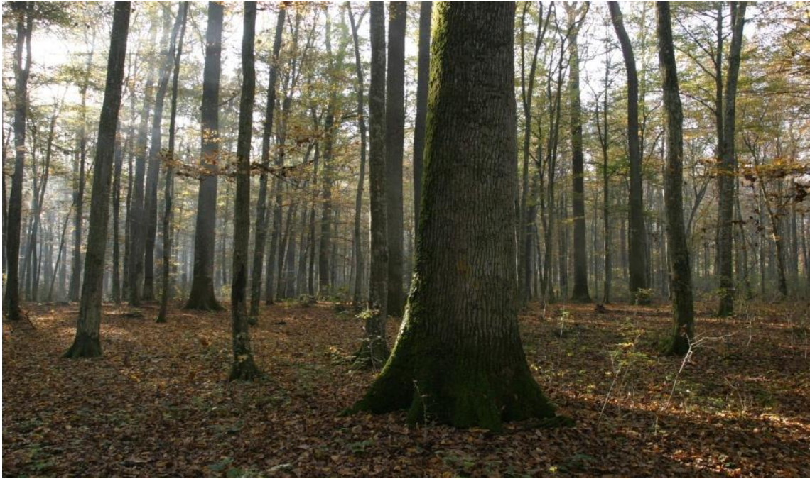
Slika 13. Šuma hrasta lužnjaka i običnog graba u Spačvanskom bazenu