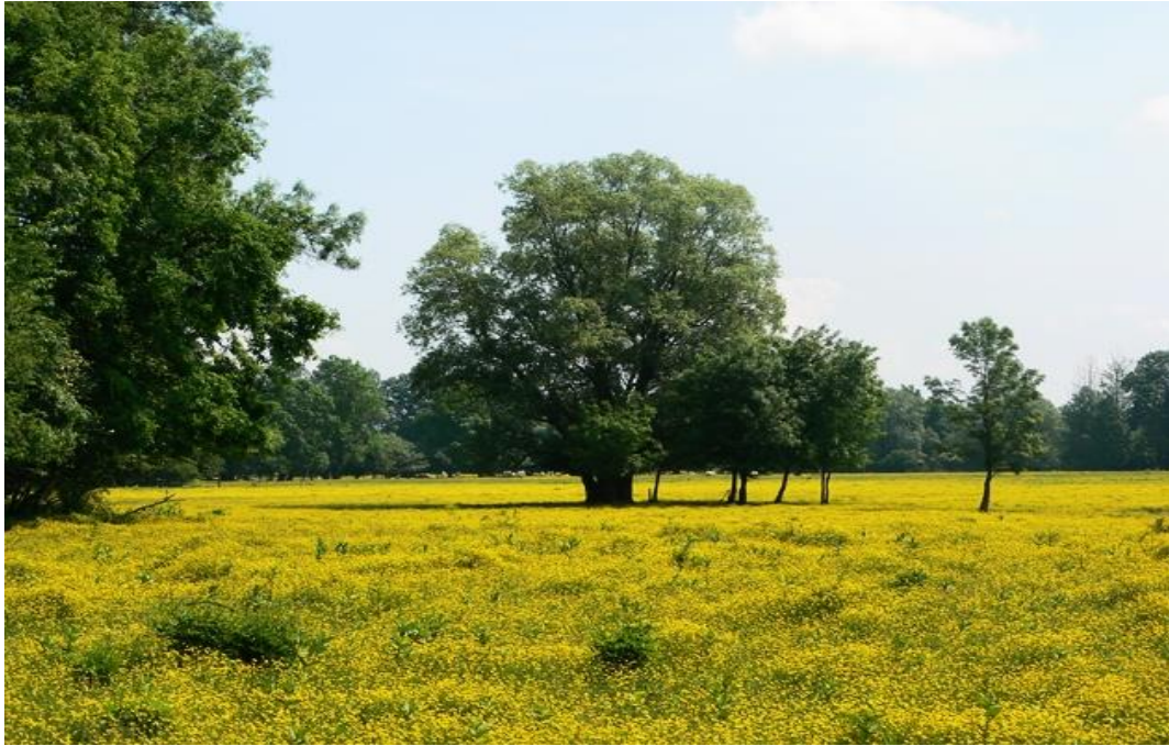
Slika 7. Sunjsko polje