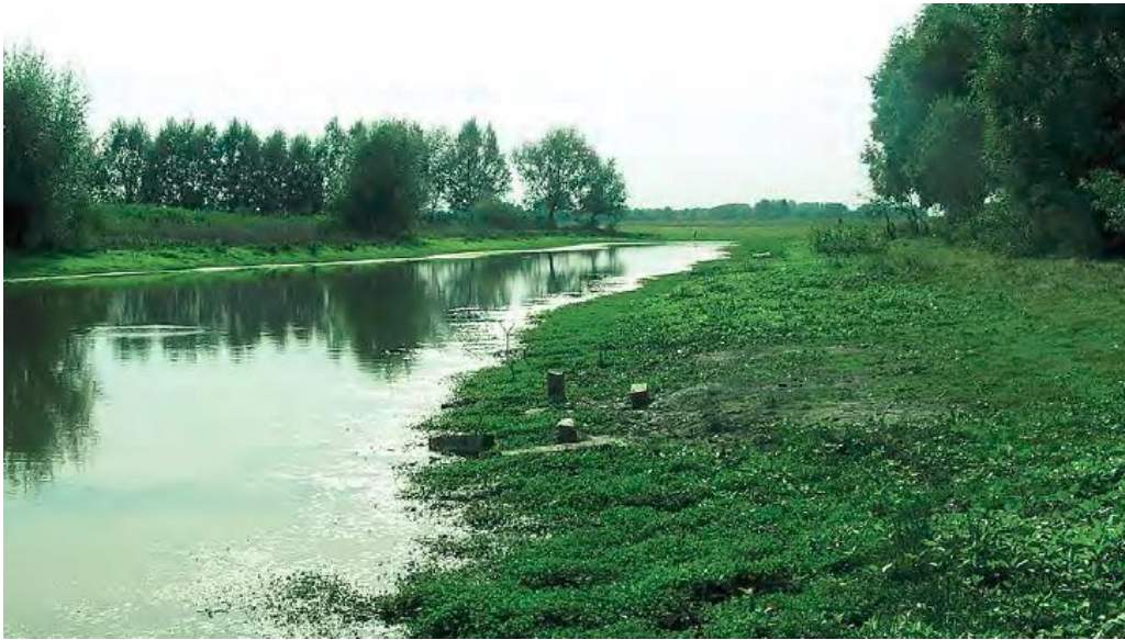
Slika 11. Površine obrasle zaštićenom vrstom „ Marsilea quadrifolia “

Ovo područje je poplavni prostor između rijeke Save i istočnog nasipa kod Slavenskog Broda, blizu sela Oprisavci. Važnost ovog područja predstavljaju prostrani vlažni travnjaci, stari rukavci sa bogatom vodenom i močvarnom vegetacijom te brojne aluvijalne depresije u kojima se redovnim proljetno-jesenskim poplavama zadržava voda i nakon povlačenja vode u Savu. Najveća od njih, Velika Gajna ima 5 ha i važno je područje za četverolisnu raznorotku ( Marsilea quadrifolia ), vrstu zaštićenu Direktivom o staništima.