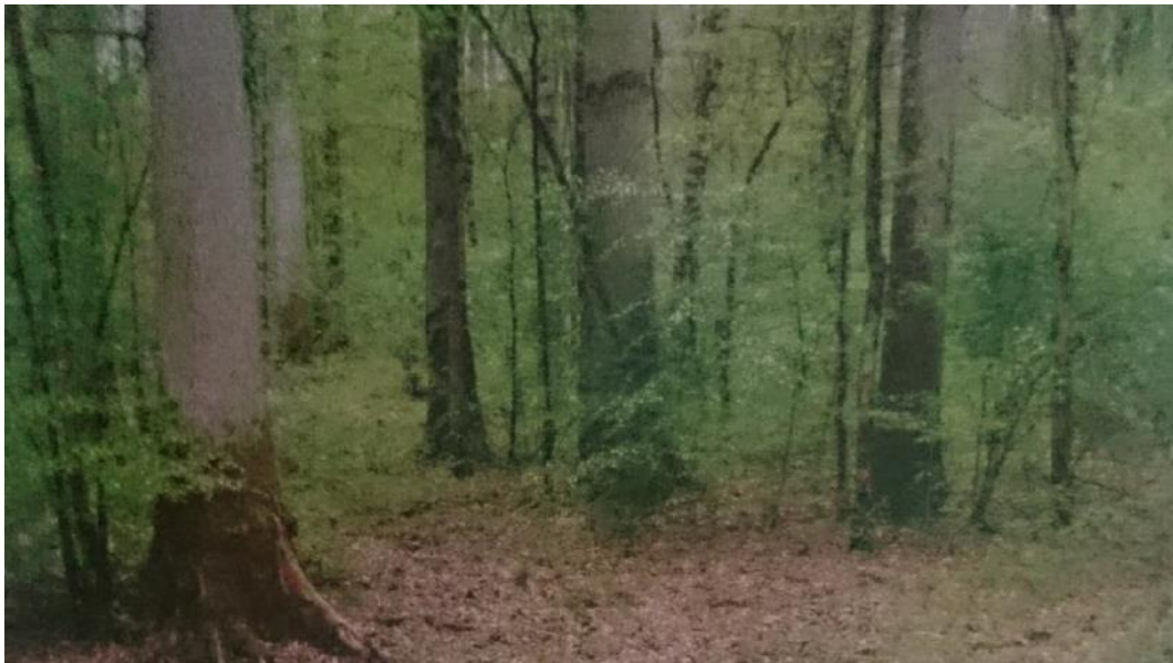
Slika 12: Šuma hrasta lužnjaka s velikom žutilovkom i rastavljenim šašem

nadovezuje izravno ili preko šume lužnjaka sa velikom žutilovkom i žestiljem. Važno je napomenuti kako je za ovu zajednicu ( Genisto elatae-Quercetum roboris subas. caricetosum remotae ) vrlo važna nadmorska visina terena, koja je od 80 do 85 m, a za pridolazak zajednice je vrlo bitan mikroreljef koji se povezan sa razinom podzemne vode koja je dosta visoka tokom cijele godine. Lužnjak se javlja u svim plohama te prevladava u subasocijaciji, još se ponegdje javlja vez ( Ulmus laevis ) i poljski jasen ( Fraxinus angustifolia ). Sloj grmlja je nejednako razvijen, negdje je vrlo slabo razvijen ili ga uopće nema pa u tom slučaju prevladava samo plava kupina ( Rubus caesius ), dok je na drugim mjestima u obliku pomlatka hrasta, brijesta i jasena. Od pravih grmova dolaze glogovi ( Crataegus monogyna i Crataegus oxyacantha ), velika žutilovka ( Genista tinctoria ssp. elata ), crvena hudika ( Viburnum opulus ), crni trn ( Prunus spinosa ). U sloju prizemnog rašća najznačajniji je rastavljeni šaš ( Carex remota ) i uskolisni šaš ( Carex strigosa ), zatim crijevac ( Cerastium silvaticum ), kiselica ( Rumex sanguineus ), plava kupina ( Rubus caesius ), vučja noga ( Lycopus europaeus ) i dr.