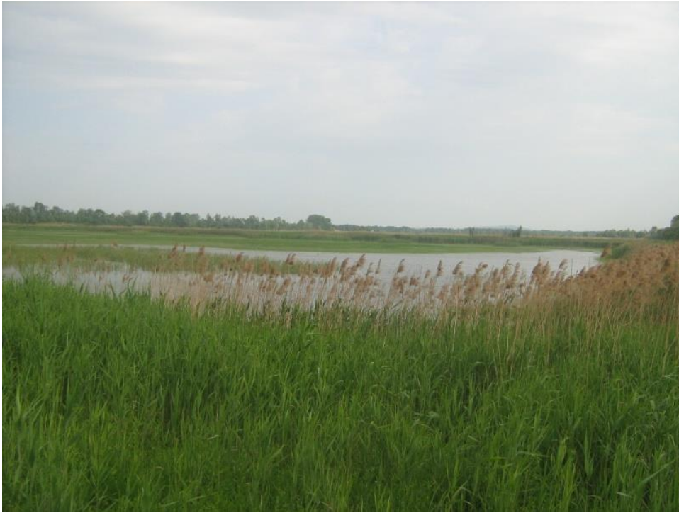
Slika 10. Ribnjak Jelas

Jelas ribnjaci zaštićeni su 1995. godine odlukom skupštine županije Brodsko-posavske u kategoriji posebnog ornitološkog rezervata. Rezervat obuhvaća 125 ha površine ribnjaka. Jelas ribnjaci su dio ekološke mreže NATURA 2000 kao područje očuvanja značajno za ptice.