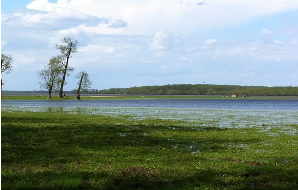
Slika 6. Močvarni krajobraz Lonjskog polja

Uzroci ugroženosti šumskih staništa su: promjena vodnih režima, hidromelioracija, širenje invazivnih biljnih vrsta ( Amorpha fruticosa L.), nekontrolirana ispaša i žirenje svinja (šuma hrasta lužnjaka).