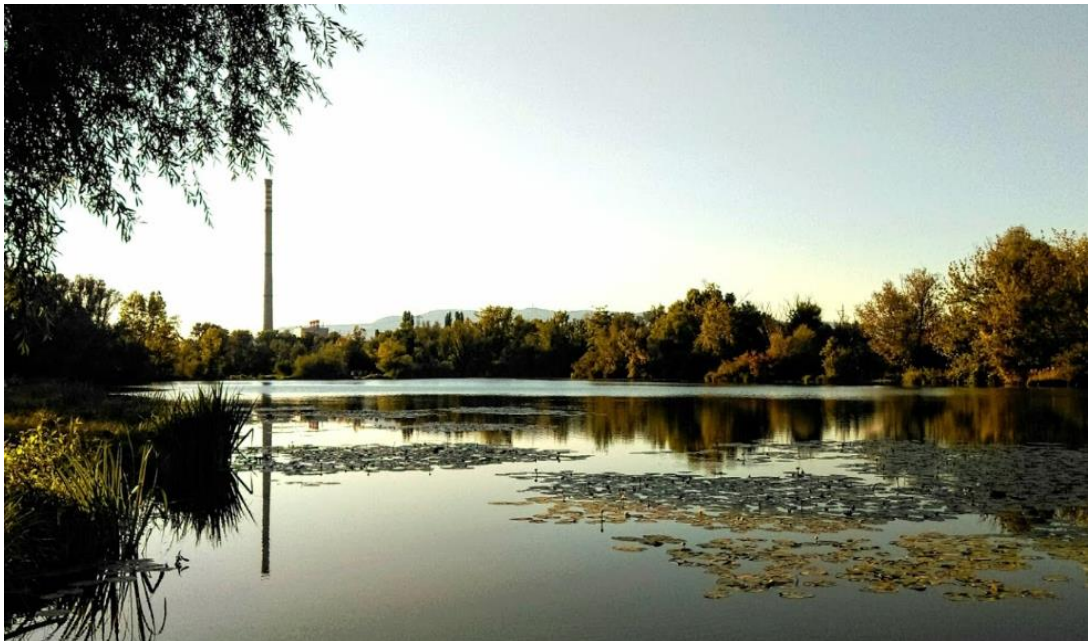
Slika 2: Savica

Osobita vrijednost flore Savice su sastojine drvenastih vrsta ( Salix alba , Populus nigra , Alnus glutinosa ), koje predstavljaju posljednje ostatke poplavne vegetacije uz rijeku Savu, kao i hidrofiti i helofiti prisutni u jezercima i oko njih. Najzastupljenije porodice su Asteraceae (12.5 %), Poaceae (11.8 %), Lamiaceae (5.9 %), Fabaceae (5.2 %), Cyperaceae (4.8 %) i Rosaceae (4.8 %), a rodovi zastupljeni s najviše vrsta su: Carex , Poa , a zatim Acer , Galium i Salix . Važno je napomenuti kako na području grada Zagreba ovo stanište kao i prethodno predstavlja veliku vrijednost u pogledu pridolaska i očuvanja prirodne vegetacije u urbanim područjima.