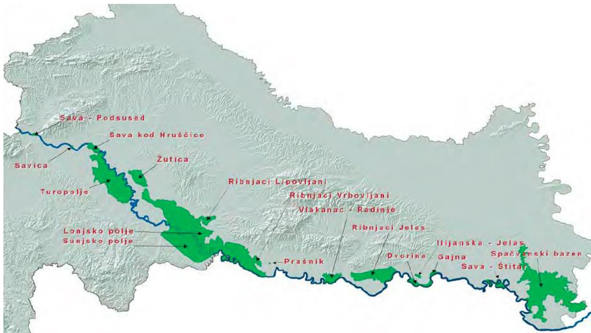
Slika 1. Područja ekološke mreže duž rijeke Save

Cilj ovog rada je na osnovu sve dostupne literature i internetskih izvora detaljnije opisati šumsku vegetaciju na prije navedenih 17 lokaliteta duž rijeke Save te tako doprinijeti boljem znanju o raznolikosti i vrijednosti naših nizinskih šumskih ekosustava te njihovom očuvanju.