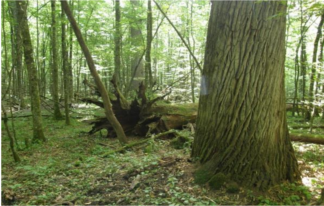
Slika 9. Prašuma Prašnik