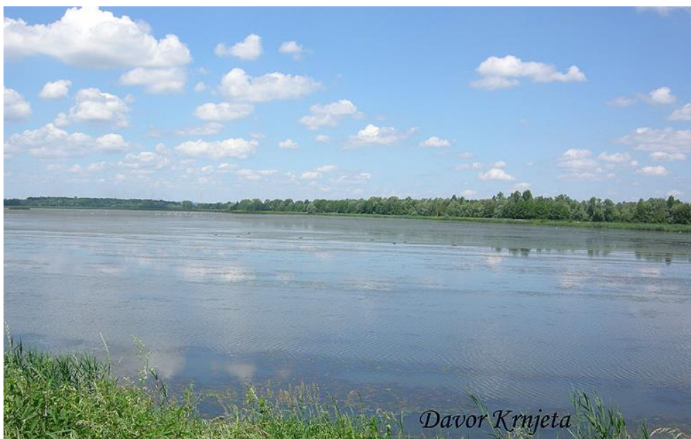
Slika 8: Ribnjak Lipovljani