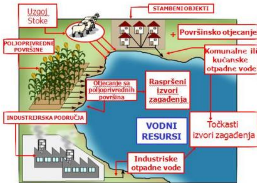
Slika 2. Izvori onečišćenja voda

prostoru, ubrajaju se naftovodi, cjevovodi i plinovodi kojima se transportiraju opasne tvari i energenti, spremišta opasnih tvari i izvori termalnog onečišćenja.