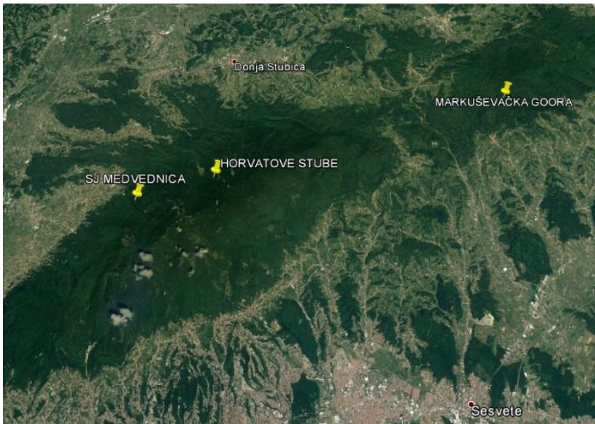
Slika 6. Uzorkovane populacije obične tise na Medvednici.

Na listovima su mjerene sljedeće morfološke značajke: površina plojke (LA); dužina plojke (BL); maksimalna širina plojke (MPW); dužina plojke, mjerena od osnove plojke do mjesta najveće širine plojke (PMPW); širina plojke na 50 % dužine plojke (PW1); širina plojke na 90 % dužine plojke (PW2); kut koji zatvaraju glavna lisna žila i pravac definiran osnovom plojke i točkom na rubu lista, koja se nalazi na 10 % dužine plojke (LA1); kut koji zatvaraju glavna lisna žila i pravac definiran osnovom plojke i točkom na rubu lista, koja se nalazi na 25 % dužine plojke (LA2).