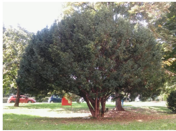
Slika 4. Habitus.

Postoje različiti kultivari tise koji se koriste u svrhe pejzažnog oblikovanja. Neki od njih su 'Adpressa', 'Adpressa Aurea', 'Amersfoort' te 'Fastigiata'.