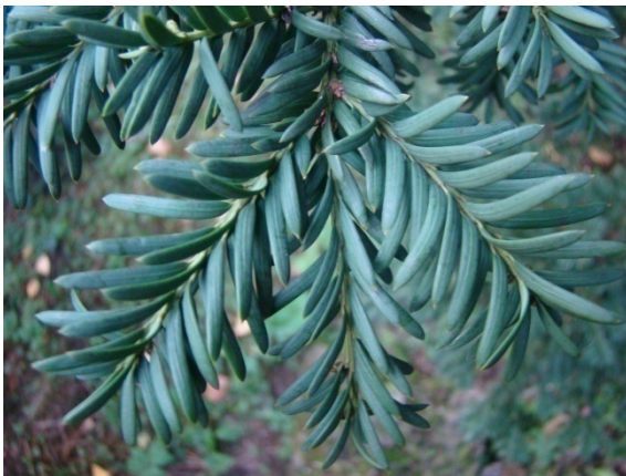
Slika 1. Igllice s gornje strane.

Najčešće raste na vapnenačkom, humusom bogatom tlu, ali i stijenama. Dugovječna je vrsta iz razloga što ima sposobnost obnavljanja izdancima iz korijenja. Stariji primjerci tise obično imaju šuplje deblo. Razvija razgranat, dubok korijenski sustav sa žilom srčanicom u normalnim uvjetima koje karakterizira tlo s dovoljno prostora za razvoj. Na strmim, vapnenastim terenima s ograničenim uvjetima tvori plitko korijenje. U Hrvatskoj obično raste na sjevernim ekspozicijama pod zastorom krošanja na nadmorskim visinama od 200 do 1500 m. Nije tolerantna na kasne mrazeve i velike temperaturne razlike, kao ni na duga sušna razdoblja.