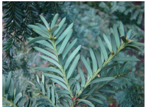
Slika 2. Igllice s donje strane.