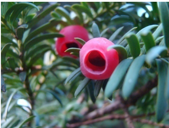
Slika 3. Sjemenka s arilusom.