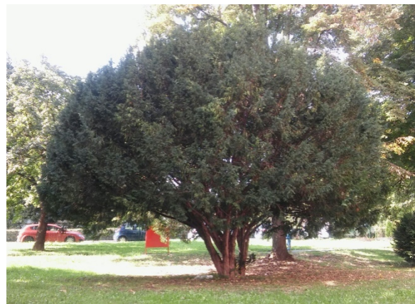
Slika 4. Habitus.

Postoje različiti kultivari tise koji se koriste u svrhe pejzažnog oblikovanja. Neki od njih su 'Adpressa', 'Adpressa Aurea', 'Amersfoort' te 'Fastigiata'.