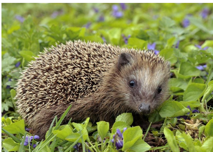
Slika 11. Europski jež u prirodi