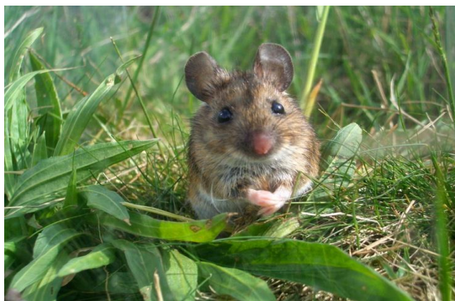
Slika 8. Šumski miš u prirodnom staništu

Izgledom vrlo sličan žutovratom šumskom mišu Apodemus flavicollis , ali je ipak nešto manji i rep ne prelazi dužinu tijela. Na vratu je ponekad prisutna žuta pjega. Veličina tijela je od 8 do 11 cm, a rep je dugačak 7 do 9 cm. Leđna strana krzna je sivosmeđe boje, a trbušna strana je nešto svijetlija od leđne i nisu jasno odvojene. Šumski miš aktivan je po noći i izvrstan je penjač. Iako samo ime govori koja staništa preferira može se pronaći i na nekim drugima poput livada, polja sa žitaricama i pješćanih dina. Šumski miš pari se od ožujka do listopada i tokom godine ženka se koti 2-4 puta. Leglo obično broji oko 5 mladih, a ženka mlade nosi između 25 i 26 dana. Šumski miševi primarno se hrane sjemenom vrsta poput hrasta, bukve, jasena, gloga i dr. Štete koje počinjavaju na sjemenu tih vrsta nemaju toliki značaj u šumarstvu. U kasno proljeće i ljeto hrana im se pretežno sastoji od puževa i insekata s obzirom na nedostatak šumskog sjemena, ali jedu i korijenje i voćke. Hranu spremaju u gnijezda, a u potrazi za hranom mogu označiti grančicama ili lišćem put. Iako ne spavaju zimski san tokom hladnih zima smanje fizičku aktivnost na minimum kako bi preživjeli.