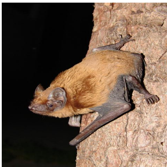
Slika 14. Nyctalus noctula na deblu

Rani večernjak šišmiš je rđeg i kratkog krzna na leđima dok je na trbuhu nešto svjetlije nijanse. Zimi je krzno nešto tamnije s malo blijeđim vrhovima. Uši su mu zaobljene i široke. Krila su duga i uska, naročito na vrhu. Ima širok raspon staništa pa ga se može pronaći u listopadnim šumama, mediteranskim hrastovim šumama i gradovima. Za sklonište preferira duplje koje je napravio dijetlić i nešto manje rupe na stablima, ali je bitno da su duplje više od 4 m iznad zemlje. Uglavnom biraju skloništa uz rub šume ili unutar šume, ali ih se može naći i na čistini i uz vodena staništa. Mužjaci sami formiraju ljetne kolonije (oko 20 jedinki) u dupljama ili pukotinama stijena i često ih mijenjaju. Zimske kolonije broje i do 1000 jedinki i mogu se naći u rupama stabala s debelim stijenama ili u antropogenim objektima poput mostova, potkrovlja te špilja. Rani večernjak brzi je letač te postižu brzinu od 50 km/h, uglavnom lete na visini od 10 do 50 metara, a ponekad i više. Plijen hvataju uz livade, iznad vode i uz uličnu rasvjetu. U jesen i zimi love i po danu. Hrane se kukcima. Mužjaci početkom kolovoza zauzimaju skloništa za parenje za koja se žestoko bore s drugim mužjacima. Sa ulaza pjevaju i tako privuku 4 do 5 ženki s kojima provode nekoliko dana. Mlade kote od sredine lipnja do srpnja i okote jedno do dva mlada. Migriraju u rujnu, po danu, kada ih se može vidjeti kako lete uz lastavice. U ožujku se vraćaju na sjeverozapad, a duljina puta je rijetko duža od 1000 kilometara.