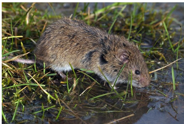
Slika 4. Livadna voluharica voli vlažna staništa

Livadna voluharica mali je tamnosmeđi glodavac s kratkim repom. Glava i tijelo variraju duljinom od 9.5 do 13.5 cm, a rep je duljine od 2.4 do 4 cm. Iako vrlo slična poljskoj voluharici Microtus arvalis , razlikuje se po tamnijem i dužem krznu te položajem i veličinom ušiju. Težina je svega 25 do 50 g. Livadna voluharica bira vlažne terene mješovitih šuma, zakorovljene sječine i progale. Masovno se pojavljuje svake tri do četiri godine. Gnijezda prave u tlu prikupljajući trave i šaš. Ženka koti nekoliko puta godišnje po desetak mladih, ovisno o uvjetima koji vladaju te godine. Životni vijek livadne voluharice je oko 2 godine. Kreće se kroz visoku vegetaciju poznatim rutama kako bi brzo mogla doći do skloništa. Najveći neprijatelji su joj sove, jastrebovi, lasice i drugi grabežljivci. Aktivna je danju i ne spava zimski san. Pretežno se hrani zeljastim biljem, pupovima i korom pojedinih vrsta drveća i travom. Najveće štete čini arišu, johi, jasenu, javoru, grabu, topoli, crvenom hrastu i voćakama kada im odgriza pupove i koru. Mladim stablima stvara štete tako što ih izgriza od 10 do 20 cm visine ili ih prstenuje.