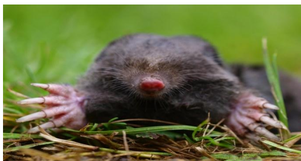
Slika 13. Snažne prednje noge i kande im služe za kopanje tunela