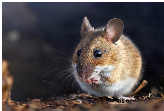
Slika 6. Žutovrati šumski miš skuplja hranu

Žutovrati šumski miš ubraja se među najveće poljske miševe. Obitava u šumskim sastojinama hrastovih i bukovih šuma sa slabo razvijenim slojem prizemnog rašća. Tijelo je dugačko između 10 i 14 mm, a rep je dugačak otprilike isto koliko i tijelo. Težina varira od 28 do 43 grama. Leđna strana je crvenkastosmeđe boje, dok je krzno na trbuhu bijelosivo. Posebnost je žučkasta dlaka s ventralne strane u području vrata. Žutovrati miš pojede velike količine hrane, a svoje skladište radi uglavnom u zemlji do 1.5 m dubine što ovisi o razini podzemne vode. Hrani se pretežno sjemenom drveća, ali u nedostatku istoga jede sjeme prizemnog rašća, cvijeće i kukce. Iz svojih skloništa prelazi na poljoprivredne površine u blizini šuma uglavnom u potrazi za hranom. Skloništa pravi u šupljinama drveća ili ispod njihove kore. Brojnost populacije ovisi o urodu žira i drugih plodova, ali i o broju divljih svinja koje se također hrane istim plodovima. Nakon obilnog uroda hrasta dolazi do prenamnoženja. Takva prenamnoženja javljaju se u razdoblju od 3 godine kao i kod većine miševa.