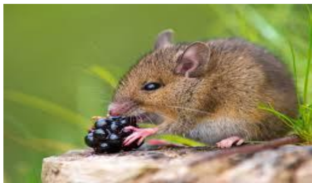
Slika 9. U nedostatku šumskog sjemena može se hraniti i zbirnim plodovima