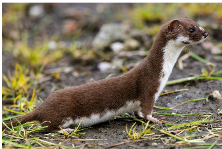
Slika 18. Lasica u prirodi