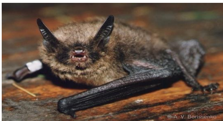
Slika 17. Brandtov šišmiš