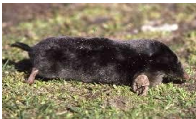
Slika 12. Krtica

Krtice imaju tijelo cilindričnog oblika prilagođeno kretanju pod zemljom. Krzno je crne boje. Dužina tijela je od 11 do 16 cm, a težina varira od 80 do 120 grama. Vanjske uši im nedostaju, rep je kratak, a oči su male, crne i smještene iza krzna. Krtice se slabo služe očima, ali svejedno vide nasuprot uvriježenom mišljenju da su slijepi. Prednje noge su vrlo kratke, ali snažnih i razvijenih mišića jer se njima služe za kupanje tunela u kojima borave. Na kandama imaju pet prstiju sa snažnim noktima koji su zakrivljeni prema van. S njima izbacuju zemlju sa strane prilikom kopanja. Hodnike s brojnim izlazima konstantno produžuju. Mogu dugo boraviti pod zemljom, a višak zemlje prilikom kopanja hodnika izbacuju van pri čemu na površini tvore krtičnjake. Hrane se gujavicama, posebno kišnim glistama lat. Lumbricus terrestris , malim beskralježnjacima i njihovim larvama. Slina im sadrži toksine kojima paraliziraju plijen i zahvaljujući tome mogu pohraniti hranu. Krtice vole rahlu zemlju, a nastanjuju livade, pašnjake i rubove listopadnih šuma. U vrtovima i na polju stvaraju velike probleme kada kopanjem izbacuju zemlju na površinu. Pare se u proljeće, a svoje gnijezdo, napravljeno od suhih listova i trave, grade u zemlji. Ženka mlade nosi oko 28 dana i rađa 4-6 mladih koji sišu 4-5 tjedana. Samostalni postaju s mjesec dana, a spolno zreli s godinu dana. Očekivani životni vijek je 3-4 godine.