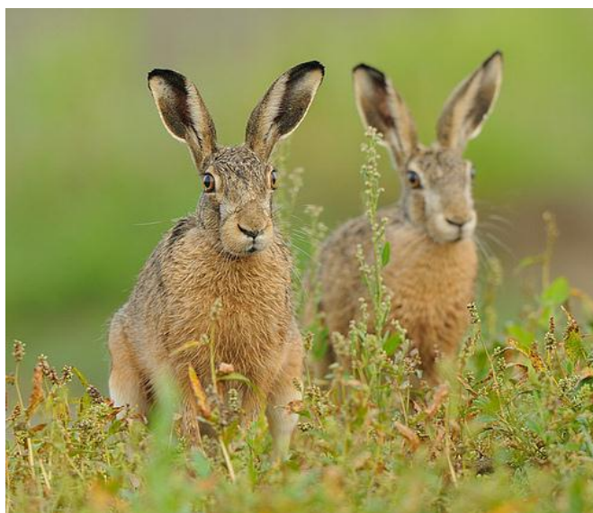
Slika 10. Europski zec

Obični zec pripada dvojezubcima i prilagođen je otvorenim prostorima umjerene klime. Jedan je od najvećih dvojezubaca mase od 2,5 do 4,0 kg i dužine 48-75 cm. Rep je 7 do 11 cm dugačak. Obični zec ima 28 zuba. Krzno je vrlo gusto i kovrčavo, na leđima žućkasto smeđe boje dok je truh sivkasto bijel. Za razliku od drugih zečeva, obični zec ne mijenja boju dlake zimi. Ima duge stražnje noge i dlakava stopala. Aktivan je uglavnom predvečer i noću, ali se to mijenja tokom sezone parenja kada je „vrijeme trke“ i dolazi do borbe za ženku. Izvan sezone parenja skrivaju se u udubljenom ljegalištu od brojnih neprijatelja. Izuzetno su spretni i brzi te mogu doseći brzinu kretanja od 72 km/h. Vidno polje im je skoro 360° zahvaljujući položaju očiju. Uglavnom su biljojedi te se hrane travom, zeljastim biljem i usjevima, zimi grančicama, pupoljcima i korom mladog drveća. Kao i kod ostalih dvojezubaca, i kod zeca je raširena autokoprofagija. Zečevi se pare od siječnja do kolovoza. Mlade nose 41-44 dana, kote od ožujka do listopada više puta obično po 2-4 (1-8) mladih koji odmah progledaju i mogu napustiti logu u slučaju opasnosti. Samostalni su nakon mjesec dana, a spolno zreli nakon 6-12 mjeseci. Iako su široko rasprostranjeni, primjećuje se pad populacije od 1960.-ih godina. Uzrok tome je intenzivna poljoprivreda, lov i razne bolesti. Neke zemlje su europskog zeca uvrstile na crvenu listu. U nekim dijelovima se smatra invazivnom vrstom i štetočinom. Najveće štete čini na kulturama.