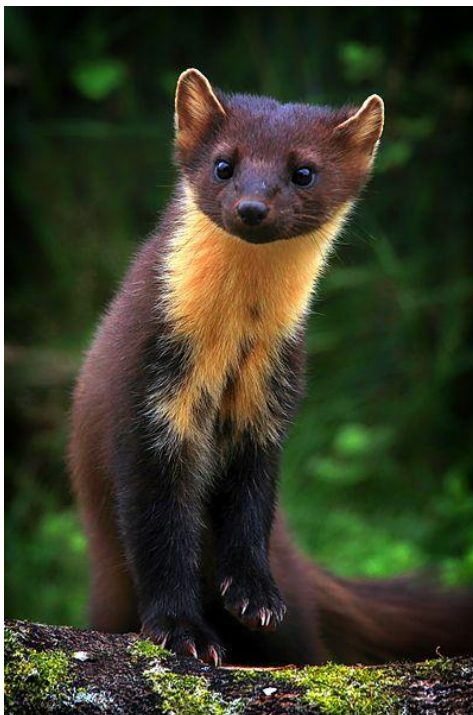
Slika 19. Martes Martes L.

Kuna zlatica rasprostranjena je po svim šumovitim dijelovima Europe. U duljinu naraste između 50 i 55 cm, rep je dug oko 35 cm, a težina varira između 1,5 i 1,8 kg. Gornji dio tijela je tamnosmeđe boje, njuška je svijetlosmeđe boje, sa strane i po trbuhu žućkasta, a noge su crno smeđe. Na donjoj strani vrata dlaka je zlatno žute boje po čemu je kuna zlatica dobila ime. Ponekad taj žuti dio prelazi i između prednjih nogu, a rjeđe ide i do stražnjih. Na gornjoj usni nalaze se čekinje poredane u četiri reda. Osim njih, još se nalazi nekoliko iznad očiju, ispod brade i po grlu. Te čekinje kunama služe kao osjetilo opipa. Kuna zlatica boravi u šumama listača i četinjača i najviše se zadržava u krošnjama drveća. Vrlo je vješt penjač te boravi u dupljama drveća, u napuštenim gnijezdima, a rjeđe u pukotinama špilja ili podzemnim skrovištima. Lovi tokom noći, a danu je slabo aktivna. Izuzetan je lovac koji je u stanju ubiti i oslabljelo lane od zime, ali preferira sitne sisavce. Najčešće stradaju glodavci koji žive na stablima, vjeverice i puhovi. Voli slatke plodove (malina, trešnja, šljiva i dr.) i med te nerijetko pljačka ptičja gnijezda. Pari se jedanput godišnje od šestog do osmog mjeseca, iako se znakovi parenja mogu pojaviti i u prvom i drugom mjesecu. Ženka nosi mlade 270 do 300 dana, a koti se u trećem i četvrtom mjesecu. U jednom leglu bude 3 do 5 mladih koji ostaju slijepi 34-38 dana, a sišu sve do osmog tjedna života. Životni vijek iznosi 10-12 godina.