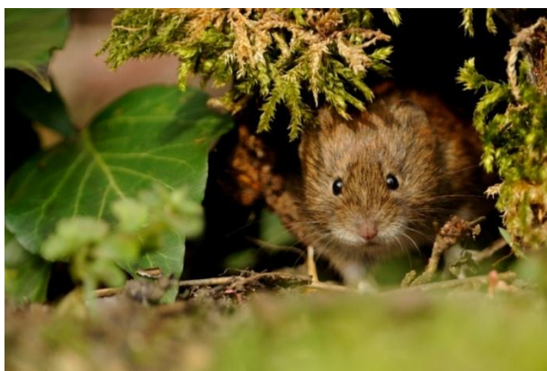
Slika 2. Šumska voluharica

Šumska voluharica maleni je sisavac koji pripada porodici Arvicolinae , rod Myodes . Tijelo joj je dugačko svega 10 cm, a rep je duljine 5.5 cm. Leđa su crvenkastosmeđe boje, a noge i trbuh bijele. Živi u šumama, na proplancima, ali se može pronaći i u vrtovima. Šumska voluharica voli gustu vegetaciju pa je se najčešće može pronaći u bujnom sloju prizemnog rašća bjelogoričnih i crnogoričnih šuma, grmlju, močvarama, rubovima šuma i oranica. Najčešće oštećuje bukvu, bor, jasen, javor, jelu, smreku i dr. u zimskom periodu kada oštećuje koru mladih sadnica. Hrani se vegetativnim dijelovima i sjemenom zeljastih biljaka, dijelovima korijena, a zimi i mladom korom koju glođe na stabljici i granama. Zalihe svoje hrane sprema u podzemne hodnike i komore koje kopa i oblaže mahovinom, perjem te biljnim vlaknima. Ženka okoti oko četiri legla tokom ljeta. Spretno se penje na grmlje i niže grane drveća, a može živjeti osamnaest mjeseci do dvije godine.