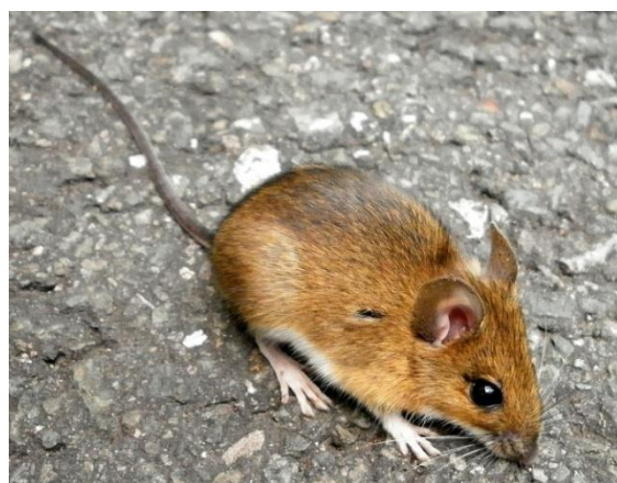
Slika 7. Dužina repa jednaka je dužini tijela