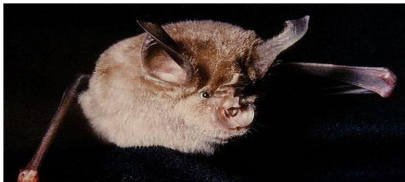
Slika 15. Rhinolophus ferriuequinum Schreber – Veliki potkovnjak

Veliki potkovnjak leti sporo i nisko te s puno mijenjanj smjera i razdobljima jedrenja. Hрани se kukcima koje lovi noću po 3 sata podijeljeno u dva leta. Vrsti je znatno opala brojnost u posljednje vrijeme te se smatra vrlo ugroženom.