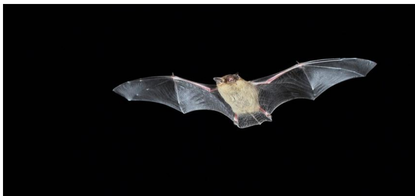
Slika 16. Myotis brandtii u letu

Brandtov šišmiš vrsta je koja preferira staništa širokolisnih šuma uz prisutnost vode. Redovito se pronalazi u zgradama, a preferira napuštene zgrade s kamenim zidovima. Visi u uskim pukotinama te se gnijezdi iznad različitih udubljenja kao i šupljinama zidova. Hibernacija se odvija u malim skupinama do 20 jedinki u tunelima i špiljama. Preferiraju hladne lokacije blizu ulaza, a rjeđe biraju topliju unutrašnjost. Hibernacija traje dugo do pred kraj svibnja. Parenje započinju u jesen, ali postoje i zapisi o zimskome parenju. U ljeto, odrasle ženke formiraju roditeljske kolonije te se odvajaju od mužjaka. Ženka rađa jednog mladog koji postaje samostalan sa šest tjedana. Aktivni su gotovo čitavu noć, a svoje kretanje započinju pola sata nakon zalaska sunca. Brandtov šišmiš vrlo je vješt letač te leti na visini od 20 metara. Hranu traže u krošnjama drveća, a prehrana im se sastoji od noćnih leptira, malih insekata i pauka. Uvijek blizu hranilišta mora postojati izvor vode. Eholokacija se čuje u rasponu od 35-80 kHz u obliku jako brzih kliktaja.