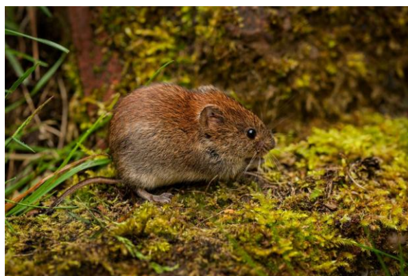
Slika 3. Šumska voluharica u šumi