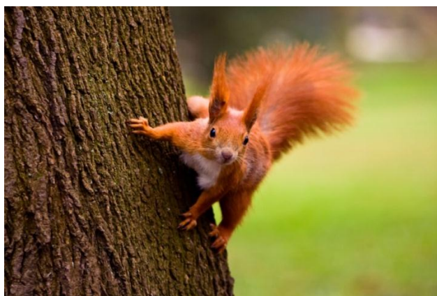
Slika 1. Obična vjeverica u prirodnom staništu

Obična vjeverica pripada porodici Sciuridae , rod Sciurus . Tijelo vjeverice je vitko i ellegantno s dugačkim kitnjastim repom. Dužina tijela iznosi 20-28 cm, a kitnjasti rep može doseći dužinu od čak 20 cm. Krupne oči i uske uši s čupercima, koji su posebice izraženi u zimu, karakteriziraju malu glavu. Vjeverica ima 22 zuba, od čega 10 kutnjaka u gornjoj i 8 u donjoj čeljusti. Kao i kod ostalih glodavaca, zubi im rastu tokom cijeloga života, a to kompenziraju glodanjem. Upravo glodanjem kore i stvaranjem gnijezda nastaju štete od vjeverica. Krzno je varijabilno, najčešće crvenkasto smeđe boje s leđne strane, a s trbušne strane bijele dok je rep nešto tamnije boje od leđa. Pretežno boravi u šumama, parkovima, voćnjacima i vrtovima. Gnijezda pravi u dupljama drveća u koja skuplja hranu i koti mlade. Gnijezda su loptasta oblika i spretno ih gradi od grančica i mahovina. Hrani se sjemenkama (orasi, lješnjaci), zrelim plodovima voćaka, kukcima, pticama i njihovim jajima. Parenje traje od siječnja do srpnja, koti se dva do pet puta pri čemu okoti 3-7 mladih. Mlade nosi 38 dana. Mladi su slijepi 31 dan, sisaju između 35 i 42 dana, a samostalni postaju s 49 do 56 dana. Spolno zreli postaju s 12 mjeseci života. Životni vijek traje između 8 i 10 godina. Prirodni neprijatelji vjeverice su kune, sove, jastrebovi i ostale grabljivice. Običnu vjevericu karakterizira velika spretnost i brzina kretanja. Iako je mirna tokom zimskih mjeseci, ne spava pravi zimski san.