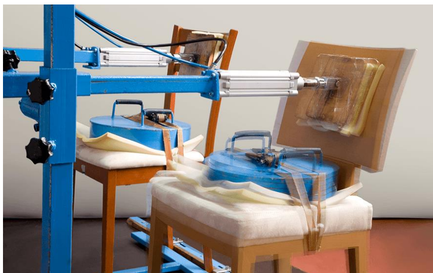
Slika 1. Analiza i kontrola stolica

Ispitivanje kvalitete namještaja i dijelova za namještaj obavlja se prema hrvatskim (HRN) i europskim (EN) normama, kvaliteta namještaja može se ispitivati i prema posebnim zahtjevima. Na namještaju od drva vrše se laboratorijska ispitivanja, tj. utvrđuje kvaliteta materijala, točnost izrade, izdržljivost, stabilnost i otpornost površine svih tipova i vrsta namještaja (namještaj za sjedenje, namještaj za ležanje, namještaj za upotrebu pri jeli i radu, školski namještaj, bolnički namještaj i dr.). Sva ispitivanja kvalitete namještaja od drva provode se u specijaliziranim laboratorijima (slika 1) koji posjeduju akreditaciju (HAA-Hrvatska akreditacijska agencija) prema zahtjevu norme HRN EN ISO / IEC 17025, a cjelokupni sustav certificiran je prema normi EN ISO 9001:2000. Proces proizvodnje obuhvaća tvorničku kontrolu, potvrđivanje dokumenata dobivenih od drugih, laboratorijske analize, izjave sukladnosti te utvrđivanje CE oznake o proizvodu provodi se prema HRN EN ISO/IEC 17065:2013.