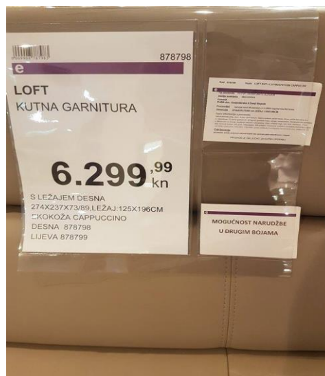
Slika 6. Pravilan način deklariranja tapeciranog namještaja

Na hrvatskom tržištu namještaja nalaze se i deklaracije koje će kupcu dati sve bitne informacije, a one su mu potrebne u konačnom odlučivanju i kupnji proizvoda. Pravi primjer (slika 6) deklaracije koja daje kupcu osnovne informacije kao što su tip proizvoda, zemlja podrijetla, uvoznik, proizvođač, dimenzije, opće informacije, održavanje, i cijena.