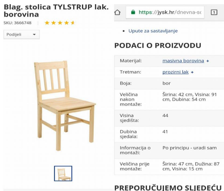
Slika 9. Osnovni opis proizvoda, stolice

Većina trgovina na web stranice stavljaju samo osnovni opis (slika 9) proizvoda (dimenzije, boju, upute o sastavljanju), deklaraciju proizvoda izostavljaju koja je kupcu potrebna u konačnom odlučivanju pri on-line kupnji proizvoda.