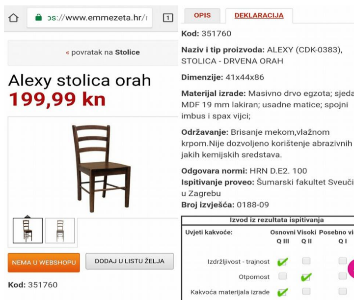
Slika 10. Detaljan opis proizvoda, pravilan način deklariranja stolice

Ispitivanje svojstva drvnih proizvoda za određene tvrtke provodi i Šumarski fakultet (slika 10), a deklaracije koje se nalaze na web stranici daju sve potrebne podatke kupcu, te mu omogućuju bezbrižnu on-line kupovinu.