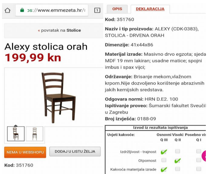
Slika 10. Detaljan opis proizvoda, pravilan način deklariranja stolice

Ispitivanje svojstva drvnih proizvoda za određene tvrtke provodi i Šumarski fakultet (slika 10), a deklaracije koje se nalaze na web stranici daju sve potrebne podatke kupcu, te mu omogućuju bezbrižnu on-line kupovinu.