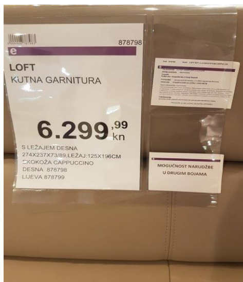
Slika 6. Pravilan način deklariranja tapeciranog namještaja

Na hrvatskom tržištu namještaja nalaze se i deklaracije koje će kupcu dati sve bitne informacije, a one su mu potrebne u konačnom odlučivanju i kupnji proizvoda. Pravi primjer (slika 6) deklaracije koja daje kupcu osnovne informacije kao što su tip proizvoda, zemlja podrijetla, uvoznik, proizvođač, dimenzije, opće informacije, održavanje, i cijena.