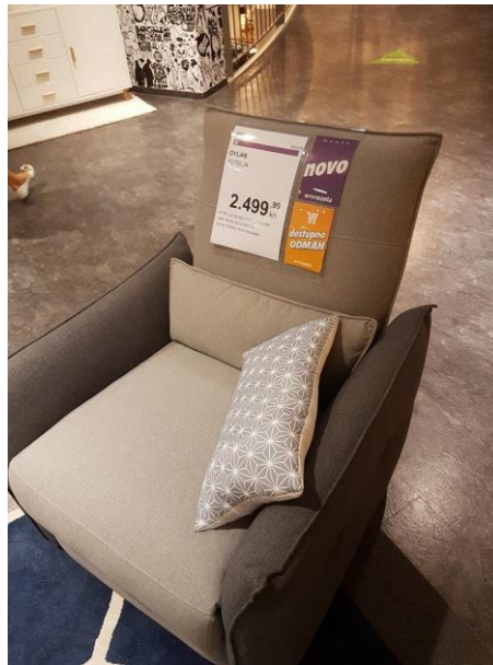
Slika 5. Nepravilna deklaracija tapeciranog namještaja

Prodavač sa dobrim sposobnostima uvjeravanja uspjeh će prodati proizvod slabije kvalitete i nepotpune deklaracije neodlučnom kupcu.