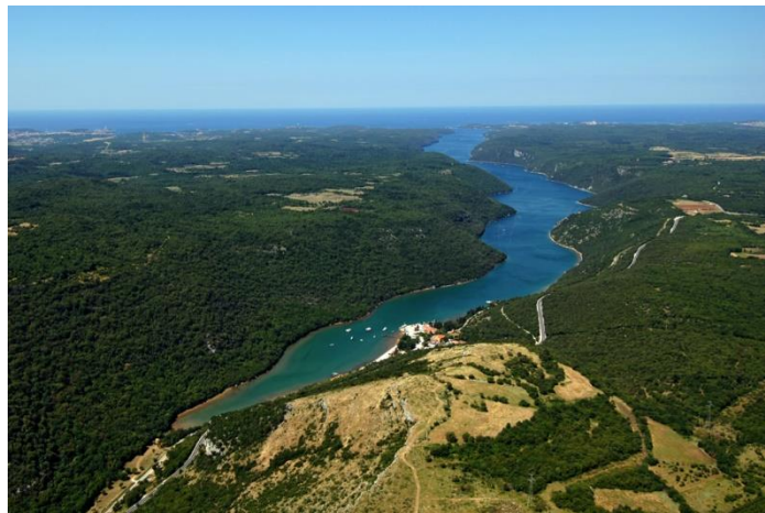
slika 11. Limski zaljev

iznosi 600 metara, a dubine je do 33 metra. 150 metara visoki rubovi kanjona prekriveni su makijom koju čine ( Quercus ilex L.), zelenika ( Phillyrea latifolia L.), planika ( Arbutus unedo L.), lemprika ( Viburnum tinus L.), tetivika ( Smilax aspera L.), tršlja ( Pistacia lentiscus L.), bijeli grab ( Carpinus orientalis Mill.), i crni jasen ( Fraxinus ornus L.), a mjestimece se pojavljuje i zajednica hrasta medunca ( Quercus pubescens Willd.) i hrasta cera ( Quercus cerris L.). Limski zaljev dio je ekološke mreže Natura 2000 i predstavlja područje značajno za vrste i stanišne tipove, a u Hrvatskoj je zaštićen kao značajni krajobraz 1964. godine.