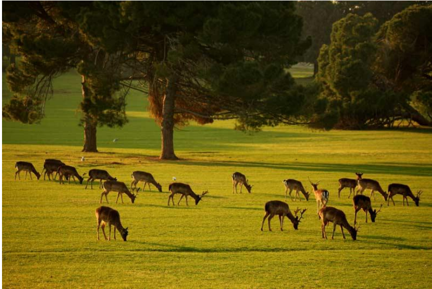
slika 3. Životinje u slobodnoj prirodi NP Brijuni

Drugu komponentu Brijunske faune čini safari park uspostavljen 1978. godine. Riječ je o ograđenom prostoru veličine 9 hektara kojeg nastanjuju egzotične vrste biljojeda: indijski slon, ljama, južnoameričke deve, zebre, nojevi i indijske svete krave. Većina ovih životinja na otoke je dospjelo kao poklon Josipu Brozu Titu, koji je na Brijunima imao svoju rezidenciju. Zahvaljujući blagoj mikroklimi unesene životinje uspjele su se bez većih problema aklimatizirati na Brijunima. Pošto čini većinu nacionalnog parka, ovdje svakako treba spomenuti i Brijunsko podmorje koje se odlikuje velikom brojem različitih biocenoza karakterističnih za sjeverni Jadran. Zbog zaštite koju uživa, ono je ostalo relativno izolirano od onečišćenja pa nije čudno da ovdje pronalazimo dupine, kornjače, periske i prstace koji su zakonom zaštićeni. Također su prisutne i endemske vrste poput Jadranskog bračića i Jadranskog ciganina. Nacionalni park Brijuni, dio je Natura 2000 ekološke mreže kao područje očuvanja značajno za vrste i stanišne tipove.