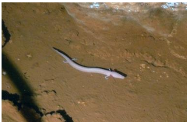
slika 10. Čovječja ribica ( Proteus anguinus )