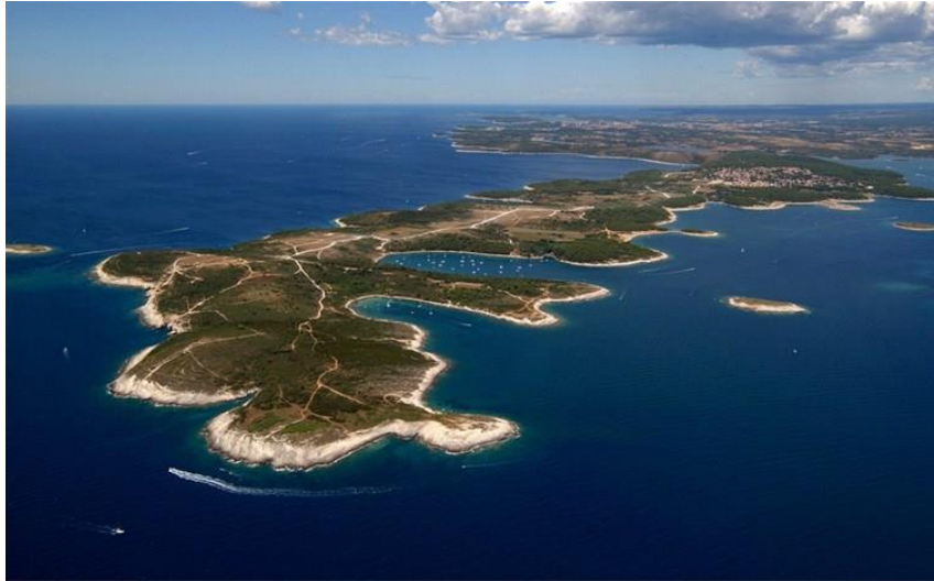
slika 12. Rt kamenjak