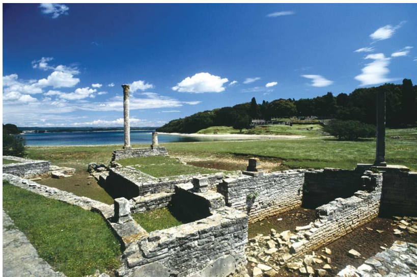
slika 4. Ostaci rimske vile

Krista. Čitav kompleks sastojao se od hramova, ribnjaka, termi, otvorenih i zatvorenih šetnica, a neki su se dijelovi koristili sve do 6. Stoljeća. Uz Rimsku vilu, Kastrum je jedan od dva najveća arheološka lokaliteta koji također potječe iz razdoblja rimske vladavine. Prostire se na površini od 1 ha, a posljednji tragovi života u Kastrumu datiraju iz mletačke vlasti. U blizini kastruma, u 6. stoljeću, podignuta je i crkva sv. Marije čiji su zidovi do danas očuvani u gotovo izvornoj visini. Nakon Rimljana na Brijunima su se izmjenjivale vlasti Bizanta, Franaka, Venecije, Austro-Ugarske, Italije, Jugoslavije i Hrvatske. 1893. Godine, Austrijanac Paul Kupelwieser, kupuje Brijune, a nakon što je uz pomoć dr. Roberta Kocha otoke oslobodio od malarije, započeo je sa izgradnjom hotela i razvojem turizma na Velikom Brijunu.