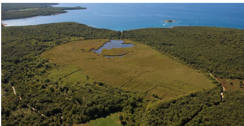
slika 6 Ornitološki rezervat Palud

Svega nekoliko kilometara jugozapadno od Rovinja nalazi se jedini ornitološki rezervat u Istri. Palud je močvarno područje nastalo nakupljanjem nadzemne i podzemne vode sa okolnih uzvisina, a ovisno o količini padalina varira i njegova površina. Nalazi se u neposrednoj blizini mora, od kojeg je odvojen tek uskim pojasom crnikove šume. Osim hrasta crnike područje je okruženo gustom makijom i šumom hrasta medunca. Zbog pojave malarije početkom 20. stoljeća prokopan je kanal koji spaja Palud s morem kako bi se povećao salinitet močvarne vode i onemogućilo razmnožavanje komaraca. Takvi uvjeti provukli su određene morske vrste riba i jegulja koje vole boćatu vodu. Osim riba i specifične močvarne vegetacije, ovaj lokalitet je iznimno vrijedan zbog brojnih vrsta ptica koje Palud korsi kao stalno stanište ili u njemu povremeno borave u vrijeme velikih migracija. Prema podacima nadležne JU Natura Histrice, 2010. godine evidentirano je 220 ptičjih vrsta. Zbog bujne ornitofaune i specifičnosti staništa, Palud je proglašen posebnim ornitološkim rezervatom 2001. godine, te je uvršten u sustav ekološke mreže Natura 2000 kao međunarodno važno područje za ptice s sklopu Akvatorija zapadne Istre.