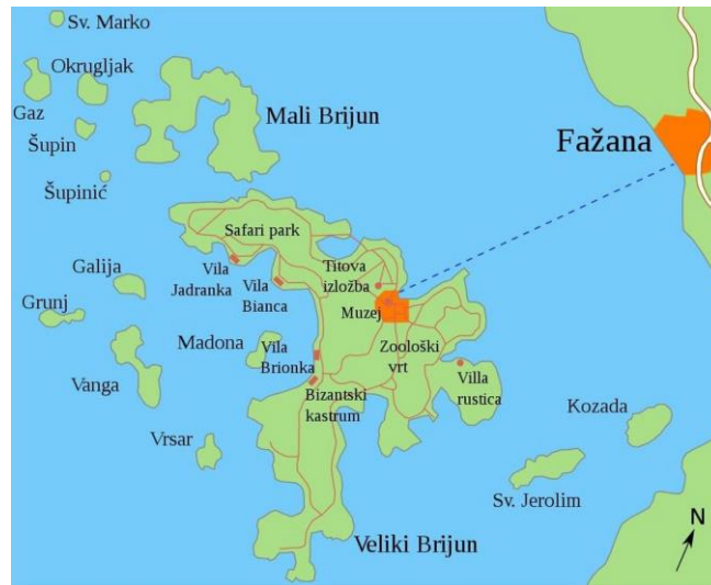
slika 2. Karta NP Brijuni