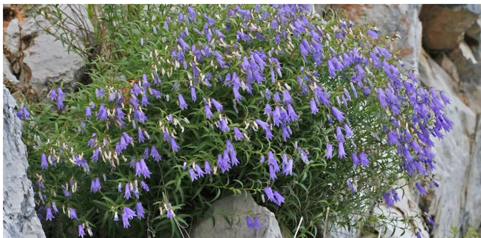
slika 7. Učkarski zvončić ( Campanula tommasiniana )

( Quercus-Carpinetum orientalis H-ić 1939) koje zauzimaju niže pojseve. 9 Na području parka također nalazimo i veće površine pošumljene kulturama crnog bora ( Pinus nigra ) i obične smreke ( Picea abies ). Navedene šumske zajednice oplemenjene su ugroženim i zaštićenim biljnim vrstama kao što su lovorasti likovac ( Daphne laureola ), pasji zub ( Erythronium dens-canis ), ljiljan zlatan ( Lilium martagon ). Dugogodišnjom ljudskom djelatnošću, travnjaci su postepeno zauzeli nekadašnje šumske površine, pa danas na području parka, ovisno o načinu gospodarenja i ekoloških uvjeta, nalazimo niz različitih travnjačkih zajednica koje uvelike doprinose cjelokupnoj bioraznolikosti. Osim šuma i pašnjaka, dio prirodne baštine Učke čine vlažna i slatkovodna staništa, te stijene i točila koja predstavljaju važna staništa endemske vrste Učkarskog zvončića ( Campanula tommasiniana ) i endemske zajednice stijenjarske iglice i bradavičaste krasuljice ( Geranio – Antriscetum fumarioides ). 10