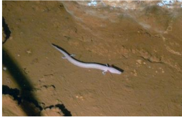
slika 10. Čovječja ribica ( Proteus anguinus )