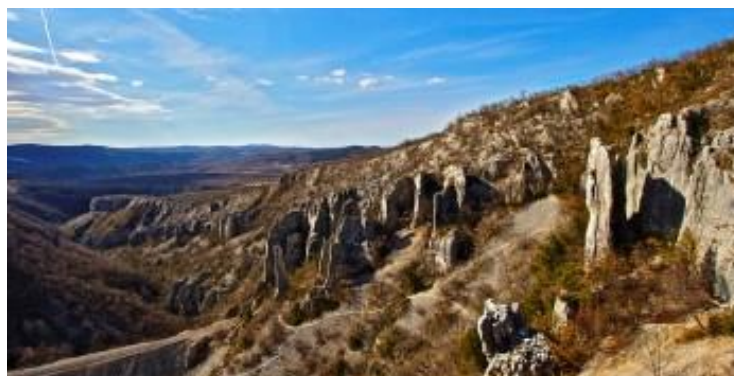
slika 9. Kanjon Vela draga

Na zapadnim padinama Učke, proteže se oko 3 kilometra duga kanjonska udolina Vela draga. Stijene ovog lokaliteta milijunima su godina izložene djelovanju vode, vjetra i sunca koji su ih preoblikovali u jedinstvene krške forme. Posebno su zanimljivi soliterni vapnenački stupovi, od kojih neki visoki i do 100 metara. Oni, u kombinaciji sa strmim stijenama i liticama koje ih okružuju čine ovaj prostor iznimno vrijednim i atraktivnim, zbog čega je Vela draga je 1963. godine zaštićena kao rezervat prirode, a 1998. kao geomorfološki spomenik prirode u sklopu parka prirode Učka.