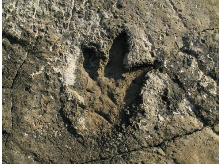
slika 5. Fosilizirani otisak stopala dinosaura

otisaka pronađeni su i slojevi fosiliziranih kućica puža nerinea veličine 3 do 4 cm i promjera 13 milimetara. 4