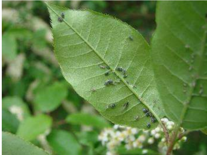
Slika 5. Aphididae na donjoj strani lista

Aphididae uzrokuju klorotičnost i deformacije lisnih dijelova na kojima žive. Pri jakom napadu dolazi do zastoja u rastu i fiziološkog slabljenja napadnutih stabala (Slika 5.).