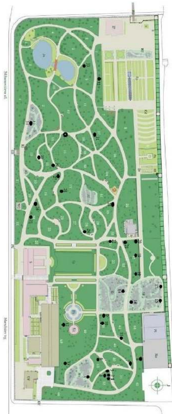
Slika 16. Prikaz stabala na kojima su pronađeni štetnici 05.06.2016.