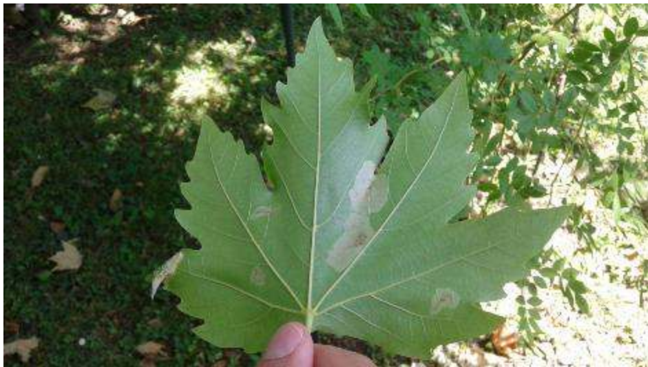
Slika 23. Mine na listu platane

Gusjenice stvaraju duguljaste mine na donjoj strani lista, a uzrokuju fiziološko slabljenje stabla i narušavaju estetski izgled (Slika 23.).