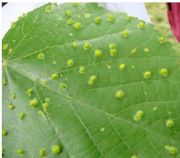
Slika 13. Okruglaste šiške na gornjoj strani lista

Stajalište 22./ Monarthropalpus buxi Laboulb.- šimširova muha šiškarica/ Buxus sempervirens L.