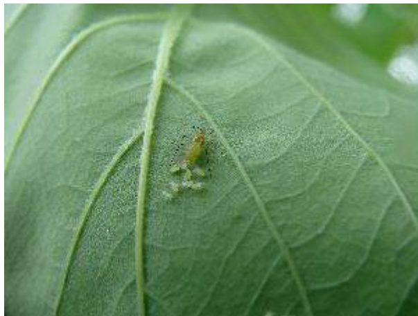
Slika 15. Viviparna ženka odlaže žive mlade na donjoj strani lista

I. liriodendri je invazivna strana vrsta prvi puta zabilježena u Hrvatskoj 2014. godine u Poreču. U Zagrebu prvi puta je zabilježena 2015. na više lokacija (Franjević, 2015). To je monofagna, polivoltina, monecična vrsta. Jak napad ove vrste uzrokuje sušenje i prerano otpadanje lista. Vrsta stvara mednu rosu zbog čega se skupljaju ose, pčele i mravi i djeluje kao izraziti molestans u urbanim sredinama. U Zagrebu ima oko 570 stabala tulipanovca zbog čega je ova vrsta značajna iako nije autohtona (Slika 15.).