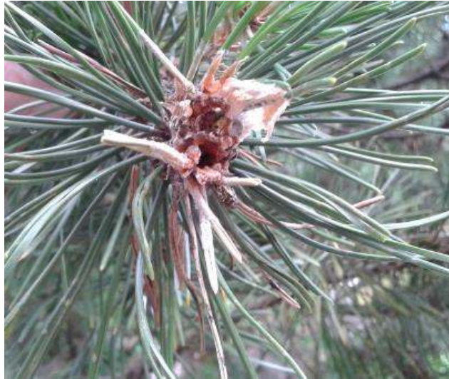
Slika 26. Požderana unutrašnjost i lučenje smole na bazi izbojka

Oligofagni štetnik borova koji uzrokuje odumiranje i savijanje izbojaka, a posljedice su anomalije rasta te formiranje nepravilnog i grmolikog vrha. Stabla ne odumiru, ali imaju nepravilan rast i smanjen estetski izgled.