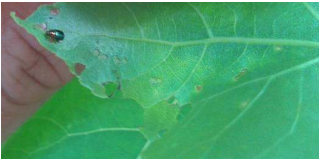
Slika 20. Adult zlatice s rupičastim grizotinama na listu

Stajalište 14./ Cynips spp.- ose šiškarice, Tischeria ekebladella Bjerk.- hrastov moljac miner/ Quercus petraea (Matt.) Liebl.