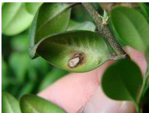
Slika 14. Mjehurasta nabreknuća na donjoj strani lista

Klorotične pjege na listu i mjehurasta nabreknuća na donjoj strani lista. Ličinke miniraju unutrašnjost lista. Kod jakog napada, narušena je samo estetika stabla, ne dovodi do odumiranja (Slika 14.).