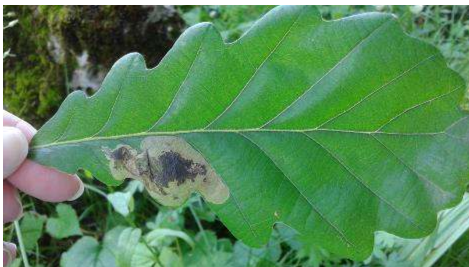
Slika 21. Mina u kojoj su vidljivi ekskrementi

Gusjenice hrastovog moljca minera, razvijaju mjehuraste mine dok se razvijaju u unutrašnjosti lista. Razvoj mina traje do jeseni zbog čega ova vrsta nije osobito štetna jer koincidira s koncem vegetacije (Slika 21.).