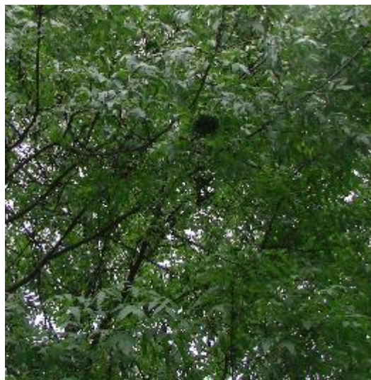
Slika 10. Kuglaste formacije na vršnim granama

Vidljive kuglaste formacije na vršnim granama. Stvaraju ih pokretne sivoplave uši prekrivene naslagama bijele voštane tvari. Sisanjem uzrokuju kovrčanje lista i stvaranje kuglastih formacija. Štete uglavnom estetske (Slika 10.).