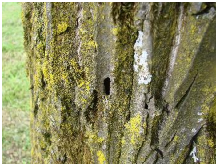
Slika 8. Izlazni hodnici cvilidreta

Stajalište 11./ Hylecoetus dermestoides L.- smeđasti drvaš, Cerambicidae/ Robinia pseudoacacia L.