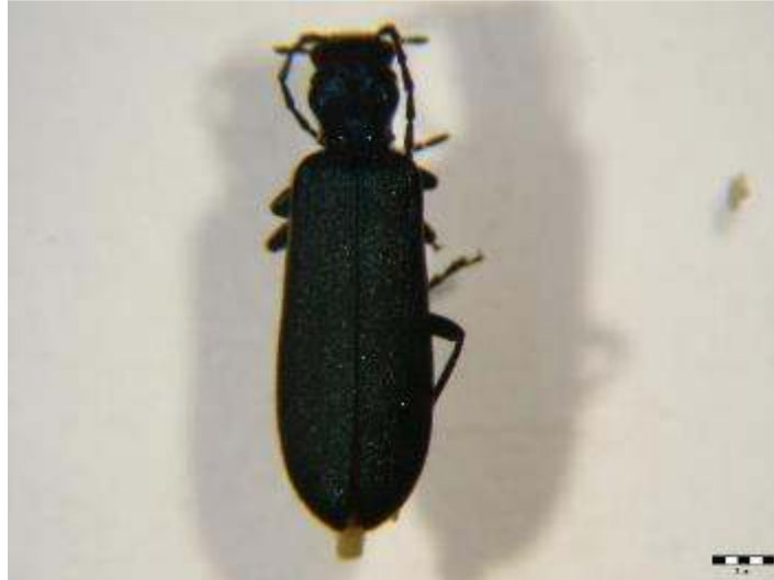
Slika 7. Predstavnik saproksilične porodice Silvanidae- snimljeno u laboratoriju Šumarskog fakulteta

Ova vrsta nije šumski štetnik, ali zbog svojeg saproksiličnog načina života ukazuje na starost i slab fiziološki status stabala u Vrtu (Slika 7.).