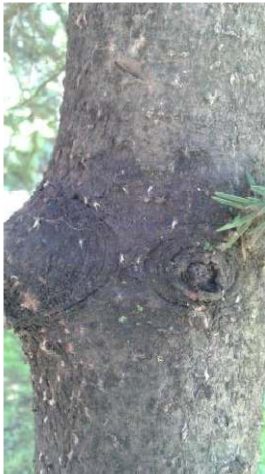
Slika 17. Krilata generacija uši na deblu

Nakon 6 tjedana od prvog terenskog obilaska, na istim stablima, pronađena je generacija krilatih uši na kori grana i debla, a vidljivo je i odumiranje pojedinih izbojaka kao posljedica sisanja uši (Slika 17.).