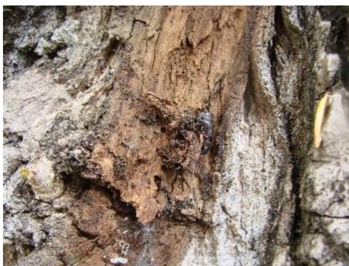
Slika 9. Kukuljični svlak i piljevina od koje je bio formiran kokon

Ksilofagna vrsta i primarni štetnik čije se gusjenice dvije godine razvijaju u zoni pridanka ili u debelom korijenju. Piljevinu, grizotine drva i izmet ne izbacuju van. Od grizotina načini kokon i u njemu se kukulji na izlaznoj rupi. Dovodi do odumiranja stabla i gubitka strukturne čvrstoće stabla, a moguće su i vjetroizvale prilikom višegodišnjeg napada ove vrste (Slika 9.)