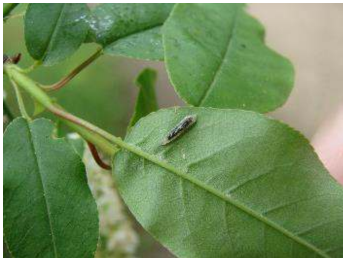
Slika 6. Pagusjenica C. annulipes Klug na donjoj strani lista

Caliroa annulipes Klug izrazito je polifagna vrsta, voli otvorena područja. Simptomi napada su skeletiranje na donjoj strani lista. Štete su obično estetske naravi, a kod mladih stabala mogu biti i značajnije. Ova vrsta je polivoltina (razvija tri generacije godišnje) (Slika 6.).