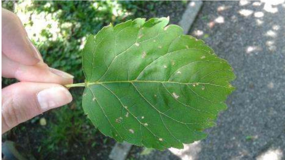
Slika 19. Skeletirani list jasena s očuvanom gornjom epidermom

Stajalište 9./ Hylecoetus dermestoides L. – smeđasti drvaš/ Juglans mandshurica Maxim.