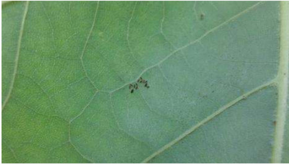
Slika 22. Ličinke platanine mrežaste stjenice na donjoj strani lista

smanjivanje asimilacijske površine, ranije odbacivanje lista i narušava estetski izgled stabla (Slika 24.).