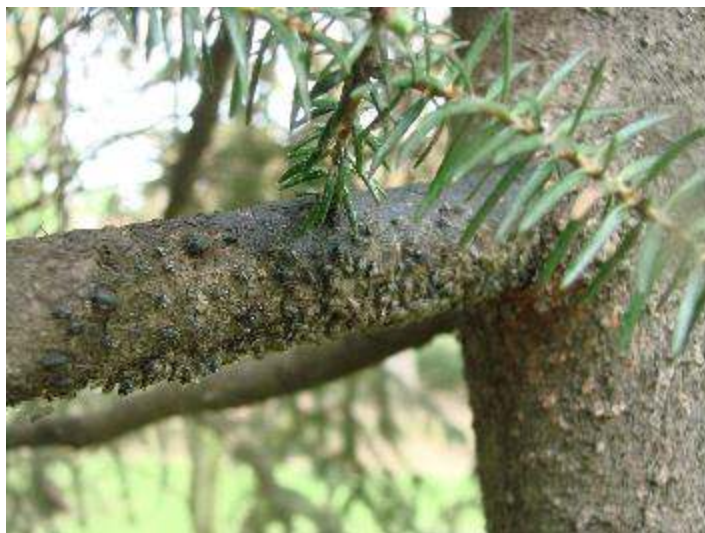
Slika 4. C. pilicornis (Hartig) na grani i deblu

Masovna pojava na deblu, izbojcima i granama navedenih vrsta drveća. Čak i jak napad ne prouzrokuje veće štete, ali primijećeno je odumiranje pojedinačnih izbojaka (Slika 4.)