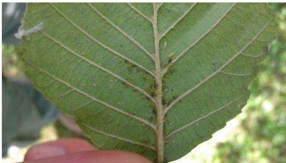
Slika 25. Uši na donjoj strani lista

Aphididae uzrokuju klorotičnost i deformacije lisnih dijelova na kojima žive. Pri jakom napadu dolazi do zastoja u rastu i fiziološkog slabljenja napadnutih stabala (Slika 25.).