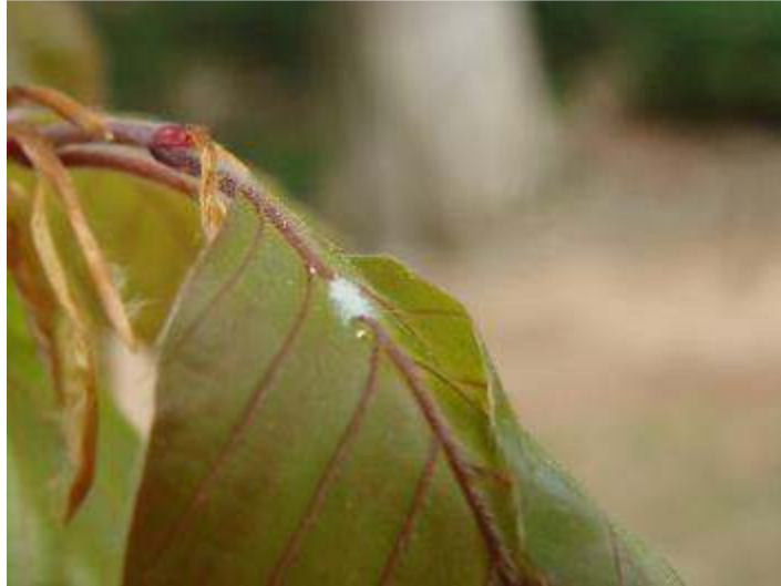
Slika 3. P. fagi L. na donjoj strani lista

Na lišću bukve, na donjoj strani lista uši prekrivene bijelim voskom te pojava medne rose. Lišće požuti kao posljedica hranjenja uši, a podložno je i napadu gljiva čađavica (Slika 3.)