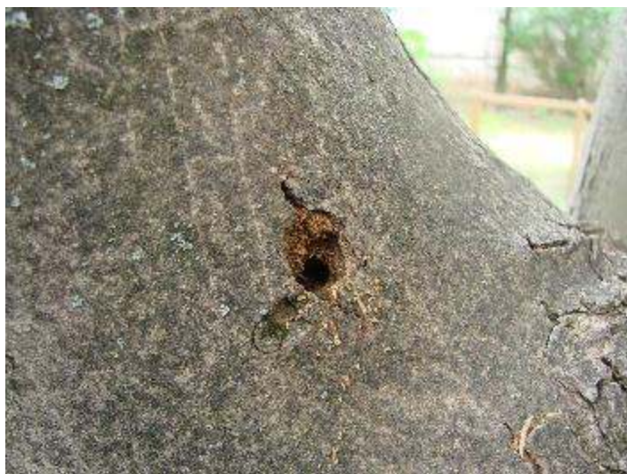
Slika 11. Izlazni hodnik strizibuba iz kojeg sipi piljevina

Stajalište 18., 21./ Eryophyes tiliae Pgst.- grinja šiškarica na lipi/ Vrsta: 18. Tilia cordata Mill., 21. Tilia platyphyllos Scop.