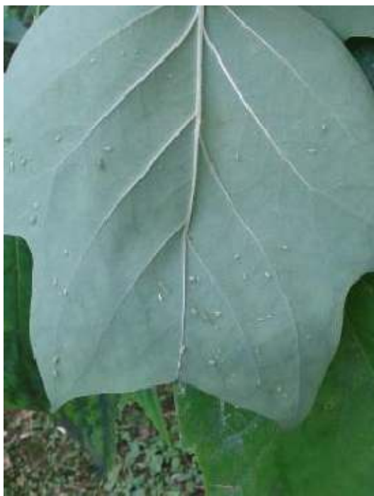
Slika 24. Hranjenje ličinki na donjoj strani lista

Stajalište 32./ Aphididae/ Alnus incana (L.) Moench ssp. tenuifolia (Nutt.)