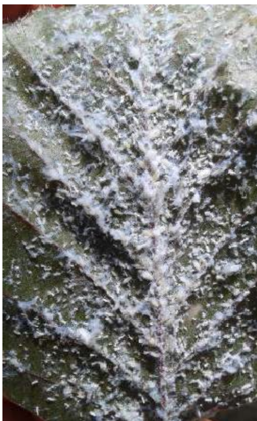
Slika 18. Uši prekrivene bijelim voštanim slojem na donjoj strani lista

Stajalište 7., 17./ Prociphillus spp.- jasenove lisne uši/ Vrsta: 7. Fraxinus angustifolia Vahl, 17. Fraxinus ornus L.