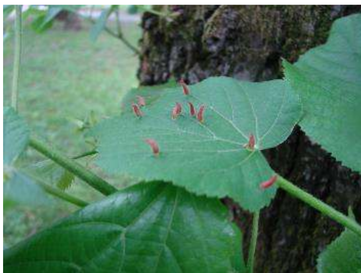
Slika 12. Šiške u obliku roščića na gornjoj strani lista

Lisne šiške karakterističnog su oblika, nalik na roščiće na gornjoj strani lista. Bezbojne ili žućkastonarančaste. Štete se estetske (Slika 12.).