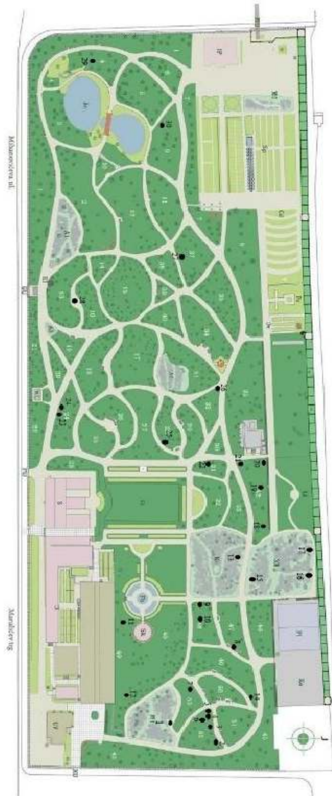
Slika 2. Prikaz stabala na kojima su pronađeni štetnici 23.04.2016.